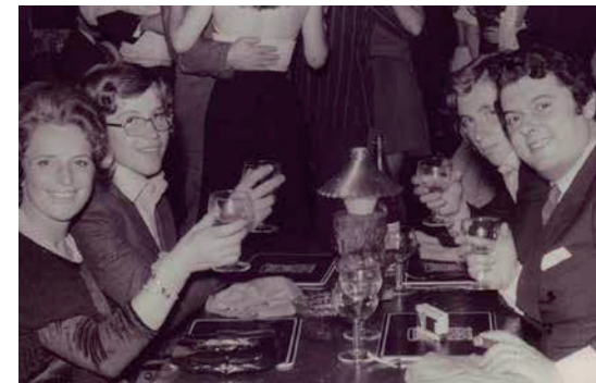
La famiglia Rabotti negli anni 70.

Ridere, sognare, cantare, vincere, amare. Sono solo alcuni dei verbi che rappresentano da sempre la filosofia di Monte Rossa. Si trovano insieme a conquistare, viaggiare, piacere, scoprire e nascere sulle capsule dei Franciacorta della Cantina, il primo punto di contatto con chi sceglie di brindare con Monte Rossa.