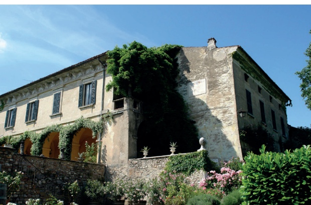
La Villa storica Monte Rossa