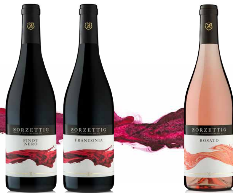
PINOT NERO / FRANCONIA