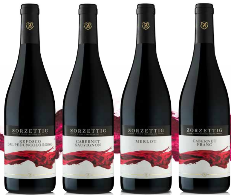
REFOSCO DAL PEDUNCOLO ROSSO / CABERNET SAUVIGNON MERLOT / CABERNET FRANC