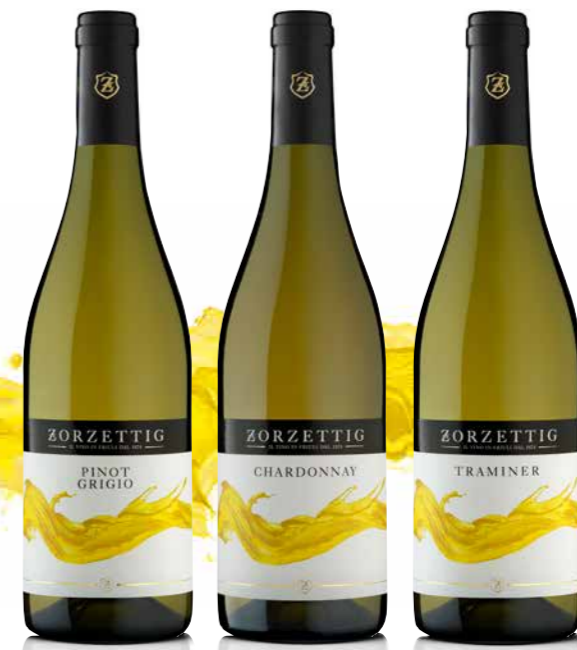
PINOT GRIGIO / CHARDONNAY TRAMINER AROMATICO