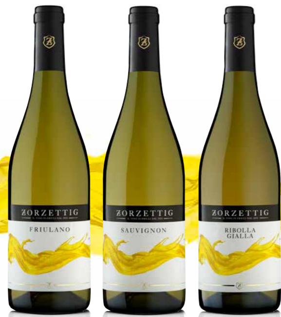
FRIULANO / SAUVIGNON RIBOLLA GIALLA