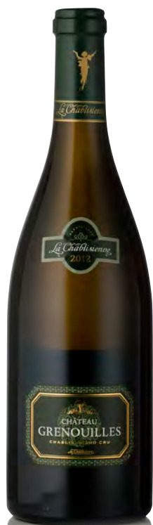
CHABLIS Grand Cru "Château Grenouilles"

Vitigno: Chardonnay 100% Tipo di vino: bianco fermo Vinificazione e affinamento: selezione delle migliori uve della denominazione - fermentazione e affinamento in fûts nuovi 40% per 16 mesi