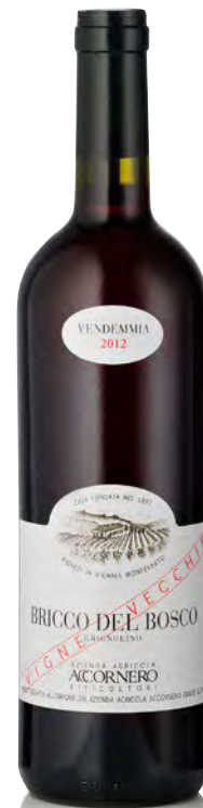
GRIGNOLINO DEL MONFERRATO CASALESE DOC VIGNE VECCHIE "BRICCO DEL BOSCO"

Vitigno: Grignolino Tipo di vino: rosso fermo Vinificazione e affinamento: fermentazione e vinificazione in acciaio