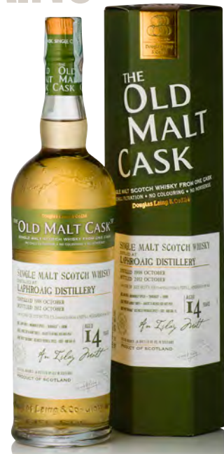
OLD MALT CASK LAPHROAIG DISTILLERY