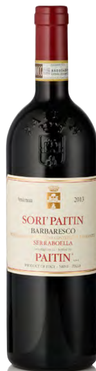
BARBARESCO DOCG "SORÌ PAITIN"

Vitigno: Nebbiolo Tipo di vino: rosso fermo Vinificazione e affinamento: fermentazione e macerazione in vasche verticali con cappello sommerso - affinamento 20 mesi legno grande