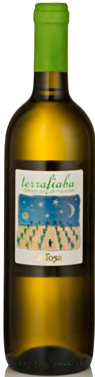
COLLI PIACENTINI DOC ORTRUGO VIVACE "TERRAFIABA"

Vitigno: Malvasia 40% - Ortrugo 40% - Trebbiano 20%