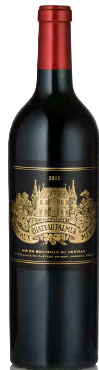
CHÂTEAU PALMER 3 ème Grand Cru Classé - Margaux

Vitigno: Cabernet S. 61% - Merlot 34% - Cabernet F. 5% Tipo di vino: rosso Vinificazione e affinamento: fermentazione in cemento e tini di legno - affinamento barriques nuove 50% per 18 mesi