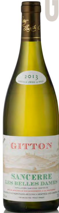
SANCERRE "Les Belles Dames"

Vitigno: Sauvignon 100% Tipo di vino: bianco fermo Vinificazione e affinamento: fermentazione con lieviti indigeni - affinamento 6 mesi acciaio