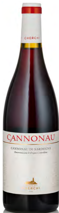
CANNONAU DI SARDEGNA DOC

Vitigno: Vermentino Tipo di vino: bianco passito Vinificazione e affinamento: appassimento in pianta con muffa nobile - affinamento in acciaio e legno piccolo per 10 mesi