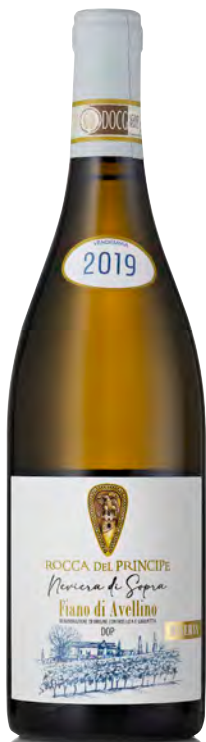
FIANO DI AVELLINO DOCG "RISERVA NEVRIERA DI SOPRA"

Vitigno: Fiano Tipo di vino: bianco Vinificazione e affinamento: Fermentazione in acciaio - Malolattica non svolta - Affinamento in acciaio su fecce fini per 15 mesi