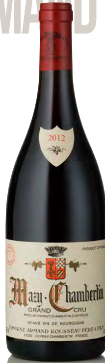
MAZY-CHAMBERTIN Grand Cru

Vitigno: Pinot nero 100% Tipo di vino: rosso fermo Vinificazione e affinamento: uve interamente diraspate - fermentazione in tini legno e acciaio aperti - affinamento fûts nuovi 80% per 18 mesi