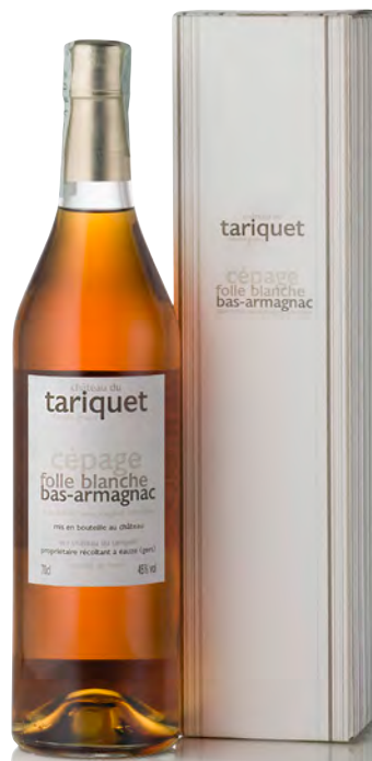
BAS-ARMAGNAC FOLLE BLANCHE