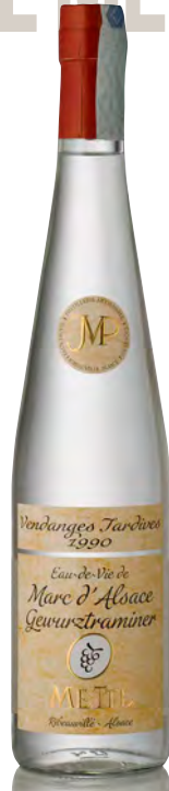
MARC DE GEWÜRZTRAMINER VENDAGES TARDIVES 1990