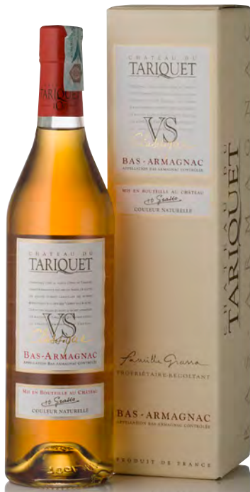
BAS-ARMAGNAC V.S. CLASSIQUE