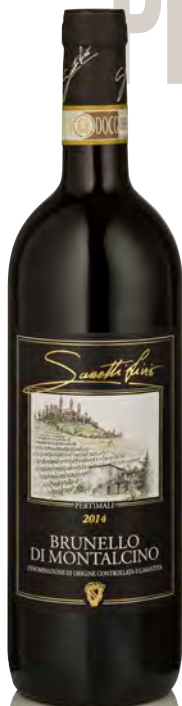
BRUNELLO DI MONTALCINO DOCG

Vitigno: Sangiovese grosso Tipo di vino: rosso fermo Vinificazione e affinamento: fermentazione acciaio - macerazione 15 giorni - affinamento 36 mesi legno grande