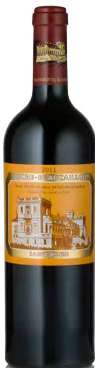
CHÂTEAU DUCRU BEAUCAILLOU 2 ème Grand Cru Classé - Saint Julien

Vitigno: Cabernet S. 66% - Merlot 24% - Cabernet F. 10% Tipo di vino: rosso Vinificazione e affinamento: fermentazione in legno, acciaio e cemento - affinamento barriques nuove fino al 100% a seconda dell'annata