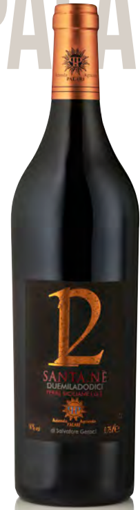
SICILIA IGT "SANTA.NÈ"

Vitigno: Nerello Mascalese 50% - Nerello Cappuccio 30% - Nocera 10% - altri vitigni 10% Tipo di vino: rosso Vinificazione e affinamento: fermentazione acciaio con lieviti autoctoni - affinamento barrique nuova per 24 mesi