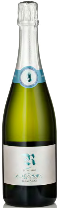
TRENTO DOC R EXTRA BRUT

Vitigno: Chardonnay Tipo di vino: metodo classico bianco Vinificazione e affinamento: fermentazione acciaio - almeno 20 mesi sui lieviti