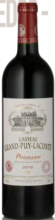
CHÂTEAU GRAND-PUY-LACOSTE 5 ème Grand Cru Classé - Pauillac

Vitigno: Cabernet S. 75% - Merlot 20% - Cabernet F. 5% Tipo di vino: rosso Vinificazione e affinamento: diraspatura totale fermentazione acciaio - affinamento barriques nuove 60% per 18 mesi