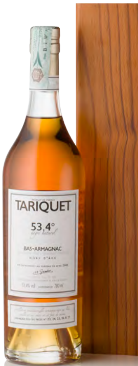
BAS-ARMAGNAC HORS D'AGE 53,4°