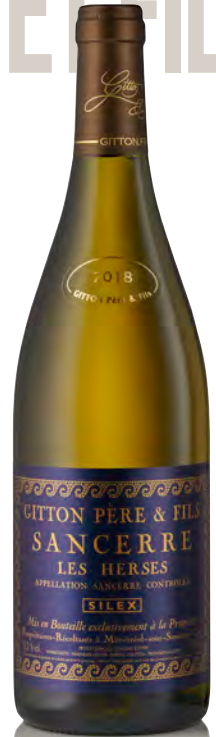
SANCERRE "Les Herces"

Vitigno: Sauvignon 100% Tipo di vino: bianco fermo Vinificazione e affinamento: fermentazione con lieviti indigeni - affinamento 6 mesi acciaio