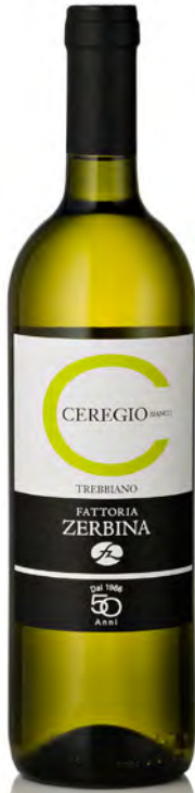
TREBBIANO DOC ROMAGNA BIANCO "CEREGIO"

Vitigno: Trebbiano Tipo di vino: bianco fermo Vinificazione e affinamento: fermentazione acciaio - affinamento acciaio e cemento