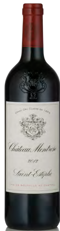
CHÂTEAU MONTROSE 2 ème Grand Cru Classé - Saint Estèphe

Vitigno: Cabernet S. 74% - Merlot 23% - Cabernet F. 2% - Petit Verdot 1% Tipo di vino: rosso Vinificazione e affinamento: fermentazione in tini legno e acciaio e termina in barriques di secondo passaggio - affinamento in barriques nuove 70% per 18 mesi