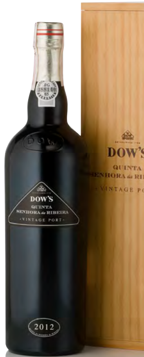
DOW'S VINTAGE PORT QUINTA "SENHORA DE RIBEIRA"