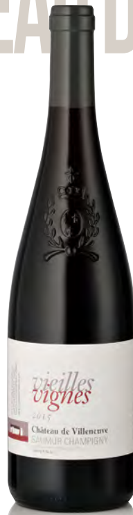
SAUMUR CHAMPIGNY "Vieilles Vignes"

Vitigno: Cabernet franc 100% Tipo di vino: rosso fermo Vinificazione e affinamento: lieviti indigeni - macerazione prefermentativa a freddo 4 giorni - fermentazione tini legno - affinamento legno da 500 lt., acciaio e cemento