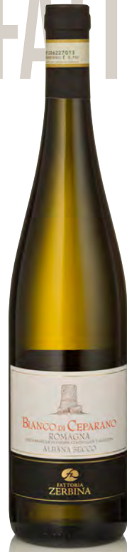
ALBANA SECCO DOCG ROMAGNA "BIANCO DI CEPARANO"

Vitigno: Trebbiano Tipo di vino: bianco fermo Vinificazione e affinamento: fermentazione acciaio - affinamento acciaio e cemento