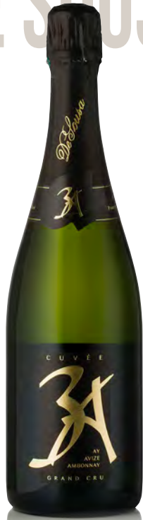
CHAMPAGNE EXTRA BRUT Grand Cru Cuvée "3A" Avize-Aj-Ambonnay

Vitigno: Chardonnay 50% - Pinot noir 50% Tipo di vino: metodo classico bianco Vinificazione e affinamento: fermentazione in acciaio per Chardonnay e barriques per Pinot nero - permanenza sui lieviti 48 mesi - 20% vini di riserva