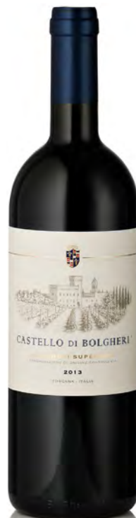
BOLGHERI SUPERIORE DOC "CASTELLO DI BOLGHERI"

Vitigno: Cabernet Sauvignon 60% - Cabernet Franc 5% - Merlot 15% - Petit Verdot 5% Tipo di vino: rosso fermo Vinificazione e affinamento: fermentazione acciaio - macerazione di 20 giorni - affinamento 12 mesi tonneaux e barrique