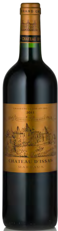
CHÂTEAU D'ISSAN 3 ème Grand Cru Classé - Margaux

Vitigno: Cabernet S. 50% - Merlot 35% - Cabernet F. 10% - Petit Verdot 5% Tipo di vino: rosso Vinificazione e affinamento: fermentazione in cuves di cemento - affinamento barriques nuove 50% per 18 mesi