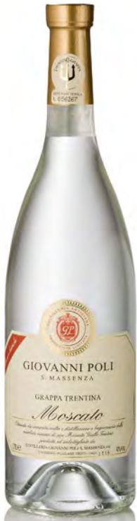
GRAPPA DI MOSCATO