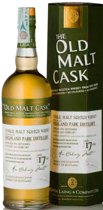
OLD MALT CASK HIGHLAND PARK DISTILLERY