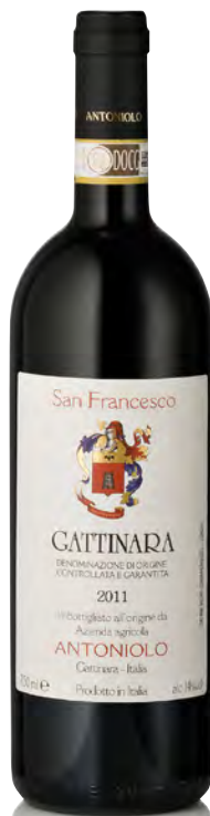
GATTINARA DOCG "VIGNETO SAN FRANCESCO"

Vitigno: Nebbiolo Tipo di vino: rosso fermo Vinificazione e affinamento: fermentazione in cemento con lieviti indigeni - macerazione sulle bucce 20 gg. - affinamento tonneaux, barriques e legno grande 36 mesi