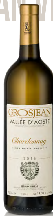
VALLE D'AOSTA DOC CHARDONNAY

Vitigno: Petite Arvine Tipo di vino: bianco fermo Vinificazione e affinamento: pied de cuve indigeno - 6 mesi acciaio "sur lie" e 6 mesi barrique