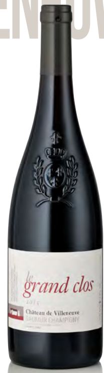
SAUMUR CHAMPIGNY "Le Grand Clos"

Vitigno: Cabernet franc 100% Tipo di vino: rosso fermo Vinificazione e affinamento: lieviti indigeni - fermentazione tini legno troncoconici - affinamento botti legno da 500 lt. di 2 e 3 anni