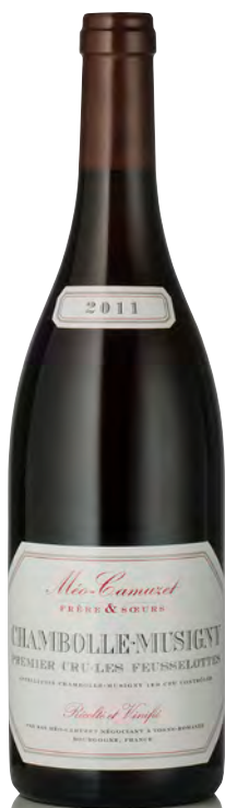
CHAMBOLLE-MUSIGNY 1 er Cru "Les Feusselottes"

Vitigno: Pinot nero 100% Tipo di vino: rosso fermo Vinificazione e affinamento: diraspatura parziale - fermentazione tini legno aperti - affinamento fûts nuovi 80%