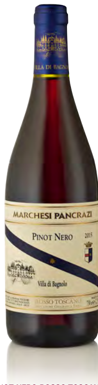
PINOT NERO ROSSO TOSCANO IGT "VILLA BAGNOLO"

Vinificazione e affinamento: diraspatura e fermentazione in acciaio - affinamento barrique 3° e 4° passaggio per 12 mesi