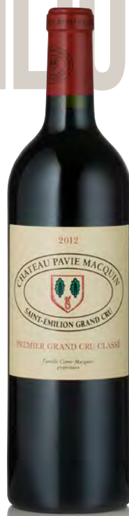
CHÂTEAU PAVIE MACQUIN

Vitigno: Merlot 65% - Cabernet F. 25% - Cabernet S. 10% Tipo di vino: rosso Vinificazione e affinamento: diraspatura totale - fermentazione tini legno - affinamento barriques nuove 80/100% per 24 mesi