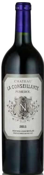
CHÂTEAU LA CONSEILLANTE Pomerol

Vitigno: Merlot 70% - Cabernet F. 25% - Cabernet S. 5% Tipo di vino: rosso Vinificazione e affinamento: fermentazione in tini legno termoregolati - affinamento barriques nuove 50% per 18 mesi