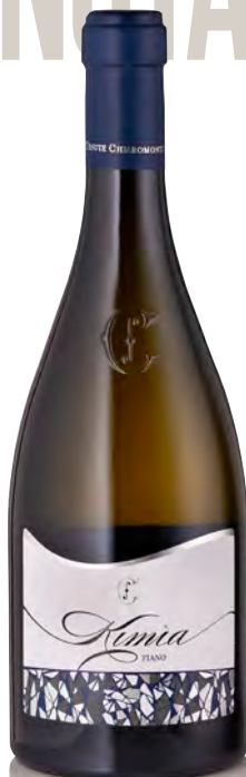
FIANO IGP PUGLIA "KIMIA"

Vitigno: Chardonnay 90%-Fiano Minutolo 10% Tipo di vino: metodo classico bianco Vinificazione e affinamento: fermentazione acciaio bloccata come previsto dal metodo ancestrale - 24 mesi sui lieviti