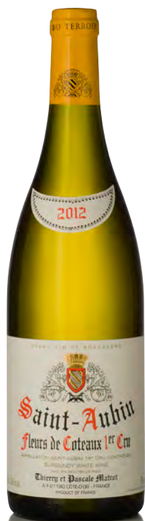
SAINT-AUBIN BLANC 1 er Cru "Fleurs de Coteaux"

Vitigno: Chardonnay 100% Tipo di vino: bianco fermo Vinificazione e affinamento: lieviti indigeni - fermentazione e affinamento in fûts nuovi 10% per 12 mesi - leggero bâtonnage a seconda delle annate