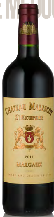
CHÂTEAU MALESCOT SAINT EXUPÉRY 3 ème Grand Cru Classé - Margaux

Vitigno: Cabernet S. 43% - Merlot 33% - Cabernet F. 19% - Petit Verdot 5% Tipo di vino: rosso Vinificazione e affinamento: fermentazione in cemento, legno e acciaio - affinamento in barriques nuove 45% per 15 mesi