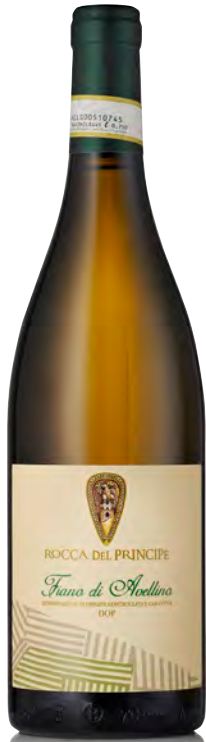
FIANO DI AVELLINO DOCG

Vitigno: Fiano Tipo di vino: bianco Vinificazione e affinamento: Fermentazione in acciaio - Malolattica parzialmente svolta - Affinamento in acciaio su fecce fini per 10 mesi in acciaio