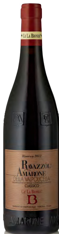
AMARONE DELLA VALPOLICELLA CLASSICO RISERVA "RAVAZZÒL"

Vitigno: Corvina 70% - Corvinone 20% - Rondinella e Molinara 10% Tipo di vino: rosso Vinificazione e affinamento: appassimento in cassetta fino a gennaio - fermentazione in acciaio-affinamento legno da 30 hl per 42 mesi