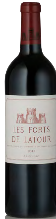
LES FORTS DE LATOUR Pauillac

Vitigno: Cabernet S. 80% - Merlot 15% - Cabernet F. 3% - Petit Verdot 2% Tipo di vino: rosso Vinificazione e affinamento: fermentazione acciaio separata per vitigno - affinamento barriques nuove 100% per 18/20 mesi