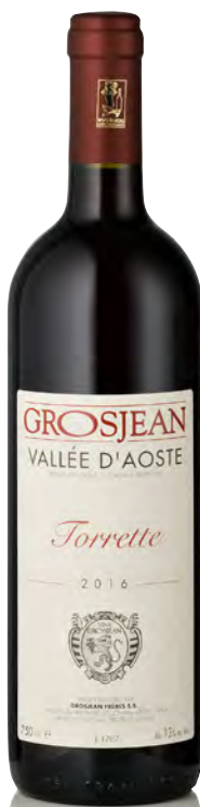
VALLE D'AOSTA DOC TORRETTE

Vitigno: Muscat Petit Grain Tipo di vino: bianco fermo Vinificazione e affinamento: pied de cuve indigeno - affinamento acciaio su feccia per 6 mesi