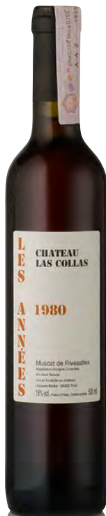
MUSCAT DE RIVESALTES "1980"

Vitigno: Grenache noir 100% Tipo di vino: bianco dolce Vinificazione e affinamento: lieviti indigeni - fermentazione acciaio - mutizzazione con Marc - breve affinamento acciaio