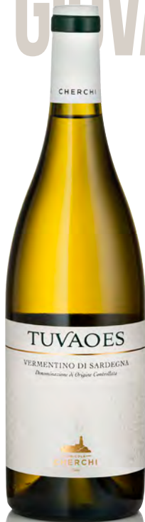
VERMENTINO DI SARDEGNA DOC "TUAOES"

Vitigno: Vermentino Tipo di vino: bianco fermo Vinificazione e affinamento: Fermentazione in acciaio con lieviti autoctoni - Breve affinamento in acciaio