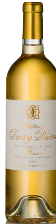
CHÂTEAU DOISY-DAËNE 2 ème Grand Cru Classé - Sauternes

Vinificazione e affinamento: Uve bottrizzate - Fermentazione barriques - Affinamento 18 mesi barriques