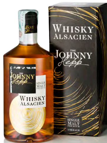
WHISKY ALSACIEN SINGLE MALT PREMIUM