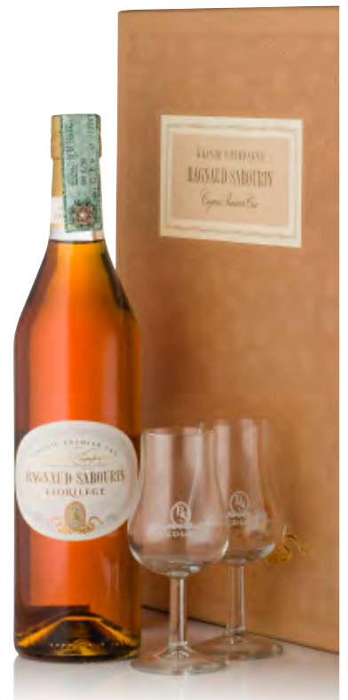
COGNAC GRANDE CHAMPAGNE FLORILÈGE COFANETTO CON DUE BICCHIERI