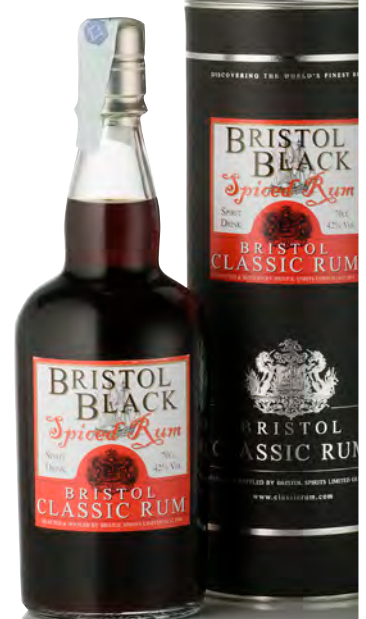
"BRISTOL BLACK" SPICED RUM

Blend of Trinidad & Tobago and Mauritius Rums