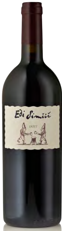
GORIŠKA BRDA "DUET"

Vitigno: Merlot 80% - Cabernet S. 10% - Cabernet F. 10% Tipo di vino: rosso Vinificazione e affinamento: fermentazione in acciaio-macerazione 15 gg-affinamento barrique nuova 20% e 2 2 / 3 ° passaggio 80% per 22 mesi