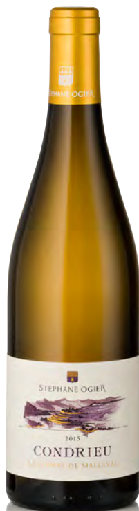
CONDRIEU "La Combe de Malleval"

Vitigno: Marsanne 100% Tipo di vino: bianco fermo Vinificazione e affinamento: fermentazione con lieviti indigeni in tonneaux e legno grande - affinamento legno grande per 10 mesi