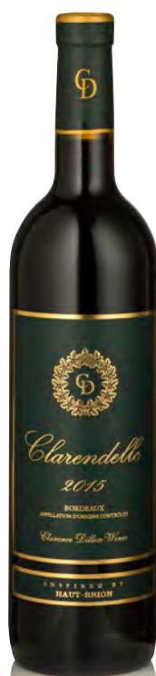
CLARENDELLE Bordeaux - Inspired by Haut-Brion

Vitigno: Cabernet S. 65% - Merlot 30% - Cabernet F. 5% Tipo di vino: rosso Vinificazione e affinamento: fermentazione in piccoli tini di legno con pigeage manuali - affinamento barriques nuove 60% per 18 mesi