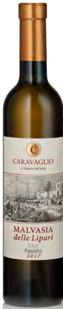
MALVASIA DELLE LIPARI DOC PASSITA

Vitigno: Malvasia 95% - Corinto nero 5% Tipo di vino: bianco passito Vinificazione e affinamento: appassimento su graticci al sole 20 giorni - lieviti autoctoni - affinamento 6 mesi legno e acciaio