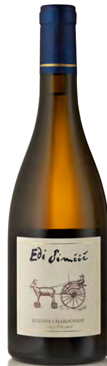
GORIŠKA BRDA CHARDONNAY "KOZANA"

Vitigno: Sauvignon Tipo di vino: bianco Vinificazione e affinamento: breve macerazione di 4 ore - fermentazione e affinamento barrique nuova 20% e 2°/3°/4° passaggio 80% per 11 mesi