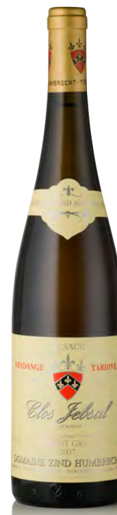
PINOT GRIS D'ALSACE "CLOS JÉBSAL" Vendange Tardive

Vitigno: Muscat d'Alsace 90% - Muscat Ottonel 10% Tipo di vino: bianco fermo Vinificazione e affinamento: lunghissima fermentazione con lieviti indigeni, almeno 6 mesi sur lies - affinamento legno grande per 18 mesi