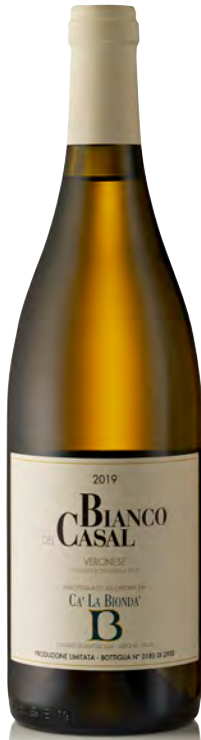
BIANCO VERONESE IGT "BIANCO DEL CASAL"

Vitigno: Garganega 50% - Trebbiano 50% Tipo di vino: bianco Vinificazione e affinamento: diraspatura e macerazione di 6 ore - fermentazione e affinamento barrique di 2° e 3° passaggio per 6 mesi