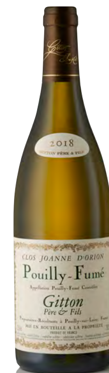
POUILLY-FUMÉ "Clos Joanne d'Orion"

Vitigno: Sauvignon 100% Tipo di vino: bianco fermo Vinificazione e affinamento: fermentazione con lieviti indigeni - affinamento 11 mesi per metà tonneaux nuovi e per metà di un anno