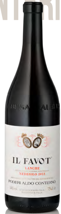
LANGHE NEBBIOLO DOC "IL FAVOT"

Vitigno: Barbera Tipo di vino: rosso fermo Vinificazione e affinamento: macerazione sulle bucce in acciaio per 8/10 giorni - affinamento acciaio per 12 mesi e barrique per 12 mesi