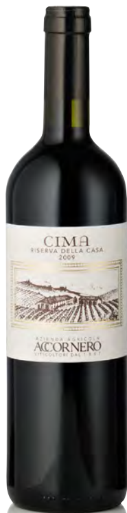
BARBERA DEL MONFERRATO DOC SUPERIORE RISERVA "CIMA"

Vitigno: Barbera Tipo di vino: rosso fermo Vinificazione e affinamento: fermentazione in tonneau con lieviti indigeni cappello sommerso - affinamento tonneau 36 mesi