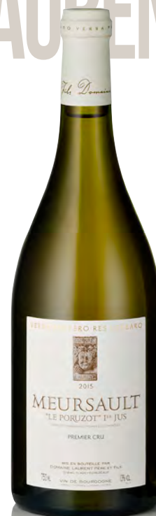
MEURSAULT 1 er Cru "Le Poruzot"

Vitigno: Chardonnay 100% Tipo di vino: bianco fermo Vinificazione e affinamento: fermentazione e affinamento fûts nuovi 20% per 12 mesi