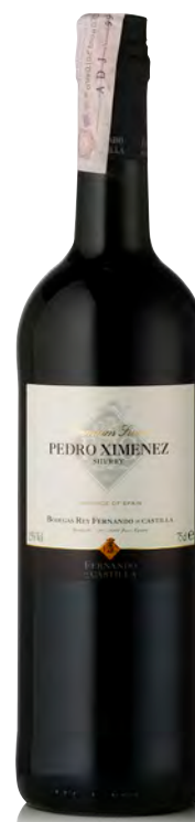
PREMIUM SHERRY PEDRO XIMENEZ

Vitigno: Palomino fino 90% - Pedro Ximenez 10% Tipo di vino: rosso dolce Vinificazione e affinamento: aggiunta di Pedro Ximenez ad un tradizionale Oloroso - invecchiamento solera 8 anni