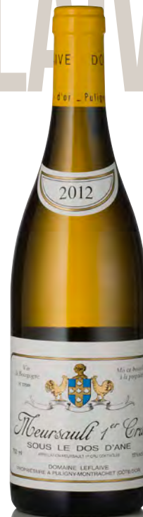
MEURSAULT 1 er Cru "Sous le Dos d'Ane"

Vitigno: Chardonnay 100% Tipo di vino: bianco fermo Vinificazione e affinamento: certificazione biodinamica - fermentazione fûts - affinamento fûts nuovi 12% per 12 mesi e 6 mesi in acciaio