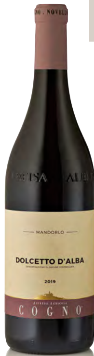
DOLCETTO D'ALBA DOC "MANDORLO"

Vitigno: Nascetta Tipo di vino: bianco Vinificazione e affinamento: fermentazione in acciaio - affinamento 6 mesi acciaio sui lieviti e 3 mesi in legno da 15 hl