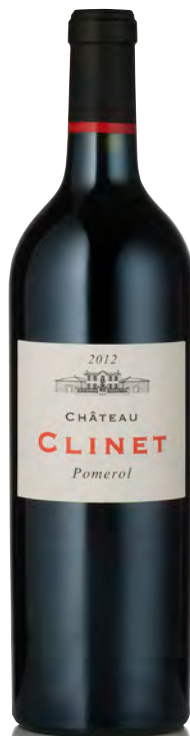
CHÂTEAU CLINET Pomerol

Vitigno: Merlot 80% - Cabernet F. 20% Tipo di vino: rosso Vinificazione e affinamento: fermentazione cuve cemento con macerazione prefermentativa a freddo - affinamento barriques nuove 70% per 18 mesi