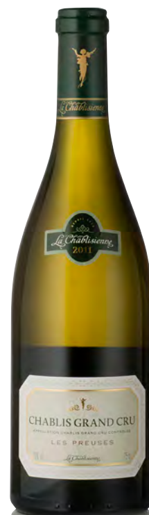
CHABLIS Grand Cru "Les Preuses"

Vitigno: Chardonnay 100% Tipo di vino: bianco fermo Vinificazione e affinamento: selezione delle migliori uve della denominazione - fermentazione e affinamento in acciaio e fûts parzialmente nuovi