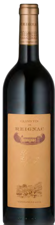
GRAND VIN DE REIGNAC Bordeaux Supérieur

Vitigno: Merlot 40% - Cabernet S. 40% - Cabernet F. 20% Tipo di vino: rosso Vinificazione e affinamento: diraspatura totale fermentazione tini legno e vasche cemento - affinamento barriques nuove 25% per 15 mesi