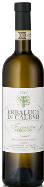
ERBALUCE DI CALUSO DOCG "LA TORRAZZA"

Vitigno: Erbaluce Tipo di vino: bianco fermo Vinificazione e affinamento: fermentazione in acciaio - vinificazione in acciaio