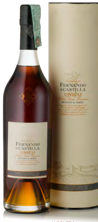
BRANDY SOLERA GRAN RESERVA "UNICO" - 30 ANNI