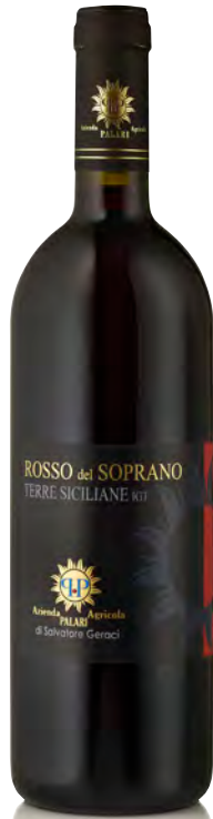
SICILIA IGT "ROSSO DEL SOPRANO"

Vitigno: Nerello Mascalese 50% - Nerello Cappuccio 30% - Nocera 10% - Galatena 10% Tipo di vino: rosso Vinificazione e affinamento: fermentazione acciaio con lieviti autoctoni - affinamento barrique 2° passaggio per 18 mesi