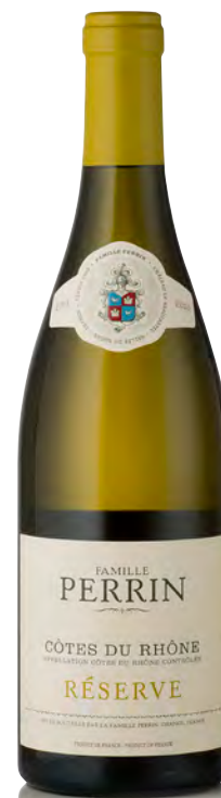
CÔTES DU RHÔNE BLANC RÉSERVE

Vitigno: Grenache Blanc 40% - Roussanne 40% - Clairette 20% Tipo di vino: bianco fermo Vinificazione e affinamento: fermentazione e affinamento in tonneau da 600 lt. con un bâtonnage alla settimana per 3 mesi