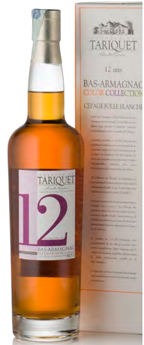
BAS-ARMAGNAC FOLLE BLANCHE 12 ANS