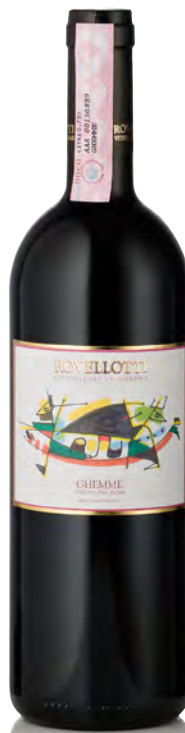
GHEMME DOCG "CHIOSO DEI POMI"

Vitigno: Vespolina Tipo di vino: rosso fermo Vinificazione e affinamento: fermentazione e affinamento in acciaio