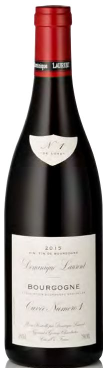
BOURGOGNE "Cuvée Numero 1"

Vitigno: Chardonnay 100% Tipo di vino: bianco fermo Vinificazione e affinamento: fermentazione e affinamento fûts nuovi 30% per 12 mesi