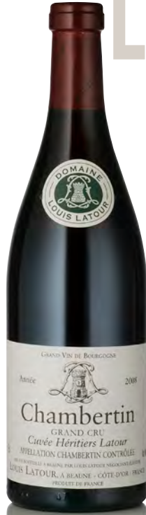
CHAMBERTIN Cuvée Héritiers Latour - Grand Cru

Vitigno: Pinot nero 100% Tipo di vino: rosso fermo Vinificazione e affinamento: fermentazione cuves legno aperte - malolattica 100% - affinamento fûts nuovi 35% per 12 mesi