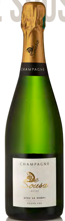
CHAMPAGNE Grand Cru Blanc de Blancs "Avec le Temps"

Vitigno: Chardonnay 50% - Pinot noir 40% - Meunier 10% Tipo di vino: metodo classico bianco Vinificazione e affinamento: fermentazione in acciaio - permanenza sui lieviti 24 mesi - vini di riserva 40%