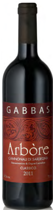
CANNONAU DI SARDEGNA DOC CLASSICO "ARBORE"

Vitigno: Cannonau Tipo di vino: rosso fermo Vinificazione e affinamento: fermentazione in acciaio - affinamento 16 mesi barrique