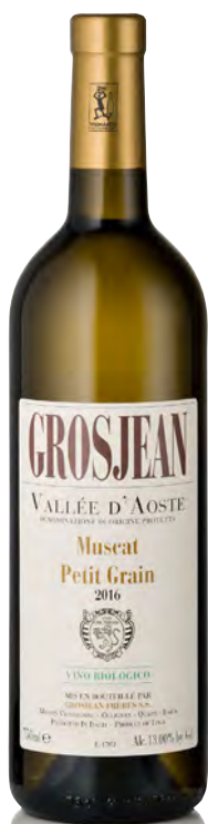
VALLE D'AOSTA DOC MUSCAT "PETIT GRAIN"

Vitigno: Chardonnay Tipo di vino: bianco fermo Vinificazione e affinamento: pied de cuve indigeno - affinamento in acciaio con battonnage