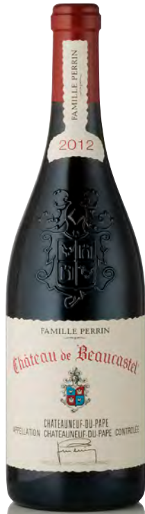
CHÂTEAUNEUF DU PAPE ROUGE

Vitigno: Grenache 30% - Mourvedre 30% - Syrah 15% - Counoise 10% - Cinsault 5% - altri vitigni 10% Tipo di vino: rosso fermo Vinificazione e affinamento: vitigni vinificati separatamente - Syrah e Mourvedre in legno, gli altri vitigni in cemento e gres