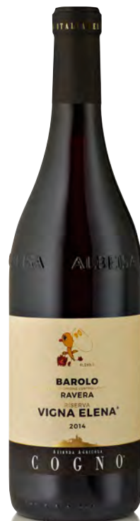
BAROLO DOCG RAVERA RISERVA "VIGNA ELENA"

Vinificazione e affinamento: fermentazione in acciaio, macerazione 30 giorni cappello sommerso - affinamento 30 mesi legno da 30 hl