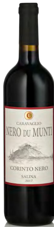
"NERO DU MUNTI" CORINTO NERO SALINA IGP

Vitigno: Malvasia Tipo di vino: bianco secco Vinificazione e affinamento: fermentazione con lieviti autoctoni - affinamento in anfora per 6 mesi