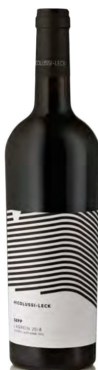
ALTO-ADIGE DOC LAGREIN "SEPP"

Vinificazione e affinamento: diraspatura - fermentazione in acciaio e legno (50 e 50) - affinamento legno grande per 70% e acciaio 30% per 6 mesi