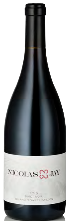
NICOLAS JAY PINOT NOIR