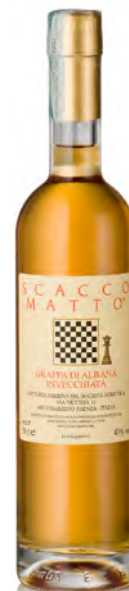
GRAPPA DI ALBANA INVECCHIATA "SCACCOMATTO"

Vitigno: Albana Tipo di vino: bianco passito Vinificazione e affinamento: uve da vendemmia tardiva bottrizzate - vinificazione e affinamento in vasche acciaio da 100 litri