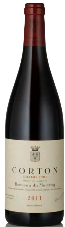
CORTON Grand Cru

Vitigno: Chardonnay 100% Tipo di vino: bianco fermo Vinificazione e affinamento: biodinamica dal 2004 - fermentazione acciaio - affinamento fûts nuovi 30% e piccole parti in uova di cemento e gres per 15 mesi