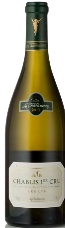
CHABLIS 1 er Cru "Les Lys"

Vitigno: Chardonnay 100% Tipo di vino: bianco fermo Vinificazione e affinamento: selezione delle migliori uve della denominazione - fermentazione e affinamento in acciaio e fûts parzialmente nuovi