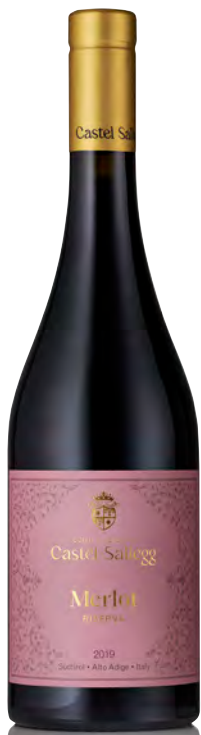
ALTO-ADIGE DOC MERLOT "RISERVA"

Vinificazione e affinamento: Diraspatura completa e macerazione uve - Fermentazione in acciaio - Affinamento acciaio e barrique per 12 mesi