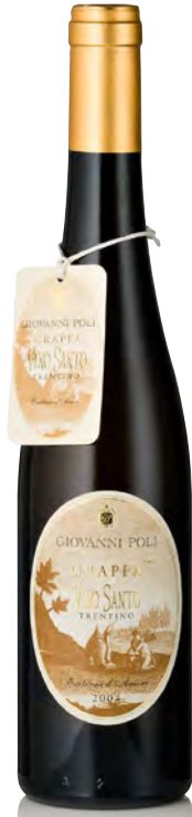
GRAPPA DI VIN SANTO