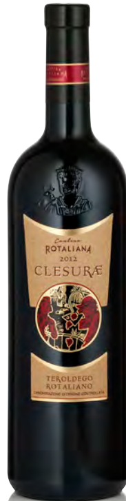
TEROLDEGO ROTALIANO DOC "CLESURAE"

Vitigno: Teroldego Tipo di vino: rosso fermo Vinificazione e affinamento: fermentazione acciaio - affinamento 24 mesi barrique