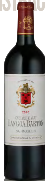
CHÂTEAU LANGOA-BARTON 3 ème Grand Cru Classé - Saint Julien

Vitigno: Cabernet S. 61% - Merlot 27% - Petit Verdot 8% - Cabernet F. 4% Tipo di vino: rosso Vinificazione e affinamento: diraspatura totale fermentazione acciaio - affinamento barriques nuove 40% per 18/20 mesi