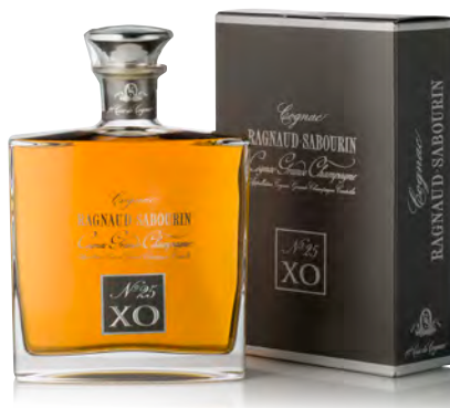
COGNAC GRANDE CHAMPAGNE XO N°25