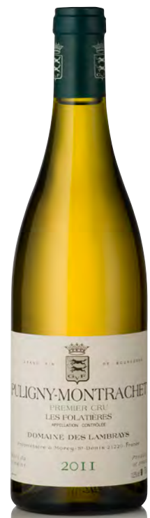
PULIGNY-MONTRACHET 1 er Cru "Les Folatières"

Vitigno: Pinot nero 100% Tipo di vino: rosso fermo Vinificazione e affinamento: vinificazione con raspi - fermentazione in acciaio - affinamento in fûts nuovi 30% per 18 mesi