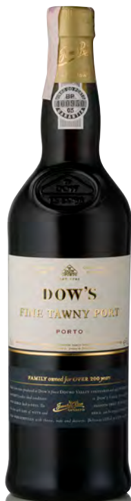
DOW'S PORTO TAWNY