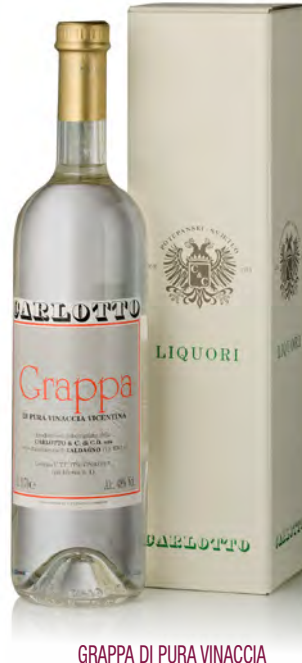
GRAPPA DI PURA VINACCIA