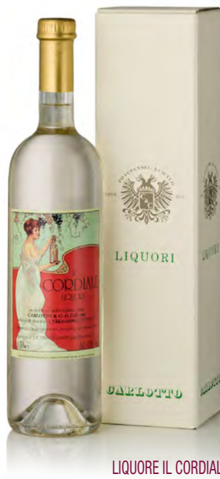
LIQUORE IL CORDIALE