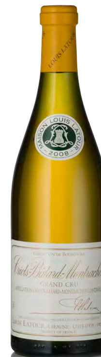
CRIOTS-BÂTARD-MONTRACHET Grand Cru

Vitigno: Chardonnay 100% Tipo di vino: bianco fermo Vinificazione e affinamento: fermentazione fûts (228 lt) - malolattica 100% - affinamento fûts nuovi 100% per 10 mesi