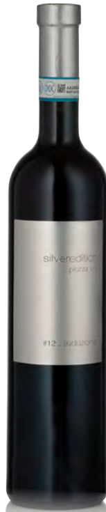
SFORZATO VALTELLINA DOCG "PASSIONE"

Vitigno: Nebbiolo Tipo di vino: rosso fermo Vinificazione e affinamento: appassimento per 3 mesi - macerazione di 10 gg sulle bucce - affinamento 8 mesi barrique e 24 mesi legno grande