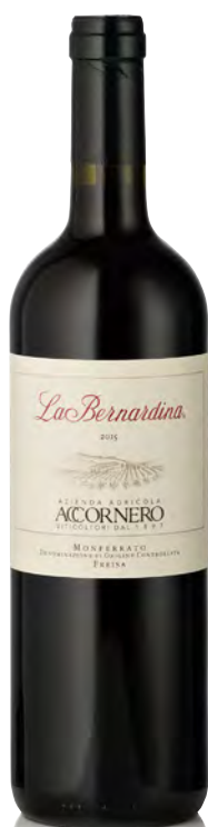
MONFERRATO DOC FREISA "LA BERNARDINA"