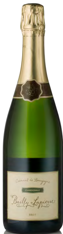
CRÉMANT DE BOURGOGNE BRUT Chardonnay

Vitigno: Chardonnay 100% Tipo di vino: metodo classico bianco Vinificazione e affinamento: fermentazione in acciaio - 18 mesi sui lieviti