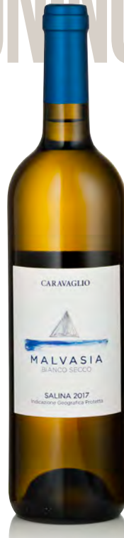
MALVASIA BIANCO SECCO SALINA IGP

Vitigno: Malvasia 95% - Corinto nero 5% Tipo di vino: bianco passito Vinificazione e affinamento: appassimento su graticci al sole 20 giorni - lieviti autoctoni - affinamento 6 mesi legno e acciaio