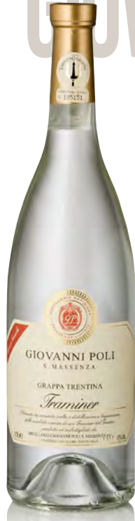
GRAPPA DI TRAMIN