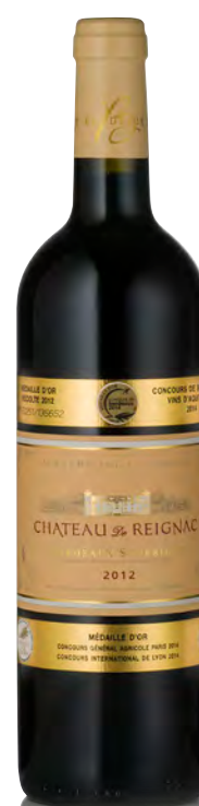
CHÂTEAU DE REIGNAC Bordeaux Supérieur

Vitigno: Merlot 67% - Cabernet S. 25% - Cabernet F. 8% Tipo di vino: rosso Vinificazione e affinamento: fermentazione acciaio - affinamento barriques nuove per 18 mesi con bâtonnage