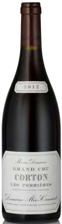
CORTON "PERRIÈRES" Grand Cru

Vitigno: Pinot nero 100% Tipo di vino: rosso fermo Vinificazione e affinamento: diraspatura parziale - fermentazione tini legno aperti - affinamento fûts nuovi 100%