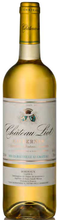
CHÂTEAU LIOT Sauternes

Vitigno: Sémillon 80% - Sauvignon 15% - Muscadelle 5% Tipo di vino: bianco passito Vinificazione e affinamento: uve bottrizzate - fermentazione barriques - affinamento 12 mesi barriques e 8 mesi acciaio