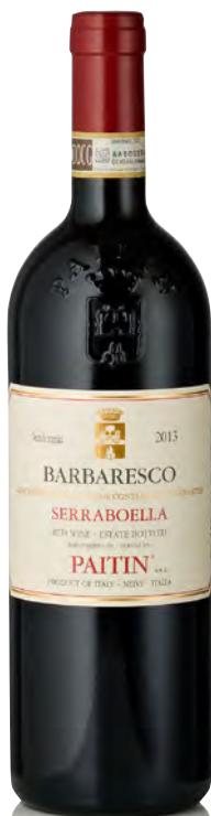
BARBARESCO DOCG "SERRABOELLA"

Vitigno: Nebbiolo Tipo di vino: rosso fermo Vinificazione e affinamento: fermentazione e macerazione in vasche verticali con cappello sommerso - affinamento 18 mesi legno grande