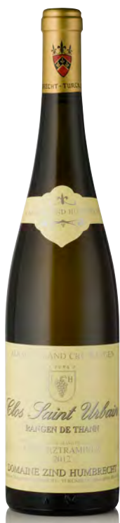
GEWÜRZTRAMINER D'ALSACE "Rangen de Thann" Clos St. Urbain - Grand Cru

Vitigno: Gewürztraminer 100% Tipo di vino: bianco fermo Vinificazione e affinamento: lunghissima fermentazione con lieviti indigeni, almeno 6 mesi sur lies - affinamento legno grande per 24 mesi