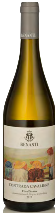
ETNA BIANCO DOC "CONTRADA CAVALIERE"

Vitigno: Carricante Tipo di vino: bianco fermo Vinificazione e affinamento: fermentazione in acciaio con lieviti autoctoni - affinamento acciaio