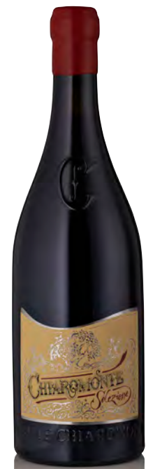
PRIMITIVO GIOIA DEL COLLE DOP "SELEZIONE"

Vitigno: Primitivo Tipo di vino: rosso Vinificazione e affinamento: Fermentazione in acciaio - Affinamento 24 mesi acciaio (30 giorni sui lieviti) - 12 mesi di bottiglia