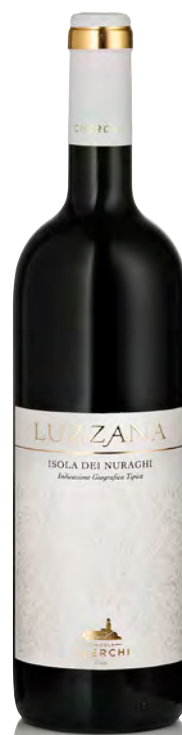
LUZZANA IGT ISOLA DEI NURAGHI

Vitigno: Cagnulari Tipo di vino: rosso fermo Vinificazione e affinamento: uve diraspate - fermentazione con bucce per 10 giorni - affinamento acciaio e legno per 6 mesi