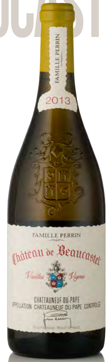
CHÂTEAUNEUF DU PAPE BLANC Vieilles Vignes Cuvée "Roussanne"

Vitigno: Roussanne 80% - Grenache blanc 15% - altri vitigni 5% Tipo di vino: bianco fermo Vinificazione e affinamento: fermentazione 30% in barriques e 70% in legno grande - affinamento 30% in barriques e 70% in legno grande per 8 mesi