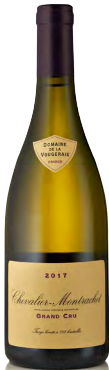
CHEVALIER-MONTRACHET GRAND CRU

Vitigno: Chardonnay Tipo di vino: bianco Vinificazione e affinamento: biodinamica dal 2006 - fermentazione e affinamento fûts nuovi 40% per 18 mesi