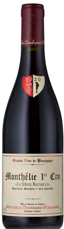
MONTHÉLIE 1ER CRU "LE MEIX BATAILLE"

Vitigno: Pinot Nero Tipo di vino: rosso Vinificazione e affinamento: Lieviti indigeni - Diraspatura parziale - Fermentazione in inox - Affinamento fûts mai nuovi