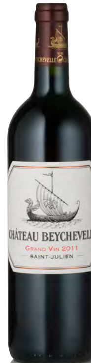
CHÂTEAU BEYCHEVELLE 4 ème Grand Cru Classé - Saint Julien

Vitigno: Cabernet S. 70% - Merlot 22% - Cabernet F. 5% - Petit Verdot 3% Tipo di vino: rosso Vinificazione e affinamento: fermentazione acciaio - macerazione di 21 giorni - affinamento barriques nuove 65% per 18 mesi