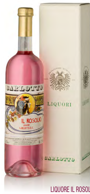
LIQUORE IL ROSOLIO