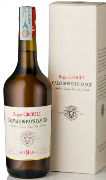
CALVADOS PAYS D'AUGE "8 ANS"