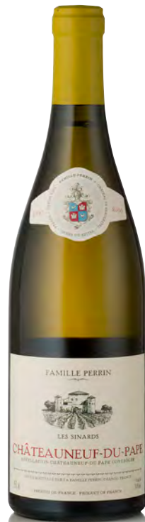
CHATEAUNEUF DU PAPE BLANC "Les Sinards"

Vitigno: Grenache 50% - Syrah 30% - Mourvedre 20% Tipo di vino: rosso fermo Vinificazione e affinamento: fermentazione in acciaio - affinamento in acciaio 75% e legno grande 25%