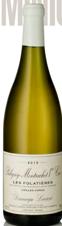
PULIGNY-MONTRACHET 1 er Cru "Les Folatières"

Vitigno: Chardonnay 100% Tipo di vino: bianco fermo Vinificazione e affinamento: fermentazione acciaio - affinamento acciaio per 8 mesi