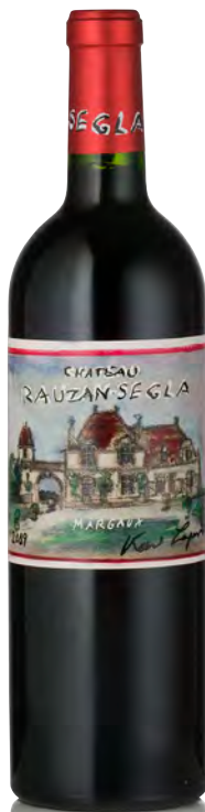
CHÂTEAU RAUZAN-SÉGLA 2 ème Grand Cru Classé - Margaux

Vitigno: Cabernet S. 50% - Merlot 40% - Cabernet F. 5% - Petit Verdot 5% Tipo di vino: rosso Vinificazione e affinamento: fermentazione cemento e legno - affinamento barriques nuove 35% per 12 mesi