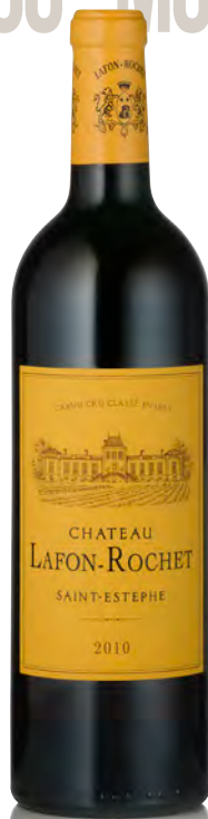
CHÂTEAU LAFON-ROCHET 4 ème Grand Cru Classé - Saint Estèphe

Vitigno: Cabernet S. 56% - Merlot 35% - Cabernet F. 7% - Petit Verdot 2% Tipo di vino: rosso Vinificazione e affinamento: fermentazione in vasche acciaio da 5 a 120 hl - affinamento barriques nuove 100% per 18 mesi