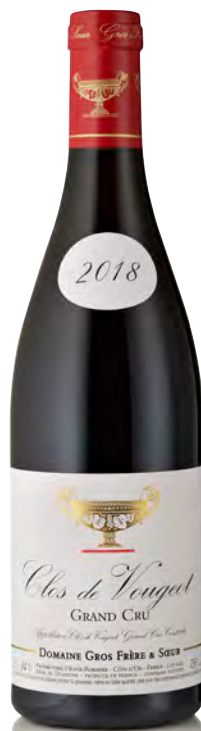
CLOS DE VOUGEOT Grand Cru

Vitigno: Pinot nero 100% Tipo di vino: rosso fermo Vinificazione e affinamento: fermentazione acciaio - affinamento fûts nuovi 100% per 15 mesi