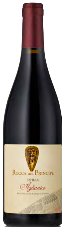
IRPINIA DOP AGLIANICO

Vitigno: Fiano Tipo di vino: bianco Vinificazione e affinamento: Fermentazione in acciaio (80%) e barrique (20) - Malolattica non svolta - Affinamento in acciaio e barrique su fecce fini per 8 mesi