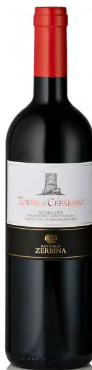
SANGIOVESE SUPERIORE DOC ROMAGNA RISERVA "TORRE DI CEPARANO"

Vitigno: Sangiovese Tipo di vino: rosso fermo Vinificazione e affinamento: fermentazione acciaio - affinamento acciaio e cemento