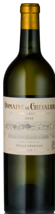
DOMAINE DE CHEVALIER BLANC Grand Cru Classé - Pessac-Léognan

Vinificazione e affinamento: fermentazione barriques - affinamento barriques nuove 50% per 12 mesi