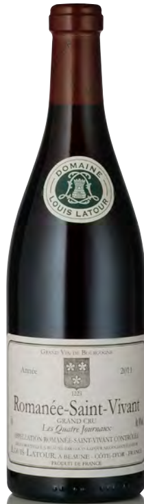
ROMANÉE-SAINT VIVANT Grand Cru "Les Quatre Journaux"

Vitigno: Pinot nero 100% Tipo di vino: rosso fermo Vinificazione e affinamento: fermentazione cuves legno aperte - malolattica 100% - affinamento fûts nuovi 100% per 12 mesi