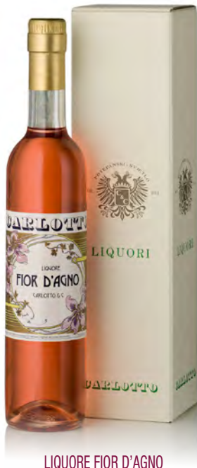
LIQORE FIOR D'AGNO