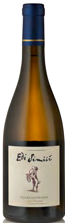
GORIŠKA BRDA SAUVIGNON "FOJANA"

Vitigno: Chardonnay Tipo di vino: bianco Vinificazione e affinamento: breve macerazione di 2 ore - fermentazione e affinamento barrique nuova 30% e 2°/3° passaggio 70% per 11 mesi