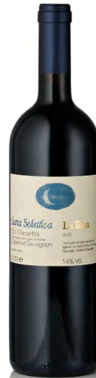
COLLI PIACENTINI DOC CABERNET SAUVIGNON "LUNA SELVATICA"

Vinificazione e affinamento: macerazione sulle bucce 15 giorni - affinamento 6 mesi barrique