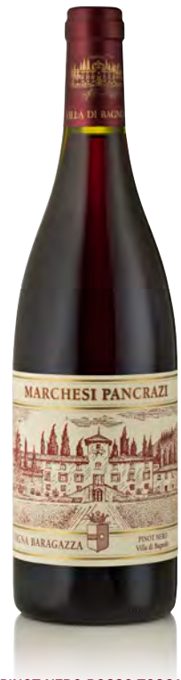
PINOT NERO ROSSO TOSCANO IGT "VIGNA BARAGAZZA"

Vinificazione e affinamento: diraspatura e fermentazione in acciaio - affinamento barrique 1° e 2° passaggio per 18 mesi