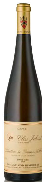
PINOT GRIS D'ALSACE "Clos Jébsal" Sélection de Grains Nobles

Vitigno: Pinot-gris 100% Tipo di vino: bianco dolce Vinificazione e affinamento: uve parzialmente bottrizzate - lunghissima fermentazione con lieviti indigeni - affinamento legno piccolo