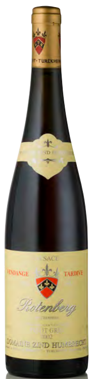
PINOT GRIS D'ALSACE "Rotenberg" - Vendange Tardive

Vitigno: Pinot-gris 100% Tipo di vino: bianco dolce Vinificazione e affinamento: uve parzialmente bottrizzate - lunghissima fermentazione con lieviti indigeni - affinamento legno piccolo