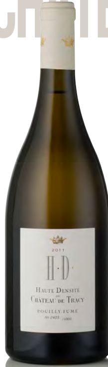
POUILLY-FUMÉ "H.D. Haute Densité"

Vitigno: Sauvignon 100% Tipo di vino: bianco fermo Vinificazione e affinamento: fermentazione ed affinamento in tonneaux da 500 lt. e acciaio per 9 mesi