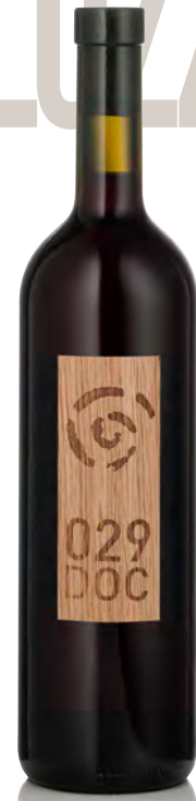
"029" ROSSO DI VALTELLINA DOC

Vitigno: Nebbiolo Tipo di vino: rosso fermo Vinificazione e affinamento: macerazione di 5 giorni sulle bucce - affinamento 36 mesi legno grande