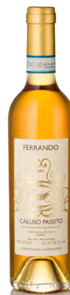
CALUSO PASSITO DOC

Vitigno: Erbaluce Tipo di vino: metodo classico bianco Vinificazione e affinamento: fermentazione acciaio - 36 mesi sui lieviti