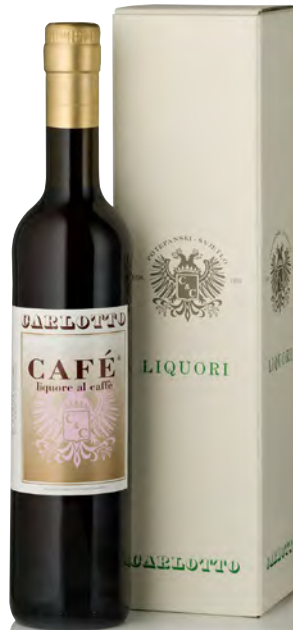
LIQUORE AL CAFFÈ