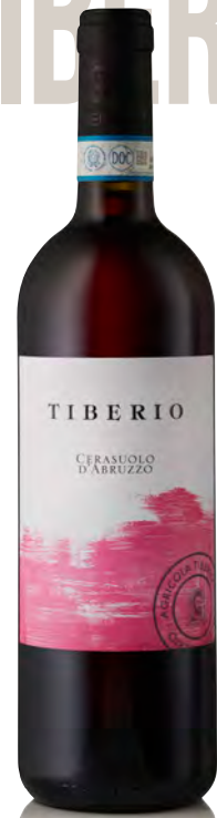
CERASUOLO D'ABRUZZO DOP

Vitigno: Pecorino Tipo di vino: bianco fermo Vinificazione e affinamento: macerazione a freddo - fermentazione e affinamento in acciaio - lieviti indigeni - no malolattica