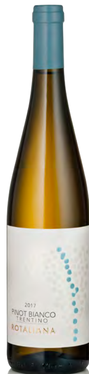
TRENTINO DOC PINOT BIANCO

Vitigno: Müller Thurgau Tipo di vino: bianco fermo Vinificazione e affinamento: fermentazione in acciaio sui lieviti - affinamento acciaio