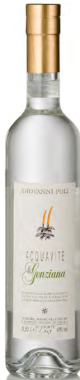
ACQUAVITE DI GENZIANA