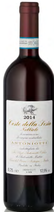
NEBBIOLO COSTA DELLA SESIA DOC

Vitigno: Nebbiolo 70% - Croatina 20% - Vespolina 10% Tipo di vino: rosso fermo Vinificazione e affinamento: uve diraspate - 12 giorni macerazione - affinamento acciaio e legno grande per 20 mesi