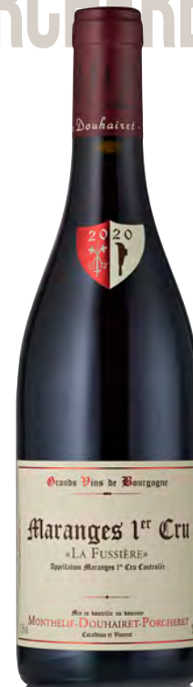
MARANGES 1ER CRU "LA FUSSIÈRE"

Vitigno: Chardonnay Tipo di vino: bianco Vinificazione e affinamento: Fermentazione con lieviti indigeni in inox - Malolattica e affinamento in fûts (30% nuovi)