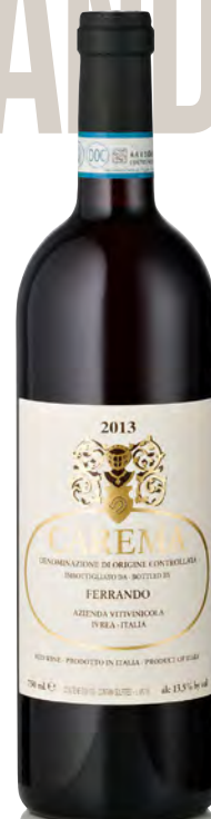
CAREMA DOC "ETICHETTA BIANCA"

Vitigno: Erbaluce Tipo di vino: bianco fermo Vinificazione e affinamento: fermentazione in acciaio - vinificazione in acciaio