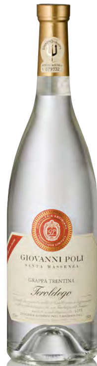
GRAPPA DI TEROLDEGO