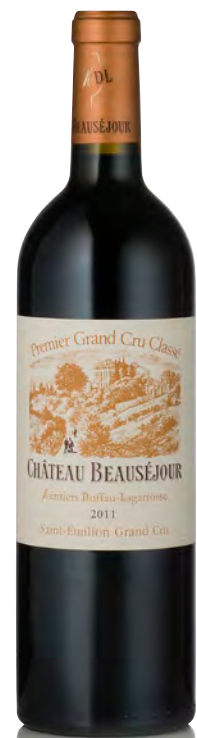
CHÂTEAU BEAUSÉJOUR DUFFAU-LAGARROSSE 1 er Grand Cru Classé - Saint Émilion

Vitigno: Merlot 80% - Cabernet F. 15% - Cabernet S. 5% Tipo di vino: rosso Vinificazione e affinamento: fermentazione in acciaio - affinamento barriques nuove 65% per 18 mesi