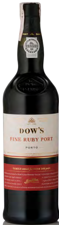
DOW'S PORTO RUBY