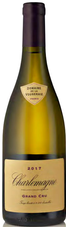
CHARLEMAGNE GRAND CRU

Vitigno: Chardonnay 100% Tipo di vino: bianco fermo Vinificazione e affinamento: biodinamica dal 2006 - fermentazione acciaio - affinamento fûts nuovi 37% per 16 mesi e acciaio 3 mesi