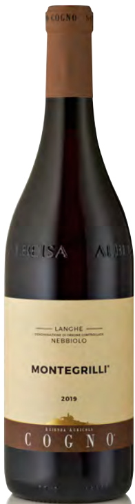
NEBBIOLO LANGHE DOC "MONTEGRILLI"

Vitigno: Barbera Tipo di vino: rosso Vinificazione e affinamento: fermentazione in acciaio con rimontaggio automatico - affinamento 12 mesi legno grande