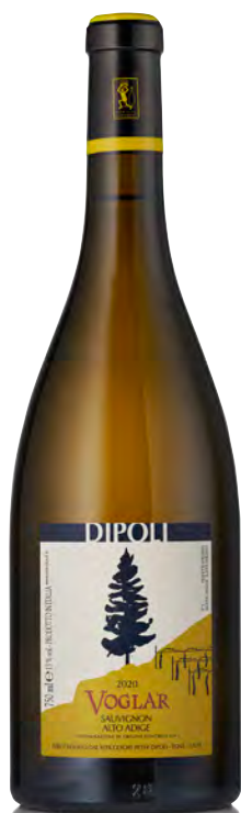
ALTO-ADIGE DOC SAUVIGNON BLANC "VOGLAR"