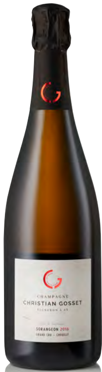
CHAMPAGNE GRAND CRU BLANC DE CHARDONNAY "Sorangeon"

Vitigno: Chardonany Tipo di vino: metodo classico bianco Vinificazione e affinamento: fermentazione in cuve smaltata - vinificazione in barrique - 48 mesi sui lieviti