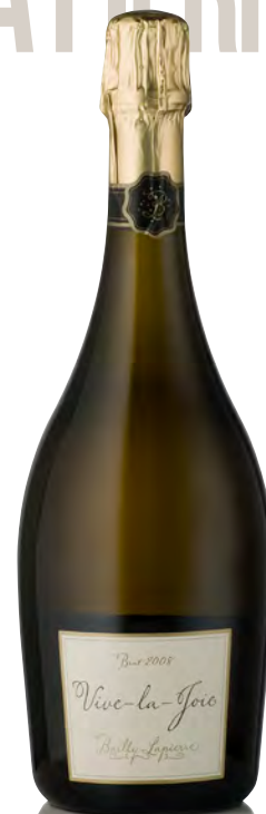
CRÉMANT DE BOURGOGNE BRUT BLANC Vive-la-Joie!

Vitigno: Pinot nero 100% Tipo di vino: metodo classico bianco Vinificazione e affinamento: fermentazione in acciaio - 18 mesi sui lieviti