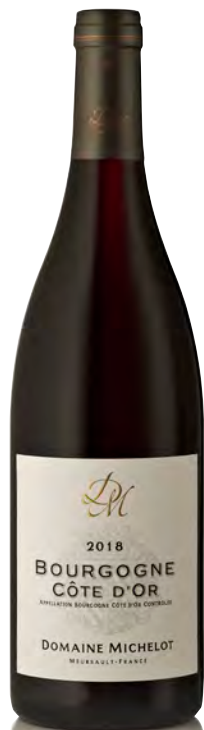
BOURGOGNE ROUGE CÔTE D'OR

Vitigno: Chardonnay 100% Tipo di vino: bianco fermo Vinificazione e affinamento: fermentazione in tonneaux - affinamento di 16 mesi 70% in fûts ed il restante 30% in tonneaux e uova di gres