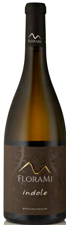
FALANGHINA CAMPANIA IGP "INDOLE"

Vitigno: Falanghina a piede franco Tipo di vino: bianco Vinificazione e affinamento: fermentazione acciaio con lieviti indigeni - macerazione 15 giorni - affinamento 8 mesi sui lieviti in acciaio