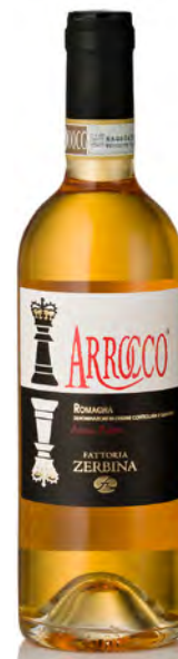
ALBANA DOCG PASSITO ROMAGNA "ARROCCO"

Vitigno: Sangiovese - Syrah Tipo di vino: rosato fermo Vinificazione e affinamento: vitigni vinificati separatamente in acciaio - affinamento acciaio