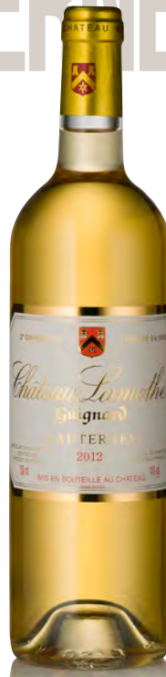
CHÂTEAU LAMOTHE-GUIGNARD 2 ème Grand Cru Classé - Sauternes

Vitigno: Sémillon 86% - Sauvignon 14% Tipo di vino: bianco passito Vinificazione e affinamento: uve bottrizzate - fermentazione barriques - affinamento 18 mesi barriques