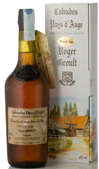
CALVADOS PAYS D'AUGE "DOYEN D'AGE"