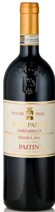
BARBARESCO RISERVA VECCHIE VIGNE DOCG "SORI PAITIN"