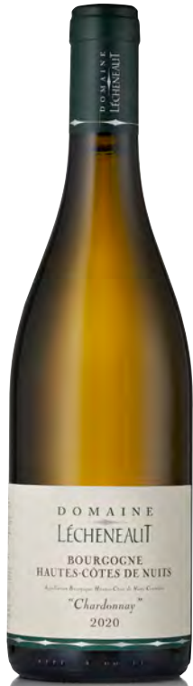
BOURGOGNE HAUTES CÔTES DE NUITS

Vitigno: Chardonnay 100% Tipo di vino: metodo classico bianco Vinificazione e affinamento: Fermentazione in acciaio - Breve bâtonnage - Affinamento acciaio e fûts mai nuovi