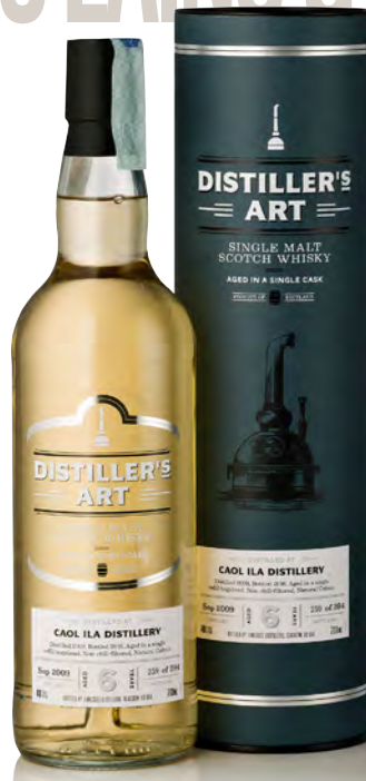
DISTILLER'S ART CAOL ILA DISTILLERY