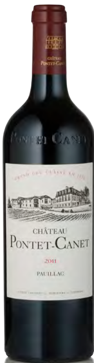
CHÂTEAU PONTET-CANET 5 ème Grand Cru Classé - Pauillac

Vitigno: Cabernet S. 61% - Merlot 32% - Cabernet F. 4% - Petit Verdot 3% Tipo di vino: rosso Vinificazione e affinamento: fermentazione acciaio - affinamento barriques nuove 50% per 18 mesi