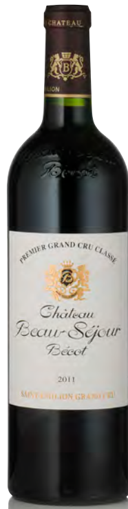
CHÂTEAU BEAU-SÉJOUR BÉCOT 1 er Grand Cru Classé - Saint Émilion

Vitigno: Merlot 53% - Cabernet F. 46% - Petit Verdot 1% Tipo di vino: rosso Vinificazione e affinamento: fermentazione in acciaio, legno e cemento - affinamento barrique nuove 100% e legno grande per 20 mesi