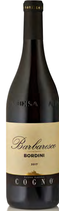
BARBARESCO DOCG "BORDINI"

Vitigno: Barbera Vitis Vinifera Tipo di vino: rosso Vinificazione e affinamento: fermentazione in acciaio con rimontaggio automatico - affinamento 12 mesi legno grande