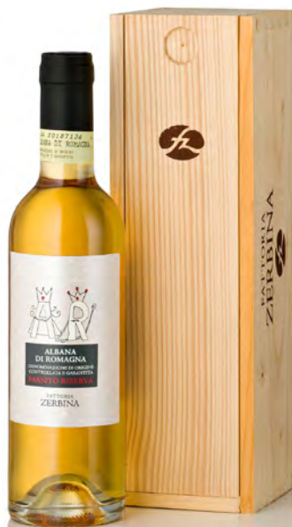
ALBANA DOCG PASSITO ROMAGNA "AR"

Vitigno: Albana Tipo di vino: bianco passito Vinificazione e affinamento: uve da vendemmia tardiva bottrizzate - vinificazione acciaio e barrique