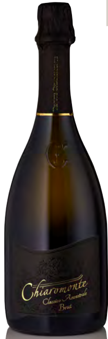
METODO CLASSICO BRUT PUGLIA IGP "ANCESTRALE"

Vitigno: Chardonnay 90%-Fiano Minutolo 10% Tipo di vino: metodo classico bianco Vinificazione e affinamento: fermentazione acciaio bloccata come previsto dal metodo ancestrale - 24 mesi sui lieviti