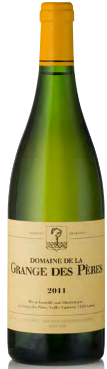
DOMAINE DE LA GRANGE DES PÈRES - BLANC

Vitigno: Syrah 40% - Mourvèdre 40% - Cabernet S. 20% Tipo di vino: rosso fermo Vinificazione e affinamento: lieviti indigeni - fermentazione in acciaio - affinamento in barriques nuove 35% per 16 mesi