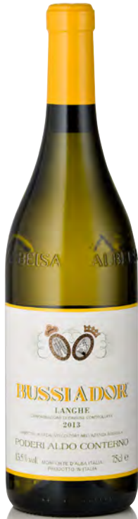
CHARDONNAY LANGHE DOC "BUSSIADOR"

Vitigno: Chardonnay Tipo di vino: bianco fermo Vinificazione e affinamento: fermentazione in barrique - affinamento in barrique usate per 24 mesi