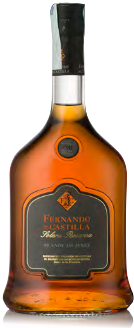
BRANDY SOLERA RESERVA