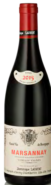
MARSANNAY Vieilles Vignes

Vitigno: Pinot nero 100% Tipo di vino: rosso fermo Vinificazione e affinamento: fermentazione acciaio - affinamento fûts in piccola parte nuovi per 8 mesi