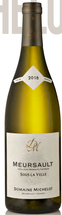
MEURSAULT BLANC "Sous la Velle"

Vinificazione e affinamento: fermentazione in tonneaux - affinamento di 16 mesi 70% in fûts ed il restante 30% in tonneaux e uova di gres