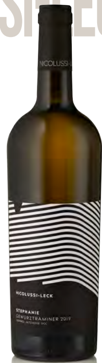
ALTO-ADIGE DOC GEWÜRZTRAMINER "STEPHANIE"

Vinificazione e affinamento: fermentazione e affinamento per 6 mesi in acciaio 65%, legno grande 25%, tonneau 10%