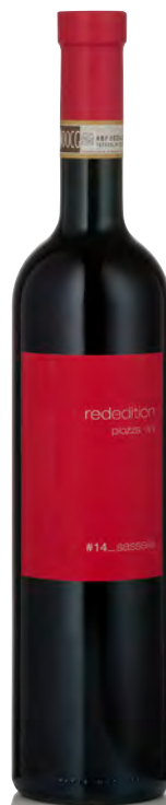
VALTELLINA SUPERIORE DOCG SASSELLA RISERVA

Vitigno: Nebbiolo Tipo di vino: rosso fermo Vinificazione e affinamento: macerazione di 5 giorni sulle bucce - affinamento 6 mesi barrique e 30 mesi legno grande