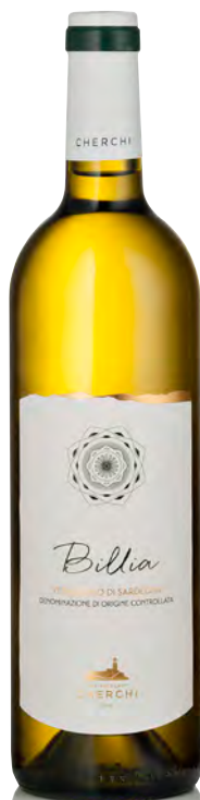
VERMENTINO DI SARDEGNA DOC "BILLIA"

Vitigno: Vermentino Tipo di vino: bianco fermo Vinificazione e affinamento: Fermentazione in acciaio con lieviti autoctoni - Breve affinamento in acciaio