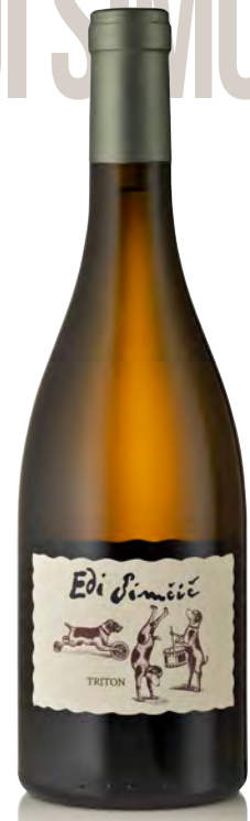
GORIŠKA BRDA "TRITON"

Vitigno: Friulano 30%-Chardonnay 25%-Pinot grigio 25%-Sauvignon 20% Tipo di vino: bianco Vinificazione e affinamento: fermentazione e affinamento barrique nuova 20% e 2 2 / 3 °/4° passaggio 80% per 11 mesi-nessuna macerazione