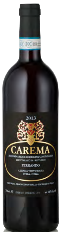
CAREMA DOC "ETICHETTA NERA"

Vitigno: Nebbiolo Tipo di vino: rosso fermo Vinificazione e affinamento: macerazione per 10 giorni e fermentazione in acciaio - affinamento 30 mesi legno grande