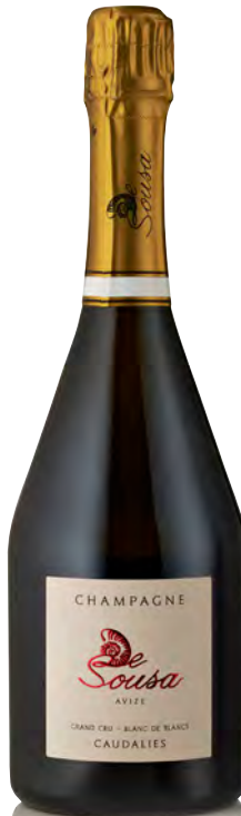
CHAMPAGNE EXTRA BRUT Grand Cru Blanc de Blancs "Cuvée des Caudalies"

Vitigno: Chardonnay 92% - Pinot noir 8% Tipo di vino: metodo classico rosato Vinificazione e affinamento: fermentazione in acciaio - permanenza sui lieviti 30 mesi - vini di riserva 20%