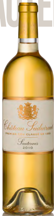
CHÂTEAU SUDUIRAUT 1 er Grand Cru Classé - Sauternes