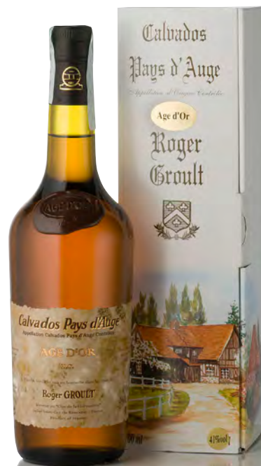
CALVADOS PAYS D'AUGE "AGE D'OR"