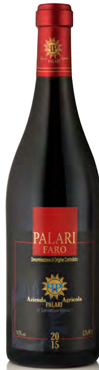
FARO DOC "PALARI"

Vitigno: Nerello Mascalese 50% - Nerello Cappuccio 30% - Nocera 10% - Galatena 10% Tipo di vino: rosso Vinificazione e affinamento: fermentazione acciaio con lieviti autoctoni - affinamento barrique 2° passaggio per 18 mesi