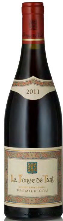
MOREY ST. DENIS 1 er Cru "La Forge de Tart"

Vitigno: Pinot nero 100% Tipo di vino: rosso fermo Vinificazione e affinamento: fermentazione acciaio - affinamento fût nuovi 100% per 17 mesi