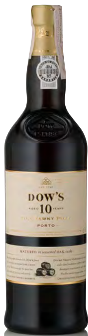
DOW'S PORTO TAWNY - 10 ANNI