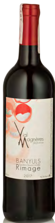
BANYULS Cuvée "Rimage"

Vitigno: Grenache Noir 70% - Grenache gris 30% Tipo di vino: rosso dolce Vinificazione e affinamento: fermentazione in cemento - mutizzazione con Marc - affinamento ossidativo in botti legno da 40 e 60 ettolitri