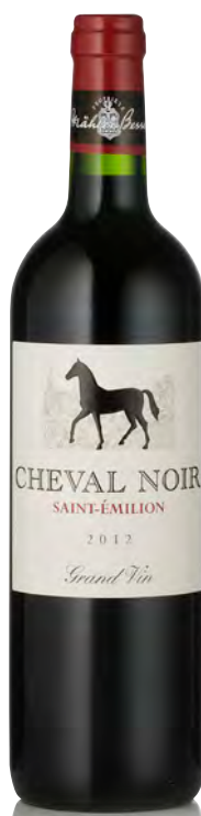
CHÂTEAU CHEVAL NOIR

Vitigno: Merlot 60% - Cabernet F. 30% - Cabernet S. 10% Tipo di vino: rosso Vinificazione e affinamento: fermentazione acciaio - affinamento barriques nuove 60% per 24 mesi