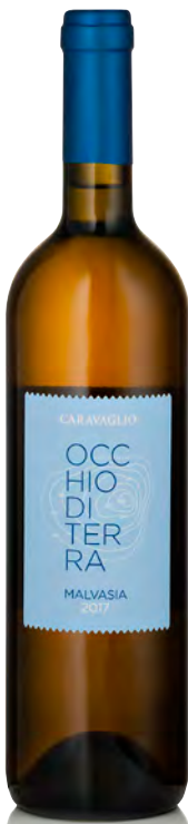
"OCCHIO DI TERRA" MALVASIA BIANCO SECCO SALINA IGP 201

Vitigno: Malvasia Tipo di vino: bianco secco Vinificazione e affinamento: fermentazione in acciaio con lieviti autoctoni - breve affinamento in acciaio