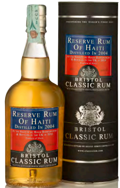
RESERVE RUM OF HAITI 2004