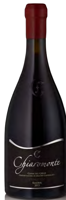
PRIMITIVO GIOIA DEL COLLE DOP "RISERVA"

Vitigno: Primitivo Tipo di vino: rosso Vinificazione e affinamento: fermentazione in acciaio - affinamento 24 mesi acciaio (30 giorni sui lieviti) - 12 mesi di bottiglia