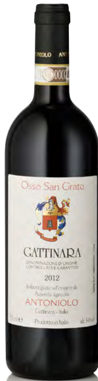
GATTINARA DOCG "VIGNETO OSSO SAN GRATO"

Vitigno: Nebbiolo Tipo di vino: rosso fermo Vinificazione e affinamento: fermentazione in cemento con lieviti indigeni - macerazione sulle bucce 20 gg. - affinamento legno grande 36 mesi