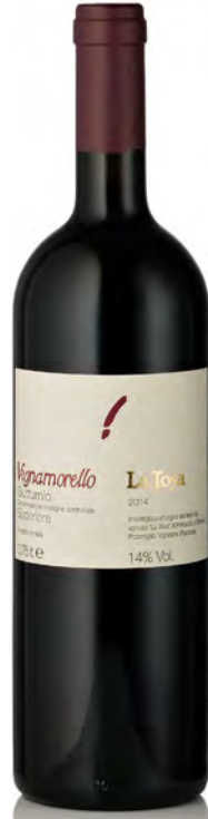
COLLI PIACENTINI DOC GUTTURNIO SUPERIORE "VIGNAMORELLO"

Vinificazione e affinamento: macerazione di 6 giorni sulle bucce - 6 mesi di affinamento sui lieviti - nessuna aggiunta di solfiti