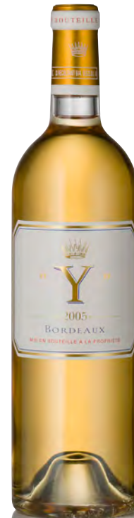
"Y" DE CHÂTEAU D'YQUEM Bordeaux Blanc

Vinificazione e affinamento: fermentazione barriques - bâtonnage - affinamento barriques nuove 30% per 9 mesi