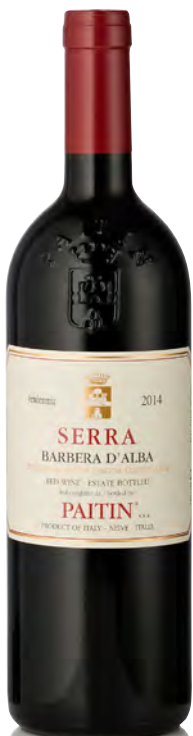
BARBERA D'ALBA DOC "SERRA"

Vitigno: Barbera Tipo di vino: rosso fermo Vinificazione e affinamento: fermentazione e macerazione in vasche verticali - affinamento 12 mesi legno grande