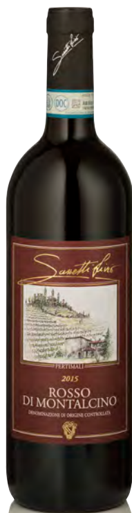
ROSSO DI MONTALCINO DOC

Vitigno: Sangiovese grosso Tipo di vino: rosso fermo Vinificazione e affinamento: fermentazione acciaio - macerazione 15 giorni - affinamento 36 mesi legno grande e 6 anni bottiglia