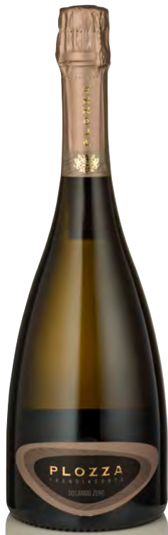
FRANCIACORTA DOCG MILLESIMATO DOSAGGIO ZERO

Vitigno: Pinot nero 100% Tipo di vino: metodo classico rosato Vinificazione e affinamento: fermentazione e permanenza in acciaio per 9 mesi - presa di spuma e permanenza sui lieviti per 36 mesi