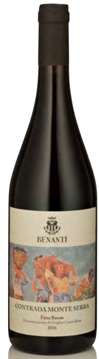
ETNA ROSSO DOC "CONTRADA MONTE SERRA"

Vitigno: Nerello mascalese 80% - Nerello cappuccio 20% Tipo di vino: rosso fermo Vinificazione e affinamento: fermentazione in acciaio con lieviti autoctoni - lunga macerazione - affinamento acciaio 80% e barrique usate 20%