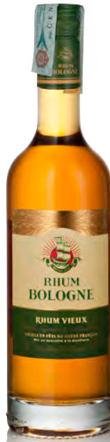
RHUM VIEUX AGRICOLE DE LA GUADELOUPE "VS"