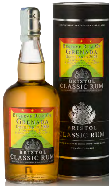
RESERVE RUM OF GRENADA