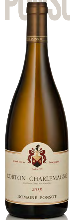
CORTON CHARLEMAGNE Grand Cru

Vitigno: Aligoté 100% Tipo di vino: bianco fermo Vinificazione e affinamento: pressa pneumatica - fermentazione e affinamento in fûts mai nuovi, anche di 7° e 8° passaggio