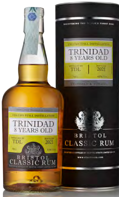
TRINIDAD & TOBAGO 8 YEARS OLD