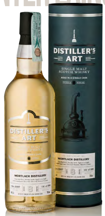
DISTILLER'S ART MORTLACH DISTILLERY