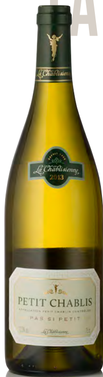
PETIT CHABLIS "Pas si Petit"

Vitigno: Chardonnay 100% Tipo di vino: bianco fermo Vinificazione e affinamento: selezione delle migliori uve della denominazione - fermentazione e affinamento in acciaio e in minima parte legno grande