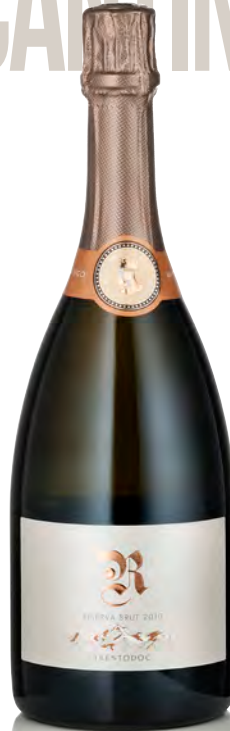
TRENTO DOC R RISERVA

Vitigno: Chardonnay Tipo di vino: metodo classico bianco Vinificazione e affinamento: fermentazione acciaio - almeno 20 mesi sui lieviti