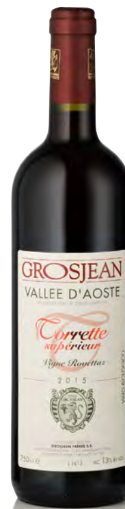
VALLE D'AOSTA DOC TORRETTE SUPERIORE "VIGNE ROVETTAZ"

Vitigno: Petit Rouge - Vien De Nus - Fumin Tipo di vino: rosso fermo Vinificazione e affinamento: uve diraspate - macerazione con le bucce - rimontaggi - affinamento acciaio