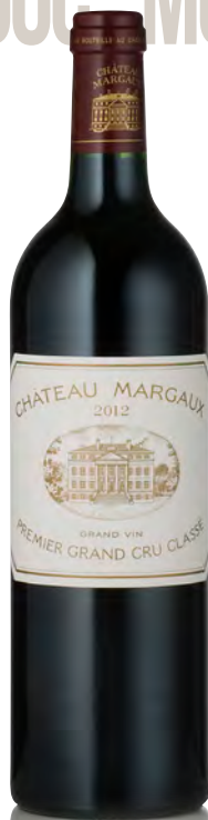
CHÂTEAU MARGAUX 1 er Grand Cru Classé - Margaux

Vitigno: Merlot 54% - Cabernet S. 42% - Cabernet F. 4% Tipo di vino: rosso Vinificazione e affinamento: lieviti indigeni - fermentazione in acciaio e cemento - affinamento barriques nuove 50% per 18 mesi