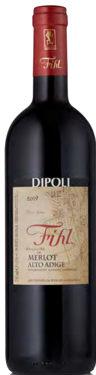
ALTO-ADIGE DOC MERLOT "FIHL"

Bâtonnage senza malolattica - Permanenza sulle fecce fine per 8 mesi