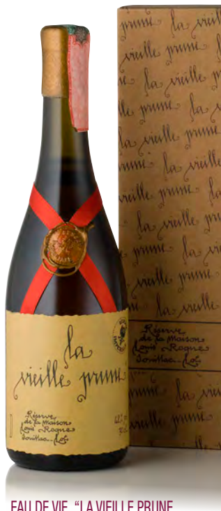
EAU DE VIE "LA VIEILLE PRUNE RÉSERVE IMPÉRIALE"