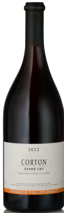
CORTON Grand Cru

Vitigno: Pinot nero 100% Tipo di vino: rosso fermo Vinificazione e affinamento: diraspatura totale - fermentazione acciaio e cemento - affinamento fûts nuovi 50% per 12 mesi