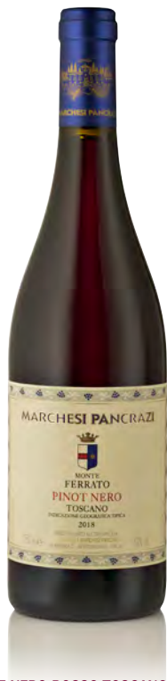
PINOT NERO ROSSO TOSCANO IGT "MONTEFERRATO"