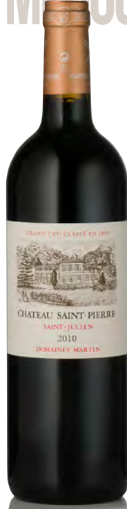
CHÂTEAU SAINT-PIERRE 4 ème Grand Cru Classé - Saint Julien

Vitigno: Cabernet S. 66% - Merlot 30% - Petit Verdot 4% Tipo di vino: rosso Vinificazione e affinamento: fermentazione acciaio e tini legno - affinamento barriques nuove 50% per 18 mesi