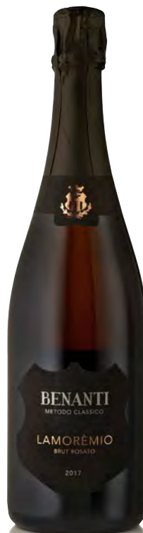
TERRE SICILIANE IGT "LAMOREMIO"

Vitigno: Carricante Tipo di vino: metodo classico bianco Vinificazione e affinamento: fermentazione acciaio - almeno 24 mesi sui lieviti