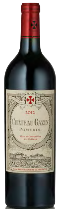
CHÂTEAU GAZIN Pomerol

Vitigno: Merlot 70% - Cabernet F. 30% Tipo di vino: rosso Vinificazione e affinamento: fermentazione tini legno da 62 hl - affinamento barriques nuove 100% per 18 mesi