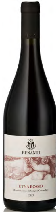
ETNA ROSSO DOC "BENANTI"

Vitigno: Carricante Tipo di vino: bianco fermo Vinificazione e affinamento: fermentazione in acciaio con lieviti autoctoni - affinamento acciaio 24 mesi con bâtonnages