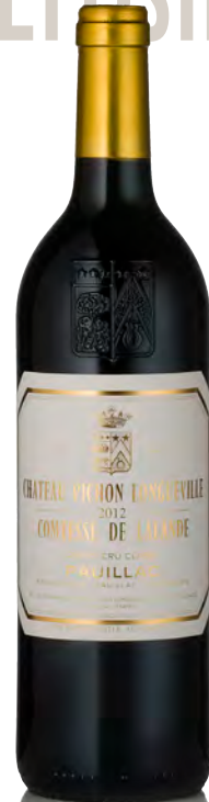
CHÂTEAU PICHON LONGUEVILLE COMTESSE LANDE 2 ème Grand Cru Classé - Pauillac

Vitigno: Cabernet S. 81% - Merlot 15% - Cabernet F. 3% - Petit Verdot 1% Tipo di vino: rosso Vinificazione e affinamento: fermentazione in tini legno per 2/3 e acciaio 1/3 - affinamento barriques nuove 100% per 20 mesi