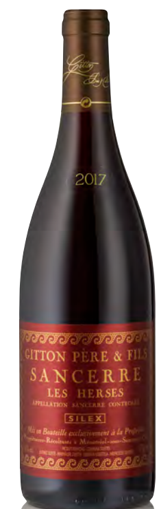
SANCERRE ROUGE "Les Herces"

Vitigno: Sauvignon 100% Tipo di vino: bianco fermo Vinificazione e affinamento: fermentazione con lieviti indigeni - affinamento 6 mesi acciaio