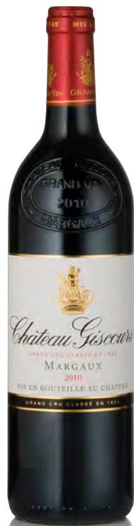
CHÂTEAU GISCOURS 3 ème Grand Cru Classé - Margaux

Vitigno: Cabernet S. 69% - Merlot 19% - Petit Verdot 9% - Cabernet F. 3% Tipo di vino: rosso Vinificazione e affinamento: fermentazione tini legno e minima parte acciaio - affinamento barriques 2° passaggio per 20 mesi