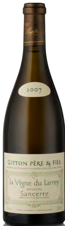
SANCERRE "La Vigne du Larrey"

Vitigno: Sauvignon 100% Tipo di vino: bianco fermo Vinificazione e affinamento: fermentazione con lieviti indigeni - affinamento 10 mesi in legno da 30 hl