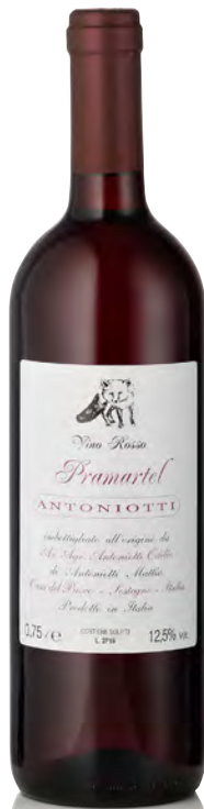
VINO ROSSO "PRAMARTEL"

Vitigno: Nebbiolo 70% - Croatina 20% - Vespolina 10% Tipo di vino: rosso fermo Vinificazione e affinamento: uve diraspate - 12 giorni macerazione - affinamento acciaio e legno grande per 20 mesi