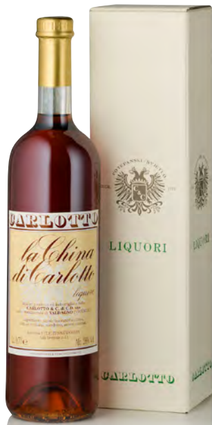
LIQUORE LA CHINA DI CARLOTTO