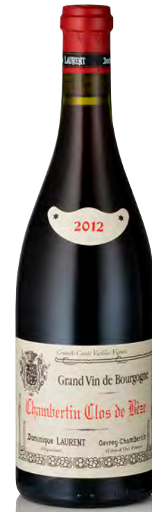
CHAMBERTIN "CLOS DE BÈZE" Grand Cru Vieilles Vignes

Vitigno: Pinot nero 100% Tipo di vino: rosso fermo Vinificazione e affinamento: fermentazione acciaio - affinamento fûts nuovi 100% per 15 mesi