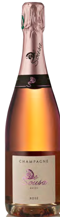
CHAMPAGNE BRUT "Rosé"

Vitigno: Chardonnay 100% Tipo di vino: metodo classico bianco Vinificazione e affinamento: fermentazione in acciaio - permanenza sui lieviti 36 mesi - 30% vini di riserva