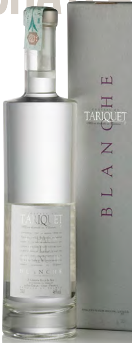
EAU DE VIE DE VIN DE FOLLE BLANCHE