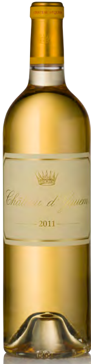
CHÂTEAU D'YQUEM 1 er Grand Cru Classé Supérieur - Sauternes

Vitigno: Sémillon 75% - Sauvignon 25% Tipo di vino: bianco passito Vinificazione e affinamento: uve botritizzate - fino a 10 raccolte nel corso della vendemmia - fermentazione in barriques - affinamento barriques nuove 100% per 20 mesi