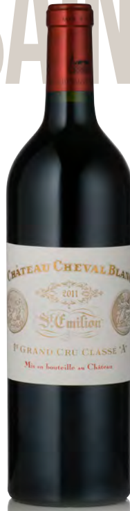
CHÂTEAU CHEVAL BLANC 1 er Grand Cru Classé "A" - Saint Émilion

Vitigno: Cabernet F. 55% - Merlot 43% Tipo di vino: rosso Vinificazione e affinamento: diraspatura totale - fermentazione in tini legno - affinamento barriques nuove 100% per 20 mesi