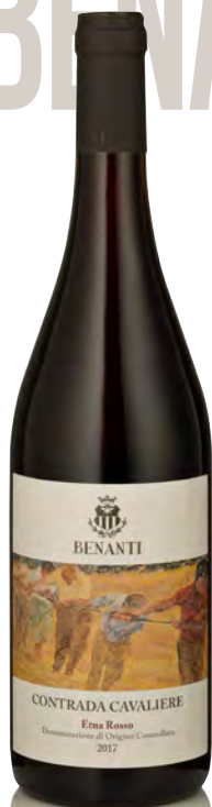
ETNA ROSSO DOC "CONTRADA CAVALIERE"

Vitigno: Nerello mascalese Tipo di vino: rosso fermo Vinificazione e affinamento: fermentazione in acciaio con lieviti autoctoni - macerazione 21 gg. - affinamento tonneaux 12 mesi