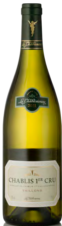
CHABLIS 1 er Cru "Vaillons"

Vitigno: Chardonnay 100% Tipo di vino: bianco fermo Vinificazione e affinamento: selezione delle migliori uve della denominazione - fermentazione e affinamento in acciaio e in minima parte legno grande