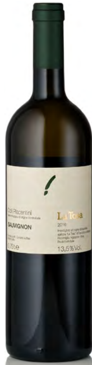
COLLI PIACENTINI DOC SAUVIGNON

Vinificazione e affinamento: fermentazione a 18° - presa di spuma in autoclave