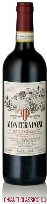
CHIANTI CLASSICO DOCG

Vitigno: Sangiovese 95% - Cannaiolo 5% Tipo di vino: rosso fermo Vinificazione e affinamento: macerazione sulle bucce 25 giorni - fermentazione cemento - affinamento legno grande 16 mesi