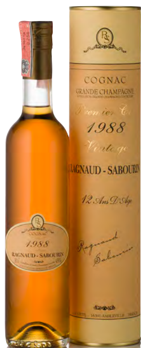
COGNAC GRANDE CHAMPAGNE MILLÉSIMÉ 1988