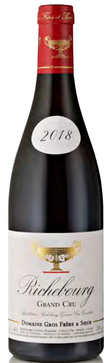
RICHEBOURG Grand Cru

Vitigno: Pinot nero 100% Tipo di vino: rosso fermo Vinificazione e affinamento: fermentazione acciaio - affinamento fûts nuovi 100% per 15 mesi