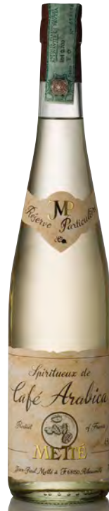
SPIRITEUX DE CAFÉ ARABICA