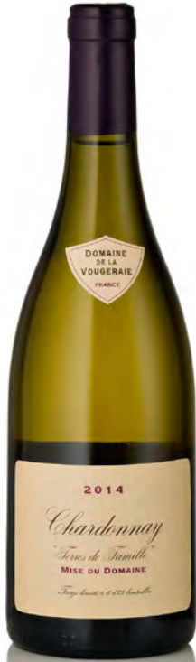
BOURGOGNE CHARDONNAY "Terres de Famille"

Vitigno: Chardonnay 100% Tipo di vino: bianco fermo Vinificazione e affinamento: biodinamica dal 2006 - fermentazione e affinamento fûts nuovi 30% per 12 mesi e acciaio 4 mesi