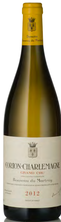
CORTON-CHARLEMAGNE Grand Cru

Vitigno: Chardonnay 100% Tipo di vino: bianco fermo Vinificazione e affinamento: biodinamica dal 2004 - fermentazione acciaio - affinamento fûts nuovi 30% e piccole parti in uova di cemento e gres per 15 mesi