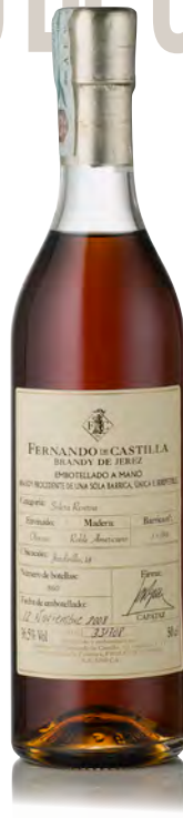
BRANDY SOLERA RESERVA OLOROSO