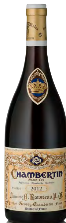
CHAMBERTIN Grand Cru

Vitigno: Pinot nero 100% Tipo di vino: rosso fermo Vinificazione e affinamento: uve interamente diraspate - fermentazione in tini legno e acciaio aperti - affinamento fûts nuovi 100% per 18 mesi