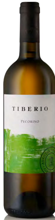
PECORINO COLLINE PESCARESI IGP

Vitigno: Trebbiano abruzzese Tipo di vino: bianco fermo Vinificazione e affinamento: macerazione a freddo - fermentazione e affinamento in acciaio - lieviti indigeni - no malolattica