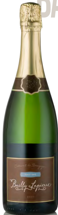
CRÉMANT DE BOURGOGNE BRUT Pinot Noir

Vitigno: Chardonnay 100% Tipo di vino: metodo classico bianco Vinificazione e affinamento: fermentazione in acciaio - 18 mesi sui lieviti