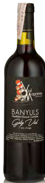
BANYULS Cuvée "Gaby Vial"

Vitigno: Grenache noir 100% Tipo di vino: rosso dolce Vinificazione e affinamento: fermentazione in acciaio - mutizzazione con Marc - affinamento in acciaio e imbottigliamento precoce