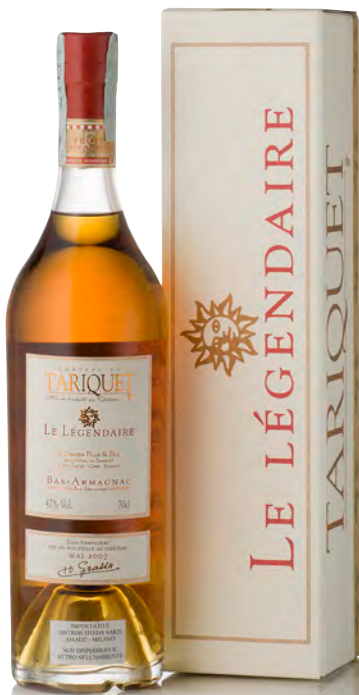
BAS-ARMAGNAC "LE LÉGENDAIRE"