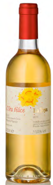
COLLI PIACENTINI DOC MALVASIA PASSITO "L'ORA FELICE"

Vinificazione e affinamento: macerazione 15 giorni sulle bucce - affinamento 2 anni barrique nuove