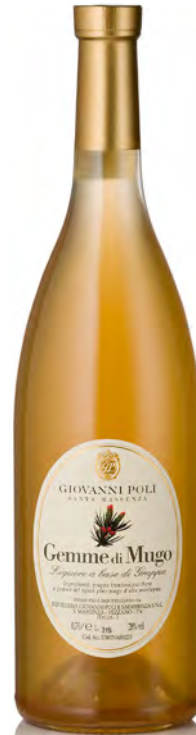
LIQUORE DI GEMME DI MUGO