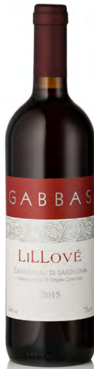
CANNONAU DI SARDEGNA DOC "LILLOVÉ"

Vitigno: Vermentino Tipo di vino: bianco fermo Vinificazione e affinamento: fermentazione in acciaio e permanenza sur lie - affinamento in acciaio per 7 mesi