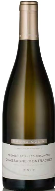
CHASSAGNE-MONTRACHET 1 er Cru "Les Chaumées"

Vitigno: Chardonnay 100% Tipo di vino: bianco fermo Vinificazione e affinamento: fermentazione e affinamento in fûts nuovi 15% e botti legno da 350 litri per 10 mesi