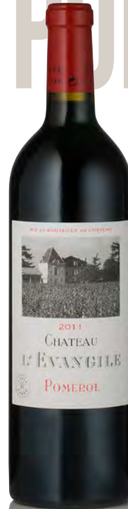
CHÂTEAU L'ÉVANGILE Pomerol

Vitigno: Merlot 80% - Cabernet F. 20% Tipo di vino: rosso Vinificazione e affinamento: fermentazione vasche cemento - affinamento barriques nuove 60% per 18 mesi