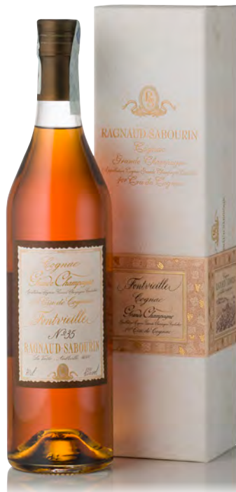
COGNAC GRANDE CHAMPAGNE FONTVIEILLE N°35