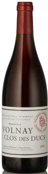
VOLNAY 1 er Cru "Clos des Ducs"

Vitigno: Pinot nero 100% Tipo di vino: rosso fermo Vinificazione e affinamento: biodinamica dal 2006 - fermentazione in cuves legno aperte - affinamento fûts nuovi 20% per 18 mesi