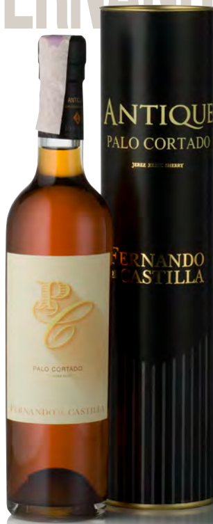
ANTIQUE SHERRY PALO CORTADO

Vitigno: Pedro Ximenez 100% Tipo di vino: rosso dolce Vinificazione e affinamento: uve passite - nel corso della fermentazione aggiunta di alcol a raggiungere i 15° - invecchiamento medio 30 anni solera