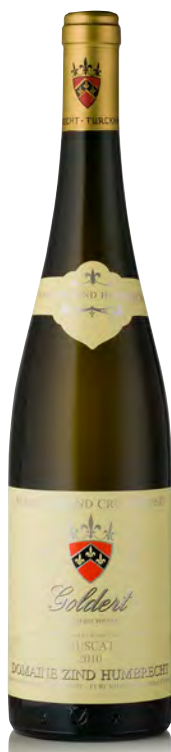
MUSCAT D'ALSACE "Goldert" - Grand Cru

Vitigno: Gewürztraminer 100% Tipo di vino: bianco fermo Vinificazione e affinamento: lunghissima fermentazione con lieviti indigeni, almeno 6 mesi sur lies - affinamento legno grande per 24 mesi