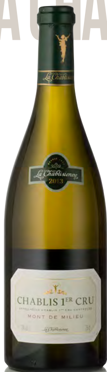
CHABLIS 1 er Cru "Mont de Milieu"

Vitigno: Chardonnay 100% Tipo di vino: bianco fermo Vinificazione e affinamento: selezione delle migliori uve della denominazione - fermentazione e affinamento in acciaio e fûts parzialmente nuovi