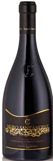
PRIMITIVO GIOIA DEL COLLE DOP "MURO SANT'ANGELO CONTRADA BARBATTO"

Vitigno: Primitivo Tipo di vino: rosso Vinificazione e affinamento: fermentazione in acciaio - affinamento 24 mesi acciaio (15 giorni sui lieviti) - 6 mesi di bottiglia