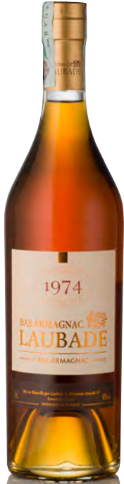
BAS-ARMAGNAC MILLÉSIMÉ Bottiglia 0,70 lt.