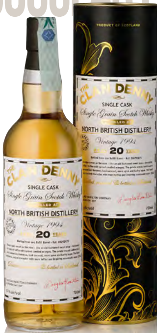
CLAN DENNY NORTH BRITISH DISTILLERY