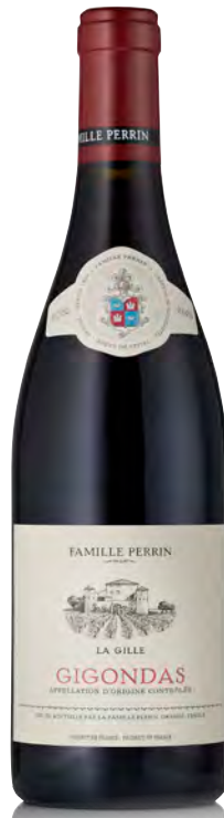
GIGONDAS "LA GILLE"

Vitigno: Grenache 70% - Syrah 20% - Mourvedre 10% Tipo di vino: rosso fermo Vinificazione e affinamento: vitigni vinificati separatamente - Syrah e Mourvedre in legno, Grenache in cemento e gres - affinamento legno grande per 1 anno