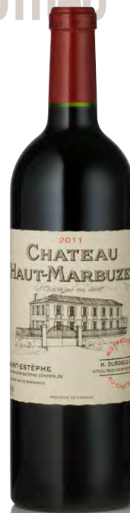
CHÂTEAU HAUT-MARBUZET Saint Estèphe

Vitigno: Cabernet S. 57% - Merlot 37% - Petit Verdot 4% - Cabernet F. 2% Tipo di vino: rosso Vinificazione e affinamento: fermentazione cuve acciaio termoregolate - affinamento barriques nuove 50% per 18 mesi