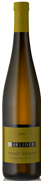
PINOT GRIGIO WEINBERG DOLOMITEN IGT

Vitigno: Müller Thurgau Tipo di vino: bianco Vinificazione e affinamento: fermentazione in acciaio lieviti indigeni - affinamento in acciaio per 10 mesi