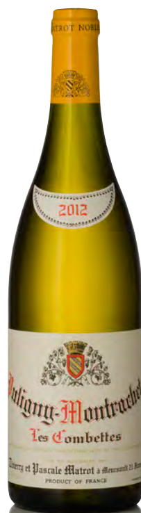
PULIGNY-MONTRACHET 1 er Cru "Les Combettes"

Vitigno: Chardonnay 100% Tipo di vino: bianco fermo Vinificazione e affinamento: lieviti indigeni - fermentazione e affinamento in fûts mai nuovi per 12 mesi - leggero bâtonnage a seconda delle annate