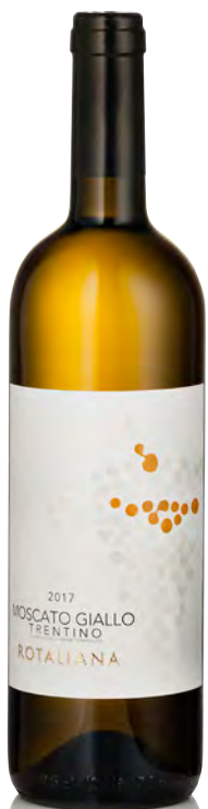
TRENTINO DOC MOSCATO GIALLO

Vitigno: Pinot bianco Tipo di vino: bianco fermo Vinificazione e affinamento: fermentazione in acciaio - permanenza sui lieviti per 4 mesi - affinamento acciaio