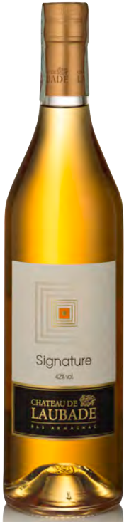
BAS-ARMAGNAC V.S. "SIGNATURE"