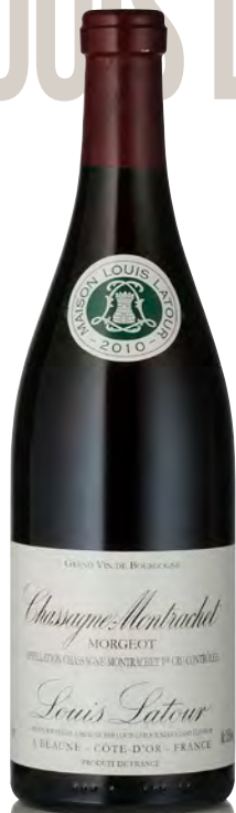
CHASSAGNE-MONTRACHET 1 er Cru "Morgeot"

Vitigno: Pinot nero 100% Tipo di vino: rosso fermo Vinificazione e affinamento: fermentazione cuves legno aperte - malolattica 100% - affinamento fûts nuovi 35% per 12 mesi