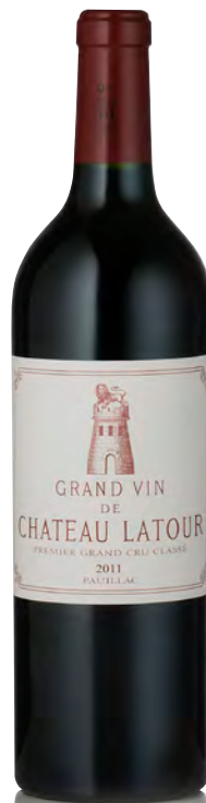
CHÂTEAU LATOUR 1 er Grand Cru Classé - Pauillac

Vitigno: Cabernet S. 70% - Merlot 25% - Cabernet F. 3% - Petit Verdot 2% Tipo di vino: rosso Vinificazione e affinamento: fermentazione tini legno e acciaio e uova di cemento da 50 e 125 hl affinamento barriques nuove 10% per 18 mesi