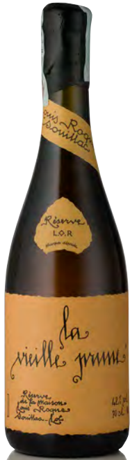
EAU DE VIE "LA VIEILLE PRUNE"