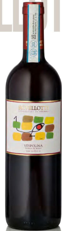
VESPOLINA COLLINE NOVARESIS DOC "RONCO AL MASO"

Vitigno: Nebbiolo Tipo di vino: rosso fermo Vinificazione e affinamento: fermentazione e affinamento in acciaio