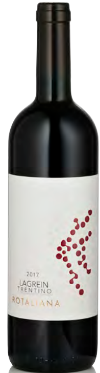
TRENTINO DOC LAGREIN ROSSO

Vitigno: Teroldego Tipo di vino: rosso fermo Vinificazione e affinamento: fermentazione tini rovere - affinamento 24 mesi barrique nuove