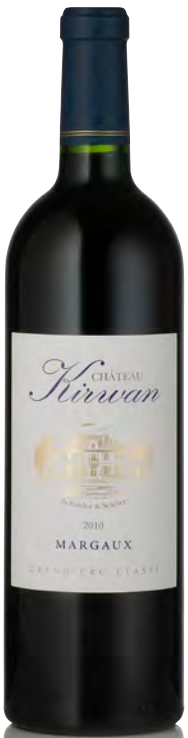
CHÂTEAU KIRWAN 3 ème Grand Cru Classé - Margaux

Vitigno: Cabernet S. 60% - Merlot 32% - Cabernet F. 5% - Petit Verdot 3% Tipo di vino: rosso Vinificazione e affinamento: fermentazione in cemento e acciaio - affinamento barriques nuove 50% per 15 mesi