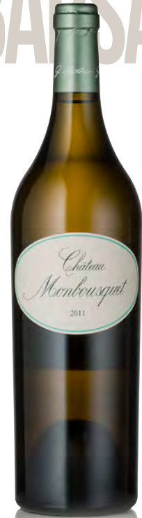
CHÂTEAU MONBOSQUET Bordeaux Blanc

Vinificazione e affinamento: macerazione pellicolare - fermentazione in acciaio - affinamento 50% acciaio e 50% legno grande da 60 hl