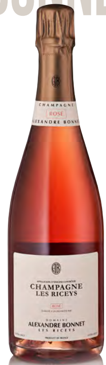
CHAMPAGNE "LES RICEYS" Rosé

Vitigno: Pinot blanc vrai – Chardonnay Tipo di vino: metodo classico bianco Vinificazione e affinamento: fermentazione e affinamento in acciaio per 10 mesi - malolattica svolta - almeno 36 mesi sui lieviti