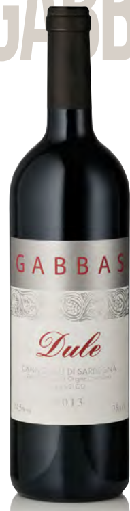
CANNONAU DI SARDEGNA DOC CLASSICO "DULE"

Vitigno: Cannonau Tipo di vino: rosso fermo Vinificazione e affinamento: fermentazione in acciaio sulle bucce - affinamento in acciaio per 7 mesi