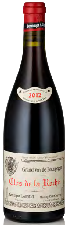
CLOS DE LA ROCHE Grand Cru Vieilles Vignes "Réserve"

Vitigno: Pinot nero 100% Tipo di vino: rosso fermo Vinificazione e affinamento: fermentazione acciaio - affinamento fûts nuovi 100% per 15 mesi