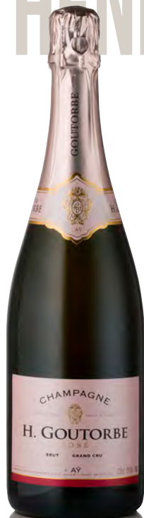
CHAMPAGNE BRUT Grand Cru Rosé

Vitigno: Pinot noir 70% - Chardonnay 25% - Meunier 5% Tipo di vino: metodo classico bianco Vinificazione e affinamento: fermentazione acciaio - permanenza sui lieviti 36 mesi - malolattica svolta