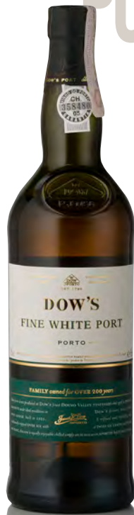
DOW'S PORTO WHITE