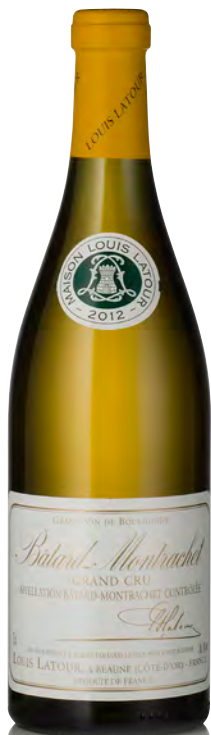
BÂTARD-MONTRACHET Grand Cru

Vitigno: Chardonnay 100% Tipo di vino: bianco fermo Vinificazione e affinamento: fermentazione fûts (228 lt) - malolattica 100% - affinamento fûts nuovi 100% per 10 mesi - vigne interamente di proprietà