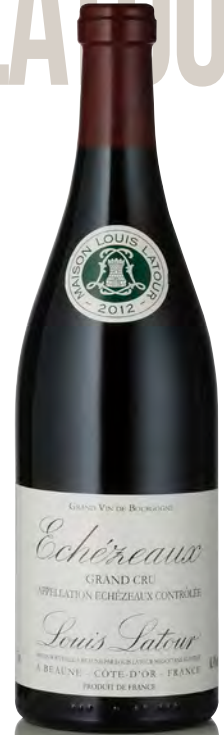
ECHÉZEUX Grand Cru

Vitigno: Pinot nero 100% Tipo di vino: rosso fermo Vinificazione e affinamento: fermentazione cuves legno aperte - malolattica 100% - affinamento fûts nuovi 100% per 12 mesi - vigne interamente di proprietà