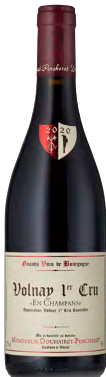
VOLNAY 1ER CRU "EN CHAMPANS"

Vitigno: Pinot nero Tipo di vino: Rosso Vinificazione e affinamento: Lieviti indigeni - Diraspatura parziale - Fermentazione in inox - Affinamento fûts mai nuovi