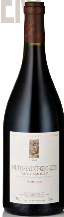
NUITS-SAINT-GEORGES "AUX DAMODES" 1 er Cru

Vitigno: Pinot nero 100% Tipo di vino: rosso fermo Vinificazione e affinamento: fermentazione acciaio - affinamento fûts nuovi 30% per 12 mesi