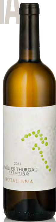
TRENTINO DOC MÜLLER THURGAU

Vitigno: Pinot nero Tipo di vino: rosso fermo Vinificazione e affinamento: fermentazione tini rovere - macerazione di 4 giorni - affinamento 8 mesi barrique usate