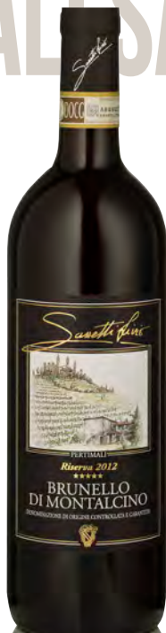
BRUNELLO DI MONTALCINO DOCG RISERVA

Vitigno: Sangiovese grosso Tipo di vino: rosso fermo Vinificazione e affinamento: fermentazione acciaio - macerazione 15 giorni - affinamento 36 mesi legno grande