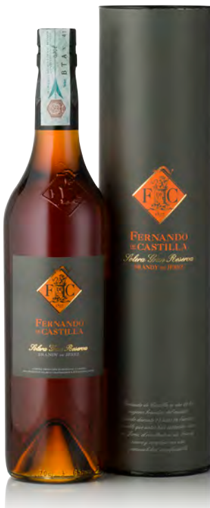
BRANDY SOLERA GRAN RESERVA