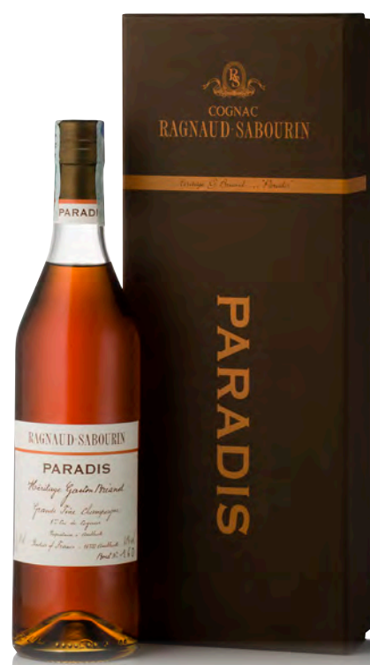
COGNAC GRANDE CHAMPAGNE PARADIS