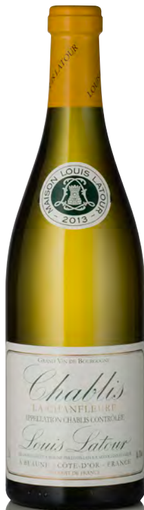
CHABLIS La Chanfleure

Vitigno: Chardonnay 100% Tipo di vino: bianco fermo Vinificazione e affinamento: fermentazione acciaio - malolattica 100% - affinamento 8/10 mesi acciaio