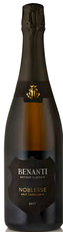
TERRE SICILIANE IGT "NOBLESSE"

Vitigno: Nerello cappuccio Tipo di vino: rosso Vinificazione e affinamento: fermentazione in acciaio con lieviti autoctoni - macerazione 15 giorni - affinamento acciaio 12 mesi