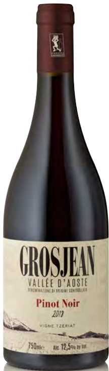
VALLE D'AOSTA DOC PINOT NOIR "VIGNE TZERIAT"