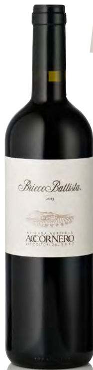
BARBERA DEL MONFERRATO DOC SUPERIORE "BRICCO BATTISTA"

Vitigno: Barbera Tipo di vino: rosso fermo Vinificazione e affinamento: fermentazione in tonneau con lieviti indigeni cappello sommerso - affinamento tonneau 36 mesi