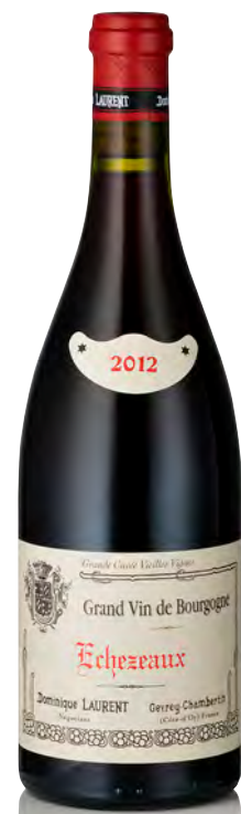
ECHÉZEAUX Grand Cru Vieilles Vignes

Vitigno: Pinot nero 100% Tipo di vino: rosso fermo Vinificazione e affinamento: fermentazione acciaio - affinamento fûts nuovi 30% per 12 mesi