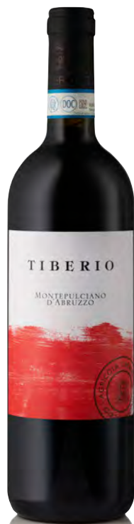
MONTEPULCIANO D'ABRUZZO DOP

Vitigno: Montepulciano Tipo di vino: rosato fermo Vinificazione e affinamento: macerazione a freddo - nessuna pressatura, mosto ottenuto per caduta - fermentazione e affinamento in acciaio-lieviti indigeni - no malolattica