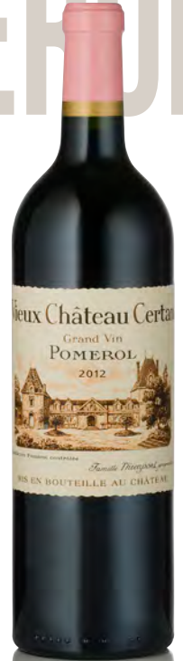
VIEUX CHÂTEAU CERTAN Pomerol

Vitigno: Merlot 90% - Cabernet F. 10% Tipo di vino: rosso Vinificazione e affinamento: fermentazione cuve acciaio termoregolate - affinamento barriques nuove 70% per 18 mesi