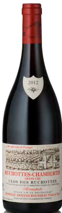
RUCHOTTES-CHAMBERTIN Grand Cru "Clos des Ruchottes"

Vitigno: Pinot nero 100% Tipo di vino: rosso fermo Vinificazione e affinamento: uve interamente diraspate - fermentazione in tini legno e acciaio aperti - affinamento fûts nuovi 40% per 18 mesi