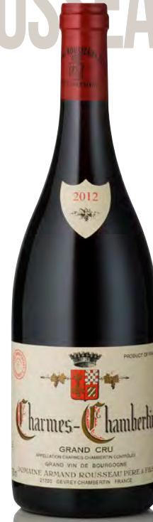
CHARMES-CHAMBERTIN GRAND CRU Grand Cru

Vitigno: Pinot nero 100% Tipo di vino: rosso fermo Vinificazione e affinamento: uve interamente diraspate - fermentazione in tini legno e acciaio aperti - affinamento fûts nuovi 40% per 18 mesi