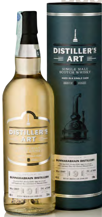
DISTILLER'S ART BUNNAHABHAIN DISTILLERY