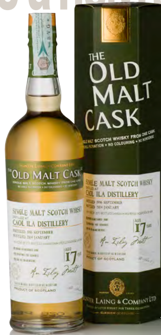
OLD MALT CASK CAOL ILA DISTILLERY