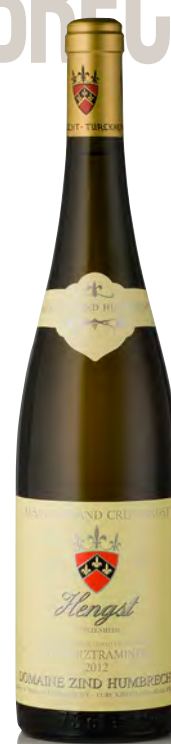
GEWÜRZTRAMINER D'ALSACE "Hengst" - Grand Cru

Vitigno: Gewürztraminer 100% Tipo di vino: bianco fermo Vinificazione e affinamento: lunghissima fermentazione con lieviti indigeni, almeno 6 mesi sur lies - affinamento legno grande per 12 mesi