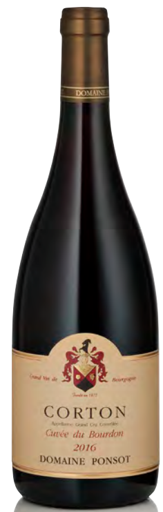
CORTON CUVÉE DU BOURDON Grand Cru

Vitigno: Pinot nero 100% Tipo di vino: rosso fermo Vinificazione e affinamento: diraspatura parziale - fermentazione in tini legno aperti - pressa verticale - affinamento in fûts mai nuovi, anche di 7° e 8° passaggio