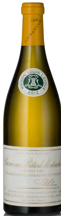
BIENVENUES-BÂTARD-MONTRACHET Grand Cru

Vitigno: Chardonnay 100% Tipo di vino: bianco fermo Vinificazione e affinamento: fermentazione fûts (228 lt) - malolattica 100% - affinamento fûts nuovi 100% per 10 mesi