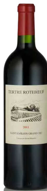
CHÂTEAU LE TERTRE ROTEOEUF

Vitigno: Merlot 70% - Cabernet F. 30% Tipo di vino: rosso Vinificazione e affinamento: fermentazione acciaio - affinamento acciaio e legno grande