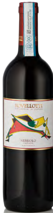
NEBBIOLO COLLINE NOVARESIS DOC "VALPIAZZA"

Vitigno: Nebbiolo 60% - Vespolina 20% - Bonarda 20% Tipo di vino: rosso fermo Vinificazione e affinamento: fermentazione e affinamento in acciaio