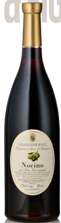
LIQUORE DI NOCINO