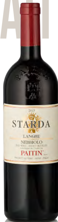
NEBBIOLO LANGHE DOC "STARDA"

Vitigno: Barbera Tipo di vino: rosso fermo Vinificazione e affinamento: fermentazione e macerazione in vasche verticali - affinamento 18 mesi legno grande