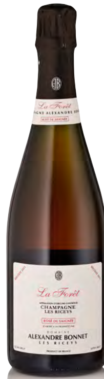
CHAMPAGNE "LES RICEYS" La Forêt - Rosé de Saignée

Vitigno: Pinot blanc vrai – Chardonnay Tipo di vino: metodo classico bianco Vinificazione e affinamento: macerazione di 24 ore preferibilmente a freddo - affinamento in acciaio – malolattica svolta – almeno 36 mesi sui lieviti