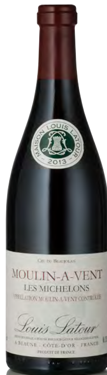
MOULIN À VENT Les Michelons

Vitigno: Pinot nero 100% Tipo di vino: rosso fermo Vinificazione e affinamento: fermentazione cuves legno aperte - malolattica 100% - affinamento acciaio 12 mesi