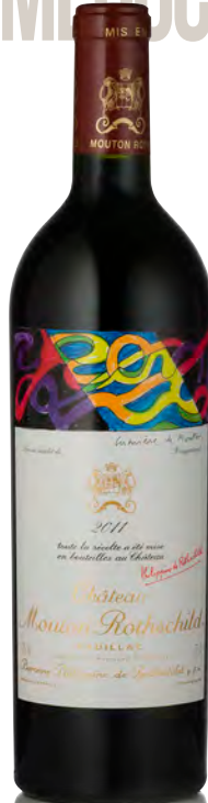
CHÂTEAU MOUTON ROTHSCHILD 1 er Grand Cru Classé - Pauillac

Vitigno: Cabernet S. 50% - Merlot 45% - Cabernet F. 3% - Petit Verdot 2% Tipo di vino: rosso Vinificazione e affinamento: fermentazione acciaio separata per vitigno - affinamento barriques nuove 20% per 18 mesi