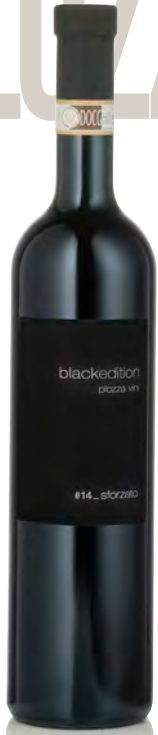
SFORZATO VALTELLINA DOCG

Vitigno: Nebbiolo Tipo di vino: rosso fermo Vinificazione e affinamento: appassimento per 3 mesi - macerazione di 10 gg sulle bucce - affinamento 8 mesi barrique e 24 mesi legno grande