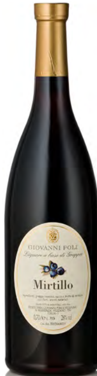
LIQUORE DI MIRTILLO