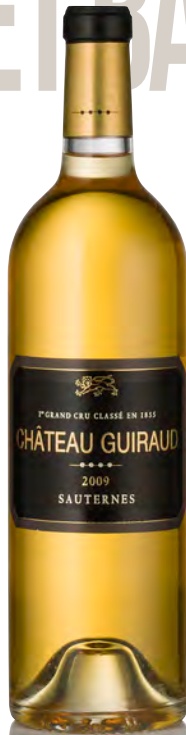
CHÂTEAU GUIRAUD 1 er Grand Cru Classé - Sauternes

Vinificazione e affinamento: uve bottrizzate - fermentazione in barriques - affinamento barriques nuove 50% per 24 mesi