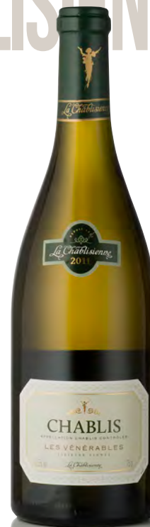
CHABLIS "Les Vénérables" Vieilles Vignes

Vitigno: Chardonnay 100% Tipo di vino: bianco fermo Vinificazione e affinamento: selezione delle migliori uve della denominazione - fermentazione e affinamento in acciaio