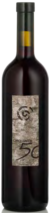
"CINQUANTA/50" TERRAZZE RETICHE DI SONDRIO IGT

Vitigno: Nebbiolo Tipo di vino: rosso fermo Vinificazione e affinamento: appassimento per 3 mesi - macerazione di 7 gg sulle bucce - affinamento 12 mesi barrique e 36 mesi legno grande