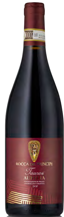
TAURASI DOCG "AURELIA"

Vitigno: Aglianico Tipo di vino: Rosso Vinificazione e affinamento: Fermentazione e macerazione di 15 giorni in acciaio - Affinamento 12 mesi in barrique