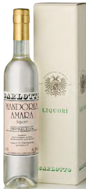
LIQUORE MANDORLA AMARA