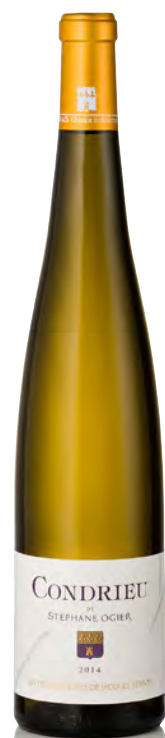
CONDRIEU "Les Vieilles Vignes de Jacques Vernay"

Vitigno: Viognier 100% Tipo di vino: bianco fermo Vinificazione e affinamento: fermentazione con lieviti indigeni in tonneaux e legno grande - affinamento legno grande per 10 mesi