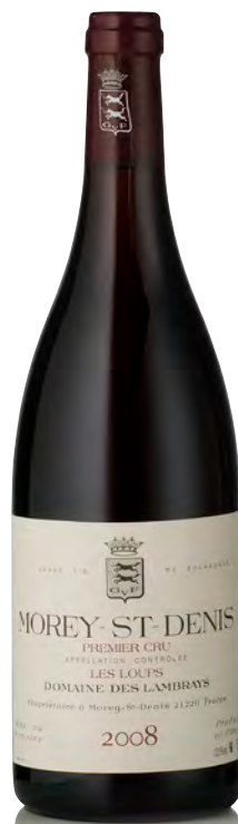
MOREY ST. DENIS 1 er Cru "Les Loups"

Vitigno: Pinot nero 100% Tipo di vino: rosso fermo Vinificazione e affinamento: vinificazione con raspi - fermentazione in acciaio - affinamento in fûts nuovi 60% per 18 mesi