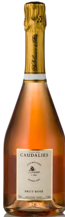
CHAMPAGNE BRUT Grand Cru Rosé "Cuvée des Caudalies"

Vitigno: Chardonnay 50% - Pinot noir 50% Tipo di vino: metodo classico bianco Vinificazione e affinamento: fermentazione in acciaio per Chardonnay e barriques per Pinot nero - permanenza sui lieviti 48 mesi - 20% vini di riserva