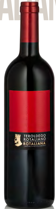
TEROLDEGO ROTALIANO DOC ETICHETTA ROSSA

Vitigno: Chardonnay 75% - Pinot nero 25% Tipo di vino: metodo classico bianco Vinificazione e affinamento: fermentazione acciaio e barrique - 80 mesi sui lieviti