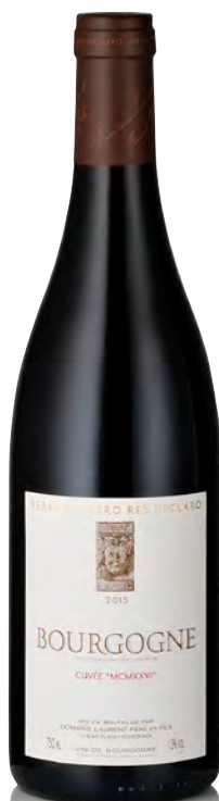
BOURGOGNE Cuvée "MCMXXVI"

Vitigno: Pinot nero 100% Tipo di vino: rosso fermo Vinificazione e affinamento: fermentazione acciaio - affinamento fûts di quarto passaggio per 8 mesi