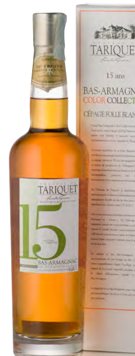
BAS-ARMAGNAC FOLLE BLANCHE 15 ANS