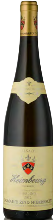
RIESLING D'ALSACE "Heimbuhl"

Vitigno: Riesling 100% Tipo di vino: bianco fermo Vinificazione e affinamento: lunghissima fermentazione con lieviti indigeni, almeno 6 mesi sur lies - affinamento legno grande per 12 mesi