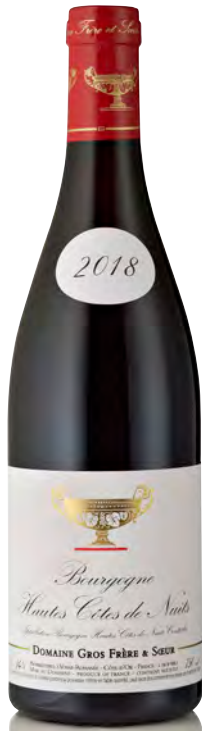
HAUTES CÔTES DE NUITS

Vitigno: Pinot nero 100% Tipo di vino: rosso fermo Vinificazione e affinamento: fermentazione acciaio - affinamento fûts nuovi 50% per 12 mesi