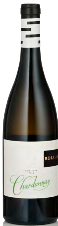
TRENTINO DOC CHARDONNAY "COR-TVTA"

Vitigno: Gewürztraminer Tipo di vino: bianco fermo Vinificazione e affinamento: macerazione a freddo sulle bucce - affinamento acciaio sui lieviti