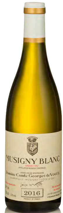
MUSIGNY BLANC Grand Cru

Vitigno: Pinot nero 100% Tipo di vino: rosso fermo Vinificazione e affinamento: l'azienda non fornisce informazioni sulla vinificazione dato che varia a seconda del millesimo