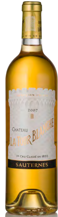
CHÂTEAU LA TOUR BLANCHE 1 er Grand Cru Classé - Sauternes

Vitigno: Sémillon 90% - Sauvignon 7% - Muscadelle 3% Tipo di vino: bianco passito Vinificazione e affinamento: uve botritizzate - 8 settimane di vendemmia - fermentazione barriques - affinamento barriques nuove 50% per 24 mesi