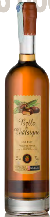
LIQUEUR "BELLE DE CHÂTAIGNE"