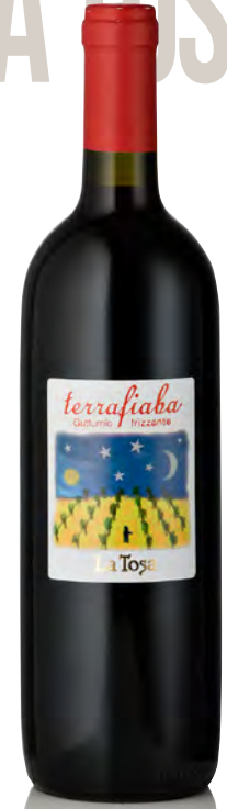
COLLI PIACENTINI DOC GUTTURNIO FRIZZANTE "TERRAFIABA"

Vinificazione e affinamento: pressatura a grappoli interi - affinaneto acciaio sulle fecce per 5 mesi con bâtonnages