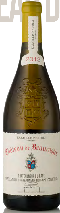
CHÂTEAUNEUF DU PAPE BLANC

Vitigno: Grenache 30% - Mourvedre 30% - Syrah 15% - Counoise 10% - Cinsault 5% - altri vitigni 10% Tipo di vino: rosso fermo Vinificazione e affinamento: vitigni vinificati separatamente - Syrah e Mourvedre in legno, gli altri vitigni in cemento e gres