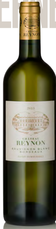
CHÂTEAU REYNON Bordeaux Blanc

Vinificazione e affinamento: fermentazione acciaio - breve affinamento acciaio