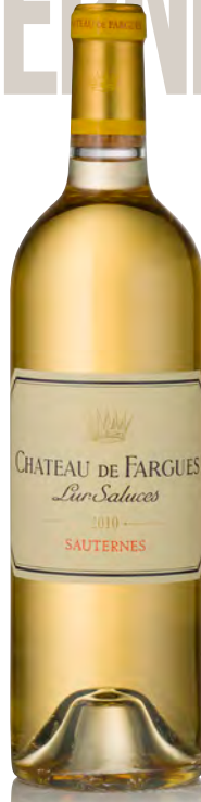
CHÂTEAU DE FARGUES Sauternes

Vitigno: Sémillon 75% - Sauvignon 25% Tipo di vino: bianco passito Vinificazione e affinamento: uve botritizzate - fino a 10 raccolte nel corso della vendemmia - fermentazione in barriques - affinamento barriques nuove 100% per 20 mesi