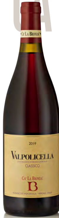
VALPOLICELLA CLASSICO DOC

Vitigno: Garganega 50% - Trebbiano 50% Tipo di vino: bianco Vinificazione e affinamento: diraspatura e macerazione di 6 ore - fermentazione e affinamento barrique di 2° e 3° passaggio per 6 mesi