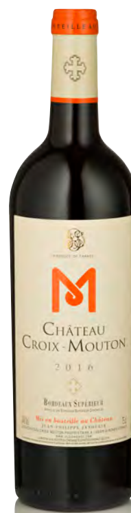
CHATEAU CROIX MOUTON Bordeaux Supérieur

Vitigno: Merlot 83% - Cabernet S. 10% - Cabernet F. 7% Tipo di vino: rosso Vinificazione e affinamento: fermentazione in cemento - affinamento legno grande