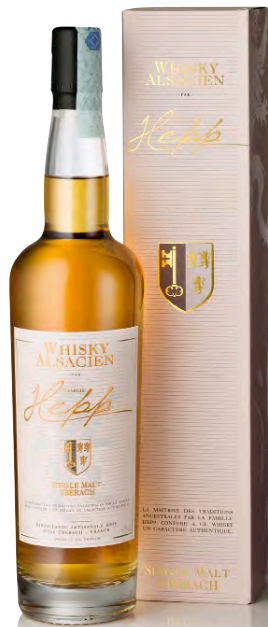
WHISKY ALSACIEN SINGLE MALT