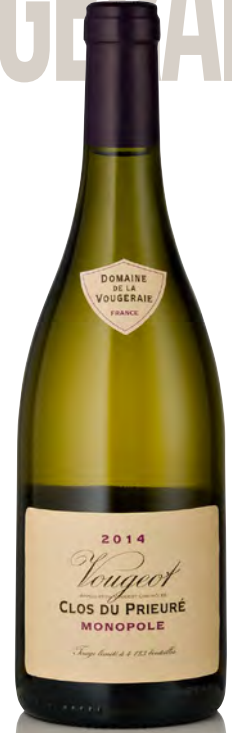
VOUGEOT "Clos du Prieuré Blanc"

Vitigno: Chardonnay 100% Tipo di vino: bianco fermo Vinificazione e affinamento: biodinamica dal 2006 - fermentazione acciaio - affinamento fûts nuovi 33% per 9 mesi e acciaio 6 mesi