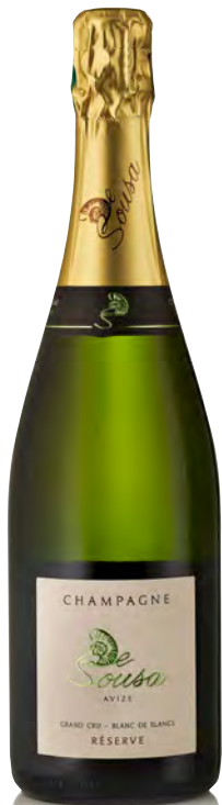
CHAMPAGNE BRUT Grand Cru "Réserve-Blanc de Blancs"

Vitigno: Chardonnay Tipo di vino: metodo classico bianco Vinificazione e affinamento: fermentazione in acciaio - Permanenza sui lieviti 36 mesi - 30% vini di riserva