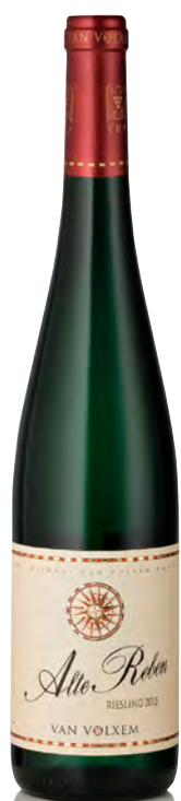
ALTE REBEN RIESLING

Vitigno: Riesling Tipo di vino: bianco fermo Vinificazione e affinamento: fermentazione in acciaio - affinamento 12 mesi legno grande