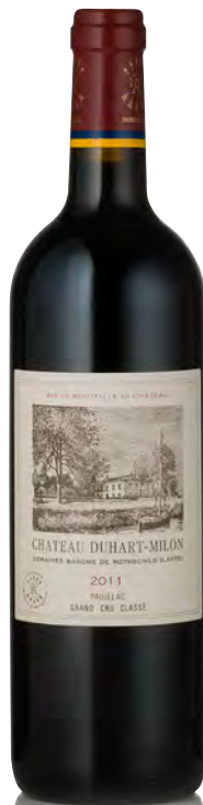
CHÂTEAU DUHART-MILON ROTHSCHILD 4 ème Grand Cru Classé - Pauillac

Vitigno: Cabernet S. 60% - Merlot 35% - Cabernet F. 4% - Petit Verdot 1% Tipo di vino: rosso Vinificazione e affinamento: fermentazione acciaio - affinamento barriques nuove 80% per 18 mesi