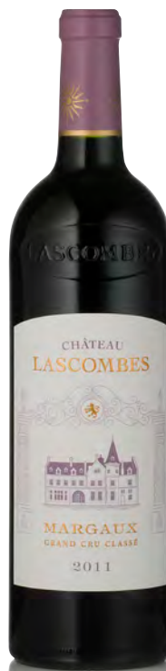
CHÂTEAU LASCOMBES 2 ème Grand Cru Classé - Margaux

Vitigno: Cabernet S. 55% - Merlot 39% - Petit Verdot e Cabernet F. 6% Tipo di vino: rosso Vinificazione e affinamento: fermentazione in tini di legno - affinamento barriques nuove 60% per 18 mesi