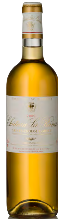
CHÂTEAU LA RAME Sainte Croix du Mont

Vitigno: Sémillon 80% - Sauvignon 15% - Muscadelle 5% Tipo di vino: bianco passito Vinificazione e affinamento: uve bottrizzate - fermentazione barriques - affinamento 6 mesi barriques e 8 mesi acciaio