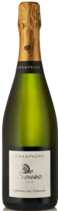
CHAMPAGNE "Chemins des Terroirs"

Vitigno: Chardonnay 40% - Meunier 40% - Pinot nero 20% Tipo di vino: metodo classico bianco Vinificazione e affinamento: fermentazione in acciaio - Permanenza sui lieviti 24 mesi - 20% vini di riserva