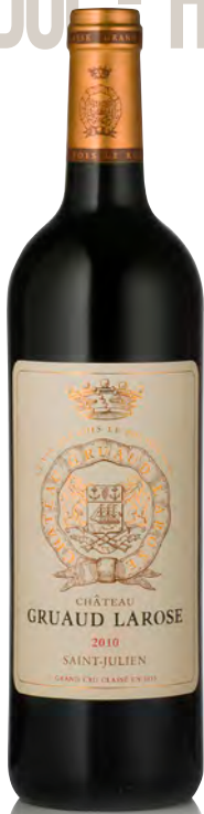
CHÂTEAU GRUAUD-LAROSE 2 ème Grand Cru Classé - Saint Julien

Vitigno: Cabernet S. 61% - Merlot 29% - Cabernet F. 7% - Petit Verdot 3% Tipo di vino: rosso Vinificazione e affinamento: fermentazione 50% cemento e 50% tini legno - macerazione 30 gg. - affinamento barriques nuove 80% per 18 mesi