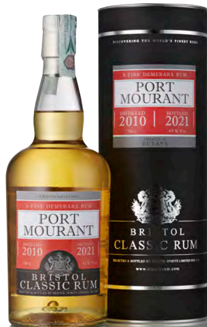
RUM DEMERARA 2010 - PORT MOURANT