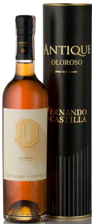
ANTIQUE SHERRY OLOROSO

Vitigno: Palomino fino 100% Tipo di vino: bianco secco Vinificazione e affinamento: fermentazione acciaio con aggiunta di alcol per interrompere la flor a raggiungere i 15° - invecchiamento ossidativo medio 20 anni legno grande