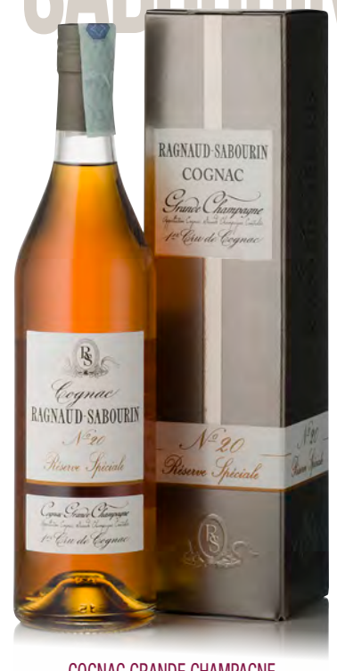
COGNAC GRANDE CHAMPAGNE RÉSERVE SPÉCIALE N°20