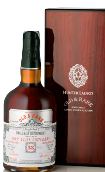
OLD & RARE PORT ELLEN DISTILLERY