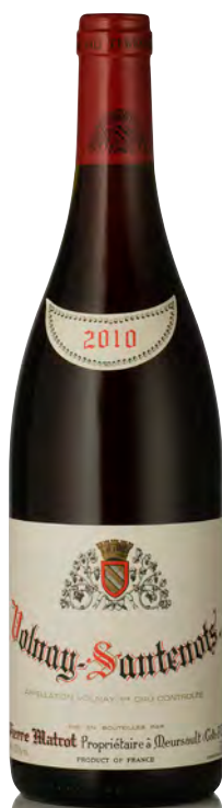
VOLNAY 1 er Cru "Santenots"

Vitigno: Pinot nero 100% Tipo di vino: rosso fermo Vinificazione e affinamento: lieviti indigeni - diraspatura totale - fermentazione in cuves legno aperte per 2 rimontaggi al giorno - affinamento fûts 20% nuovi per 11 mesi