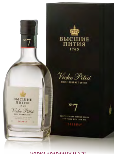
VODKA "CARAWAY N. ° 7"