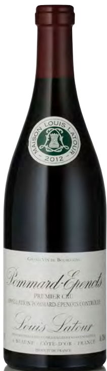
POMMARD 1 er Cru "Epenots"

Vitigno: Pinot nero 100% Tipo di vino: rosso fermo Vinificazione e affinamento: fermentazione cuves legno aperte - malolattica 100% - affinamento fûts nuovi 20% per 12 mesi