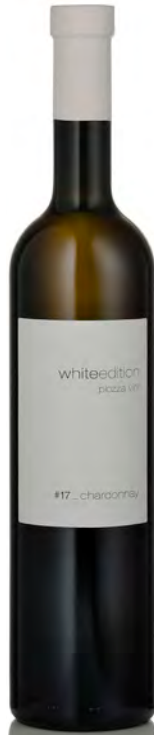
CHARDONNAY ALPI RETICHE IGT

Vitigno: Chardonnay Tipo di vino: bianco fermo Vinificazione e affinamento: fermentazione in barrique sulle fecce - affinamento 5 mesi barrique