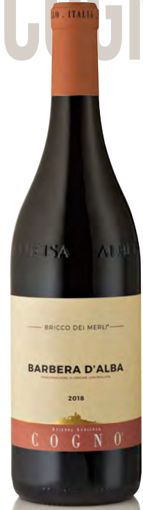
BARBERA D'ALBA DOC "BRICCO DEI MERLI"

Vitigno: Dolcetto Tipo di vino: rosso Vinificazione e affinamento: fermentazione in acciaio - affinamento 8 mesi acciaio