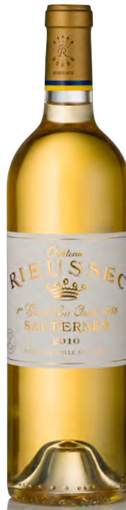
CHÂTEAU RIEUSSEC 1 er Grand Cru Classé - Sauternes

Vitigno: Sémillon 100% Tipo di vino: bianco passito Vinificazione e affinamento: certificazione biodinamica - uve botritizzate - fermentazione in barriques - affinamento barriques nuove 40% per 24 mesi