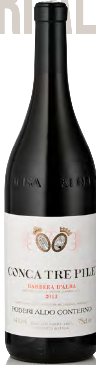
BARBERA D'ALBA DOC "CONCA TRE PILE"

Vitigno: Chardonnay Tipo di vino: bianco fermo Vinificazione e affinamento: fermentazione in barrique - affinamento in barrique usate per 24 mesi