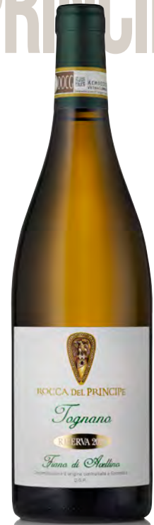
FIANO DI AVELLINO DOCG - "TOGNANO"

Vitigno: Fiano Tipo di vino: bianco Vinificazione e affinamento: Fermentazione in acciaio - Malolattica parzialmente svolta - Affinamento in acciaio su fecce fini per 15 mesi