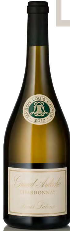
GRAND ARDÈCHE Chardonnay

Vitigno: Chardonnay 100% Tipo di vino: bianco fermo Vinificazione e affinamento: fermentazione acciaio - affinamento 8/10 mesi acciaio