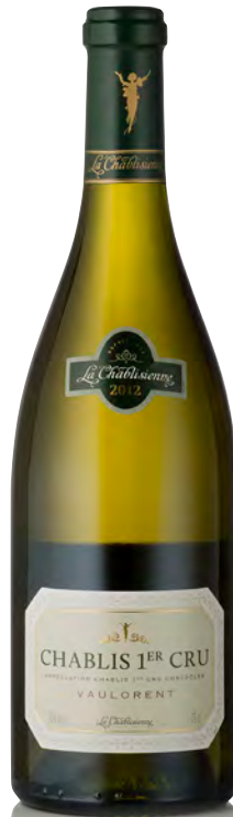
CHABLIS 1 er Cru "Vaulorent"

Vitigno: Chardonnay 100% Tipo di vino: bianco fermo Vinificazione e affinamento: selezione delle migliori uve della denominazione - fermentazione e affinamento in acciaio e fûts parzialmente nuovi