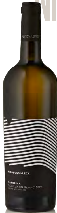
ALTO-ADIGE DOC SAUVIGNON "KAROLINA"

Vinificazione e affinamento: fermentazione acciaio 25% e legno grande 75% - affinamento in acciaio sui lieviti per 6 mesi