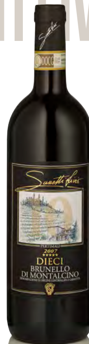
BRUNELLO DI MONTALCINO DOCG "DIECI"

Vitigno: Sangiovese grosso Tipo di vino: rosso fermo Vinificazione e affinamento: fermentazione acciaio - macerazione 15 giorni - affinamento 36 mesi legno grande e 6 mesi bottiglia