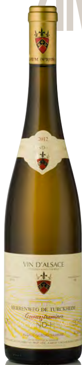
GEWÜRZTRAMINER D'ALSACE "Herrenweg de Turckheim"

Vitigno: Gewürztraminer 100% Tipo di vino: bianco fermo Vinificazione e affinamento: lunghissima fermentazione con lieviti indigeni, almeno 6 mesi sur lies - affinamento legno grande per 12 mesi