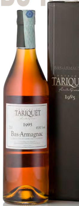
BAS-ARMAGNAC 1995 45,8°