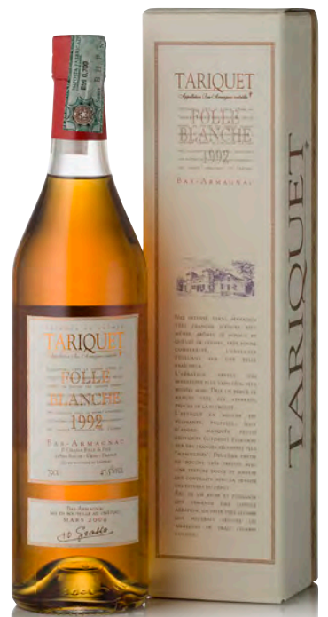
BAS-ARMAGNAC FOLLE BLANCHE 1992