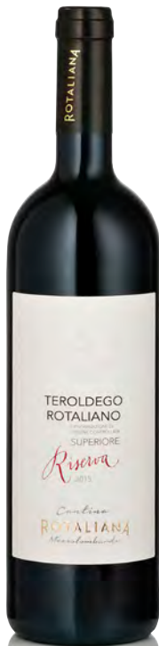
TEROLDEGO ROTALIANO DOC RISERVA

Vitigno: Teroldego Tipo di vino: rosso fermo Vinificazione e affinamento: fermentazione e affinamento in acciaio