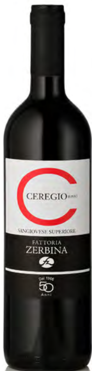
SANGIOVESE SUPERIORE DOC ROMAGNA "CEREGIO"

Vitigno: Albana Tipo di vino: bianco fermo Vinificazione e affinamento: fermentazione acciaio - affinamento acciaio e cemento