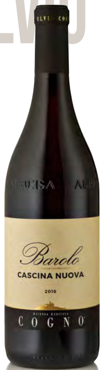
BAROLO DOCG "CASCINA NUOVA"