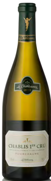
CHABLIS 1 er Cru "Fourchaume"

Vitigno: Chardonnay 100% Tipo di vino: bianco fermo Vinificazione e affinamento: selezione delle uve provenienti da vigneti con più di 50 anni - fermentazione acciaio e fûts - affinamento fûts mai nuovi per 12 mesi