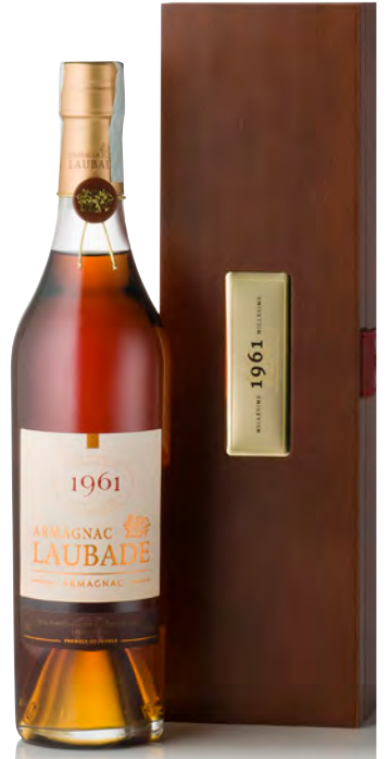
BAS-ARMAGNAC MILLÉSIMÉ Bottiglia 0,50 lt.