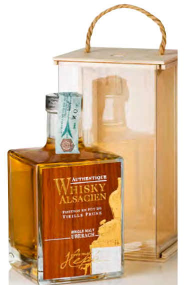
WHISKY ALSACIEN SINGLE MALT "FINITION EN FÛT DE VIEILLE PRUNE"