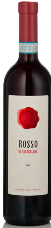
ROSSO DI VALTELLINA DOC

Vitigno: Chardonnay Tipo di vino: bianco fermo Vinificazione e affinamento: fermentazione in barrique sulle fecce - affinamento 5 mesi barrique