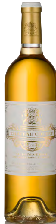
CHÂTEAU COUTET 1 er Grand Cru Classé - Sauternes

Vinificazione e affinamento: uve bottrizzate - fermentazione barriques - affinamento barriques nuove 80% per 18 mesi