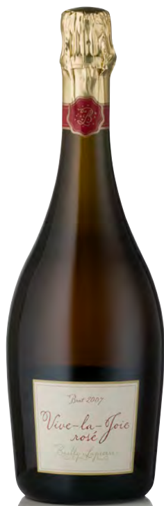
CRÉMANT DE BOURGOGNE BRUT ROSÉ "Vive-la-Joie!"

Vitigno: Pinot nero 50% - Chardonnay 50% Tipo di vino: metodo classico bianco Vinificazione e affinamento: fermentazione in acciaio - 36 mesi sui lieviti