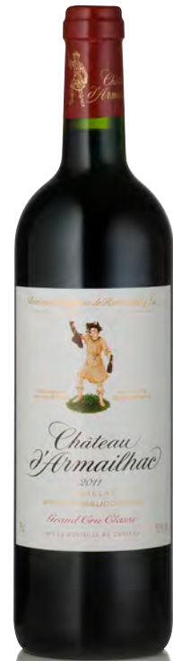
CHÂTEAU D'ARMAILHAC 5 ème Grand Cru Classé - Pauillac

Vitigno: Cabernet S. 67% - Merlot 33% Tipo di vino: rosso Vinificazione e affinamento: fermentazione acciaio - affinamento barriques nuove 50% per 14 mesi