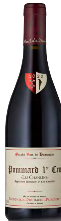
POMMARD 1ER CRU "LES CHANLINS"

Vitigno: Pinot nero Tipo di vino: Rosso Vinificazione e affinamento: Lieviti indigeni - Diraspatura parziale - Fermentazione in inox - Affinamento fût nuovi (20%)