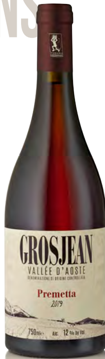
VALLE D'AOSTA DOC PREMETTA

Vinificazione e affinamento: Uve dirasate - Macerazione con le bucce - Rimontaggi - Affinamento acciaio