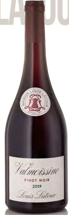
DOMAINE DE VALMOSSINE Pinot Noir

Vitigno: Chardonnay 100% Tipo di vino: bianco fermo Vinificazione e affinamento: fermentazione fûts (228 lt) - malolattica 100% - affinamento fûts nuovi 100% per 10 mesi