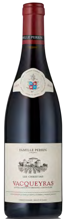
VACQUEYRAS "LES CHRISTINE"

Vitigno: Grenache 60% - Syrah 40% Tipo di vino: Rosso Vinificazione e affinamento: Fermentazione con pigeages e malolattica in acciaio - Affinamento in legno grande per 1 anno