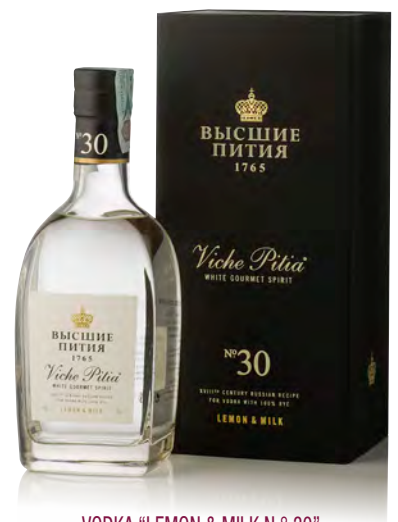
VODKA "LEMON & MILK N. ° 30"