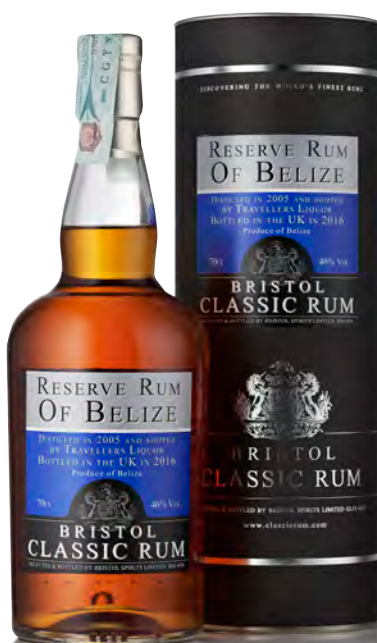
RESERVE RUM OF BELIZE - 2005