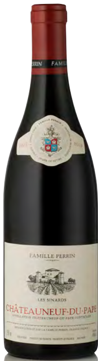
CHÂTEAUNEUF DU PAPE ROUGE "Les Sinards"

Vitigno: Roussanne 100% Tipo di vino: bianco fermo Vinificazione e affinamento: fermentazione 30% in barriques e 70% in legno grande - affinamento 30% in barriques e 70% in legno grande per 8 mesi