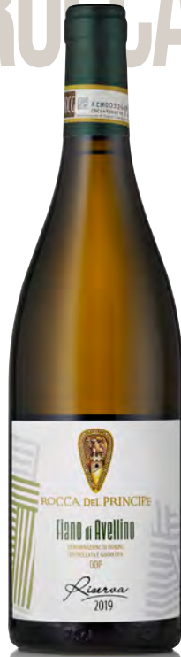
FIANO DI AVELLINO DOCG - "RISERVA"

Vitigno: Fiano Tipo di vino: bianco Vinificazione e affinamento: Fermentazione in acciaio - Malolattica parzialmente svolta - Affinamento in acciaio su fecce fini per 10 mesi in acciaio