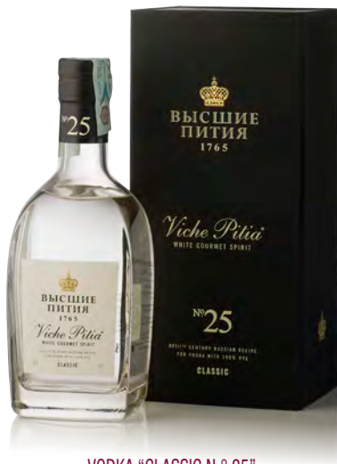
VODKA "CLASSIC N. ° 25"