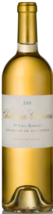
CHÂTEAU CLIMENS 1 er Grand Cru Classé - Sauternes

Vitigno: Sémillon 80% - Sauvignon 20% Tipo di vino: bianco passito Vinificazione e affinamento: uve botritizzate - fino a 10 raccolte nel corso della vendemmia - fermentazione in barriques - affinamento barriques nuove 100% per 36 mesi