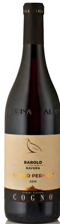
BAROLO DOCG RAVERA "BRICCO PERNICE"

Vinificazione e affinamento: fermentazione in acciaio, macerazione 30 giorni cappello sommerso - affinamento 24 mesi legno da 30 hl