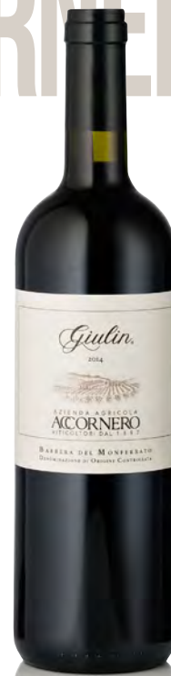
BARBERA DEL MONFERRATO DOC "GIULIN"

Vitigno: Barbera Tipo di vino: rosso fermo Vinificazione e affinamento: fermentazione in tonneau con cappello sommerso - affinamento 24 mesi tonneau