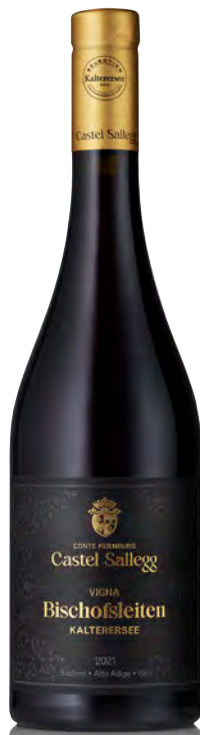
LAGO DI CALDARO CLASSICO SUPERIORE DOC "VIGNA BISCHOFLEITEN"

Vinificazione e affinamento: Diraspatura completa e macerazione uve - Fermentazione e malolattica in acciaio - Barrique (nuove 30%) per 12 mesi