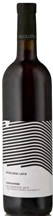
ALTO-ADIGE DOC LAGO CALDARO "ALEXANDER"

Vinificazione e affinamento: fermentazione e affinamento in acciaio per 6 mesi