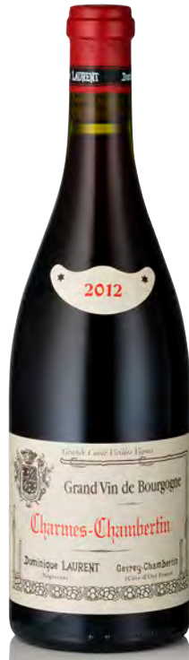
CHARMES-CHAMBERTIN Grand Cru Vieilles Vignes

Vitigno: Pinot nero 100% Tipo di vino: rosso fermo Vinificazione e affinamento: fermentazione acciaio - affinamento fûts nuovi 100% per 15 mesi