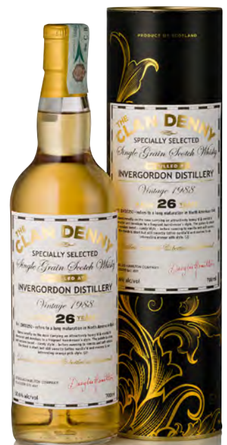
CLAN DENNY INVERGORDON DISTILLERY