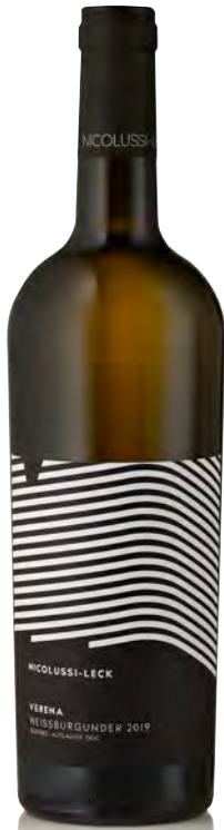
ALTO-ADIGE DOC PINOT BIANCO "VERENA"