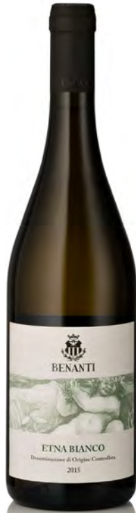
ETNA BIANCO DOC "BENANTI"

Vitigno: Carricante Tipo di vino: bianco fermo Vinificazione e affinamento: fermentazione in acciaio con lieviti autoctoni - affinamento acciaio