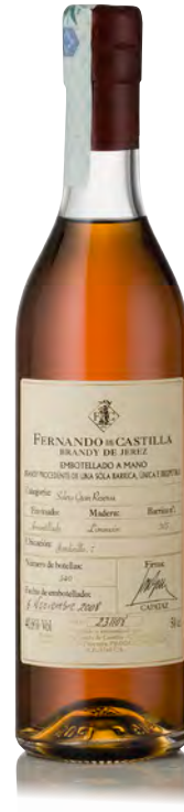
BRANDY SOLERA GRAN RESERVA AMONTILLADO