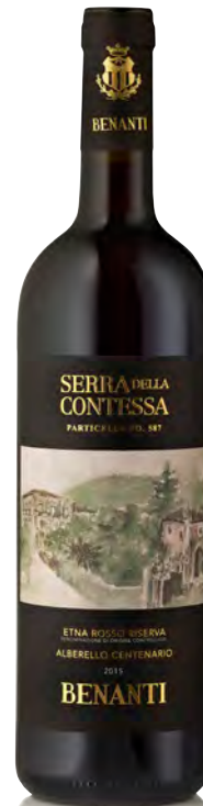
ETNA ROSSO RISERVA DOC "SERRA CONTESSA PARTICELLA NO.587"

Vitigno: Nerello mascalese 90% - Nerello cappuccio 10% Tipo di vino: rosso Vinificazione e affinamento: fermentazione in acciaio con lieviti autoctoni - macerazione 21 giorni - affinamento in botti da 15 hl per 12 mesi