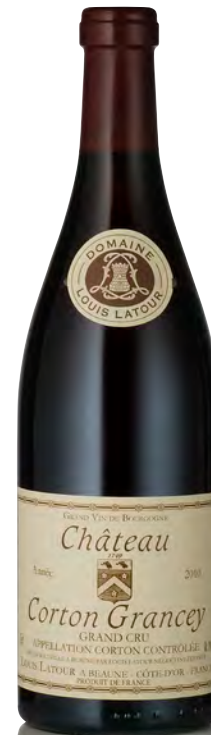
CHÂTEAU CORTON GRANCEY Grand Cru

Vitigno: Pinot nero 100% Tipo di vino: rosso fermo Vinificazione e affinamento: fermentazione cuves legno aperte - malolattica 100% - affinamento fûts nuovi 20% per 12 mesi