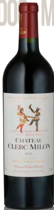
CHÂTEAU CLERC MILON 5 ème Grand Cru Classé - Pauillac

Vitigno: Cabernet S. 75% - Merlot 20% - Cabernet F. 5% Tipo di vino: rosso Vinificazione e affinamento: diraspatura totale fermentazione acciaio - affinamento barriques nuove 60% per 18 mesi