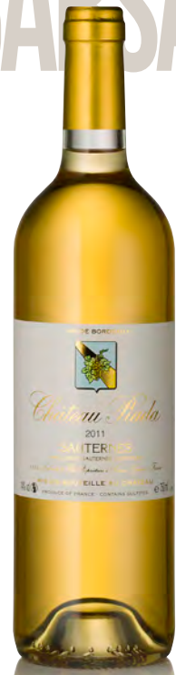
CHÂTEAU PIADA Sauternes

Vitigno: Sémillon 90% - Sauvignon 5% - Muscadelle 5% Tipo di vino: bianco passito Vinificazione e affinamento: uve bottrizzate - fermentazione barriques - affinamento 18 mesi barriques