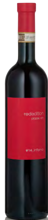
VALTELLINA SUPERIORE DOCG INFERNO RISERVA

Vitigno: Nebbiolo Tipo di vino: rosso fermo Vinificazione e affinamento: macerazione di 5 giorni sulle bucce - affinamento 6 mesi barrique e 30 mesi legno grande