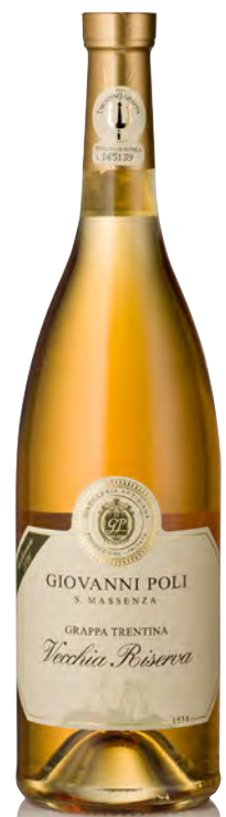
GRAPPA VECCHIA RISERVA