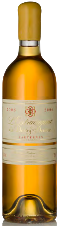
L'EXTRAVAGANT DE DOISY-DAËNE Sauternes

Vitigno: Sémillon 86% - Sauvignon 14% Tipo di vino: bianco passito Vinificazione e affinamento: uve bottrizzate - fermentazione barriques - affinamento 18 mesi barriques