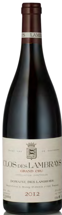
CLOS DES LAMBRAYS Grand Cru

Vitigno: Pinot nero 100% Tipo di vino: rosso fermo Vinificazione e affinamento: vinificazione con raspi - fermentazione in acciaio - affinamento in fûts nuovi 60% per 18 mesi