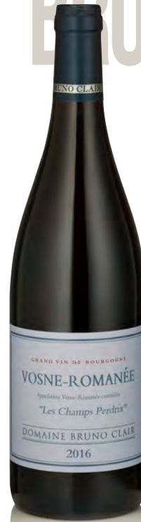
VOSNE ROMANÉE "Les Champs Perdrix"

Vitigno: Pinot nero 100% Tipo di vino: rosso fermo Vinificazione e affinamento: uve raramente diraspate - fermentazione cuve legno aperte - affinamento fûts nuovi 40% per 18 mesi