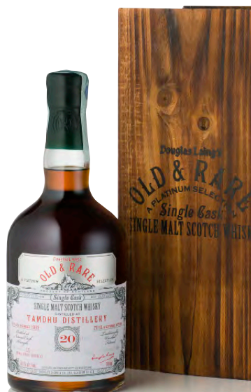
OLD & RARE TAMDHU DISTILLERY