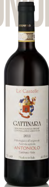
GATTINARA DOCG "VIGNETO LE CASTELLE"

Vitigno: Nebbiolo Tipo di vino: rosso fermo Vinificazione e affinamento: fermentazione in cemento con lieviti indigeni - macerazione sulle bucce 20 gg. - affinamento legno grande 36 mesi