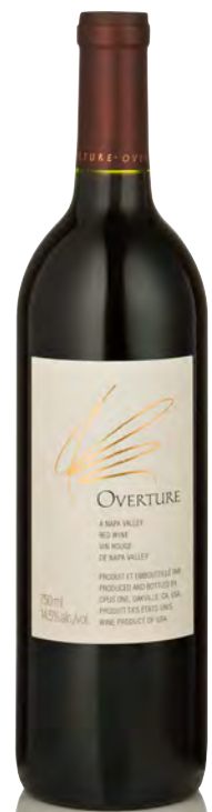
OPUS ONE OVERTURE N.V.

Vitigno: Cabernet S. 80% - Cabernet F. 8% - Merlot 6% - Petit Verdot 4% - Malbec 2% Tipo di vino: rosso fermo Vinificazione e affinamento: fermentazione in acciaio - affinamento 18 mesi barriques nuove - assemblaggio dopo affinamento