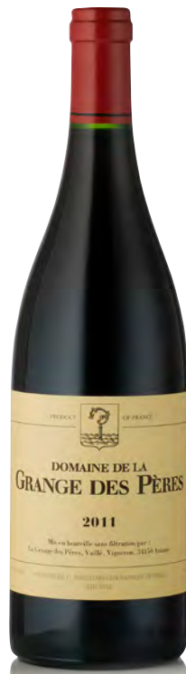
DOMAINE DE LA GRANGE DES PÈRES - ROUGE

Vitigno: Syrah 40% - Mourvèdre 40% - Cabernet S. 20% Tipo di vino: rosso fermo Vinificazione e affinamento: lieviti indigeni - fermentazione in acciaio - affinamento in barriques nuove 35% per 16 mesi