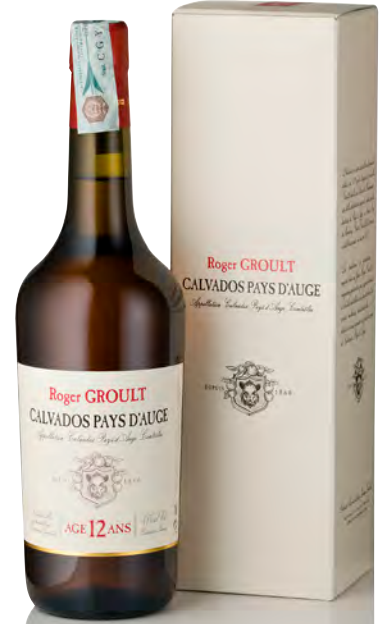
CALVADOS PAYS D'AUGE "12 ANS"