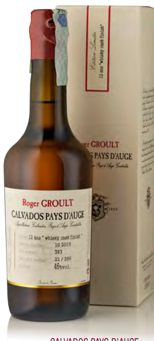
CALVADOS PAYS D'AUGE 12 ANS WHISKY CASK FINISH