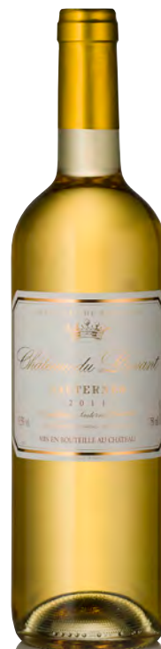
CHÂTEAU DU LEVANT Sauternes

Vitigno: Sémillon 80% - Sauvignon 15% - Muscadelle 5% Tipo di vino: bianco passito Vinificazione e affinamento: uve bottrizzate - fermentazione barriques - affinamento 6 mesi barriques e 8 mesi acciaio