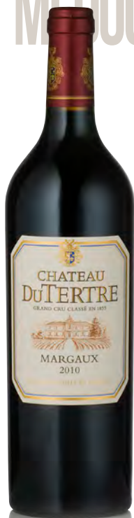
CHÂTEAU DU TERTRE 5 ème Grand Cru Classé - Margaux

Vitigno: Cabernet S. 43% - Merlot 33% - Cabernet F. 19% - Petit Verdot 5% Tipo di vino: rosso Vinificazione e affinamento: fermentazione in cemento, legno e acciaio - affinamento in barriques nuove 45% per 15 mesi