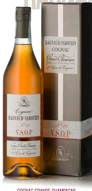
COGNAC GRANDE CHAMPAGNE V.S.O.P. N°10