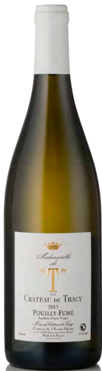
POUILLY-FUMÉ "Mademoiselle de T"

Vitigno: Sauvignon 100% Tipo di vino: bianco fermo Vinificazione e affinamento: fermentazione ed affinamento in acciaio e cemento per 9 mesi