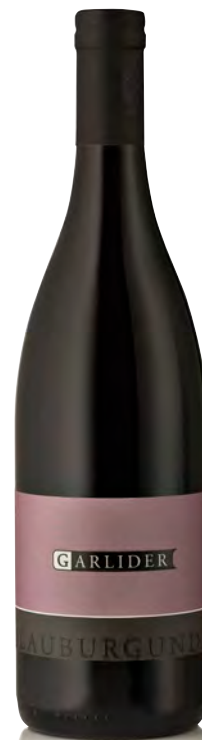
PINOT NERO WEINBERG DOLOMITEN IGT

Vitigno: Grüner Veltliner Tipo di vino: bianco Vinificazione e affinamento: fermentazione con le bucce per 2 settimane in legno - affinamento 1 anno in legno grande e 1 anno in porcellana