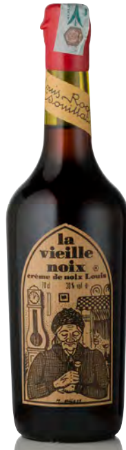
LIQUEUR "LA VIEILLE NOIX"