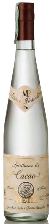
SPIRITEUX DE CACAO