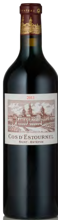
CHÂTEAU COS D'ESTOURNEL 2 ème Grand Cru Classé - Saint Estèphe

Vitigno: Cabernet S. 62% - Merlot 32% - Cabernet F. 4% - Petit Verdot 2% Tipo di vino: rosso Vinificazione e affinamento: certificazione Biodinamica - fermentazione in tini legno e piccole cuve di cemento - affinamento barriques nuove 20% e uova di cemento da 13 hl