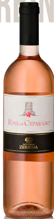
ALBANA DOCG ROMAGNA "ROSA DI CEPARANO"

Vitigno: Sangiovese Tipo di vino: rosso fermo Vinificazione e affinamento: vinificazione in tonneau e acciaio - affinamento barrique nuove (20%) e usate