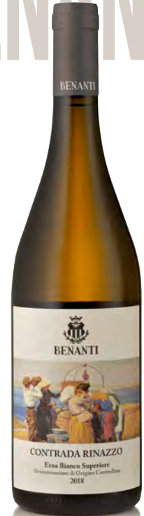
ETNA BIANCO SUPERIORE DOC "CONTRADA RINAZZO"

Vitigno: Carricante Tipo di vino: bianco fermo Vinificazione e affinamento: fermentazione in acciaio con lieviti autoctoni - affinamento acciaio 12 mesi con bâtonnages