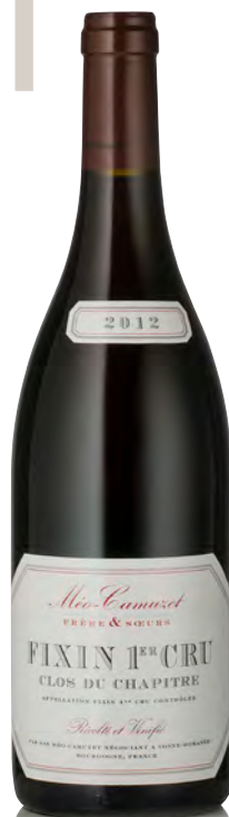
FIXIN 1 er Cru "Clos du Chapitre"

Vitigno: Pinot nero 100% Tipo di vino: rosso fermo Vinificazione e affinamento: diraspatura parziale - fermentazione tini legno aperti - affinamento fûts nuovi in piccola parte