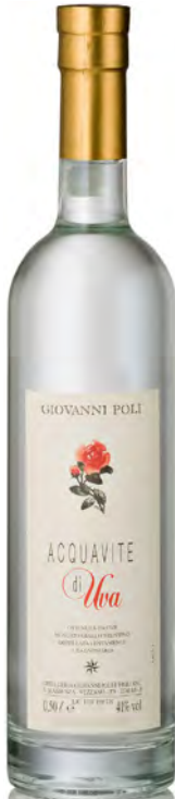
ACQUAVITE D'UVA MOSCATO GIALLO