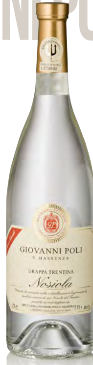
GRAPPA DI NOSIOLA