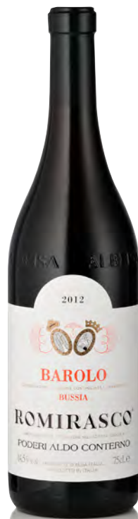
BAROLO BUSSIA DOCG "ROMIRASCO"

Vitigno: Nebbiolo Tipo di vino: rosso fermo Vinificazione e affinamento: macerazione sulle bucce in acciaio per 30 giorni - affinamento legno grande