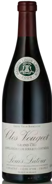
CLOS VOUGEOT Grand Cru

Vitigno: Pinot nero 100% Tipo di vino: rosso fermo Vinificazione e affinamento: fermentazione cuves legno aperte - malolattica 100% - affinamento fûts nuovi 35% per 12 mesi