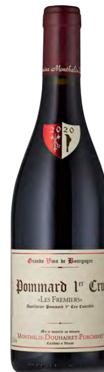
POMMARD 1ER CRU "LES FREMIERS"

Vitigno: Pinot nero Tipo di vino: Rosso Vinificazione e affinamento: Lieviti indigeni - Diraspatura parziale - Fermentazione in inox - Affinamento fûts nuovi (20%)