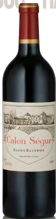
CHÂTEAU CALON SÉGUR 3 ème Grand Cru Classé - Saint Estèphe

Vitigno: Cabernet S. 56% - Merlot 35% - Cabernet F. 7% - Petit Verdot 2% Tipo di vino: rosso Vinificazione e affinamento: fermentazione in vasche acciaio da 5 a 120 hl - affinamento barriques nuove 100% per 18 mesi