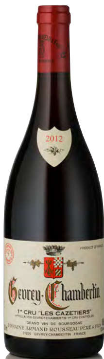
GEVREY-CHAMBERTIN 1er Cru "Les Cazetiers"

Vitigno: Pinot nero 100% Tipo di vino: rosso fermo Vinificazione e affinamento: uve interamente diraspate - fermentazione in tini legno e acciaio aperti - affinamento fûts mai nuovi per 18 mesi