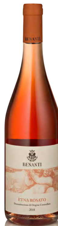
ETNA ROSATO BENANTI DOC

Vitigno: Nerello mascalese Tipo di vino: metodo classico rosato Vinificazione e affinamento: fermentazione acciaio - almeno 24 mesi sui lieviti