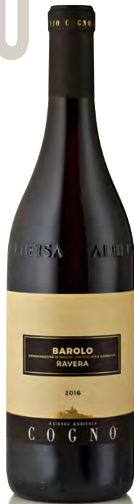
BAROLO DOCG "RAVERA"

Vinificazione e affinamento: fermentazione in acciaio con rimontaggio automatico - affinamento 24 mesi legno grande