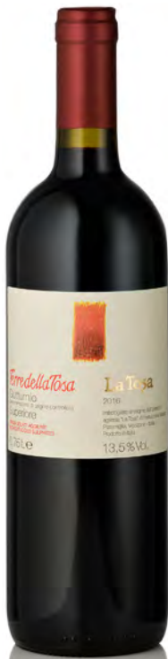
COLLI PIACENTINI DOC GUTTURNIO SUPERIORE "TERRE DELLA TOSA"

Vinificazione e affinamento: macerazione sulle bucce per 6 giorni - presa spuma in autoclave - 5 settimane sur lie