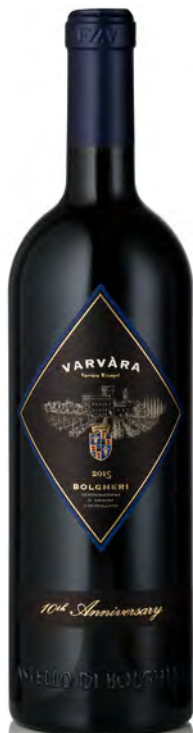
BOLGHERI ROSSO DOC "VARVÀRA"

Vitigno: Cabernet Sauvignon 60% - Cabernet Franc 5% - Merlot 15% - Petit Verdot 5% Tipo di vino: rosso fermo Vinificazione e affinamento: fermentazione acciaio - macerazione di 20 giorni - affinamento 12 mesi tonneaux e barrique