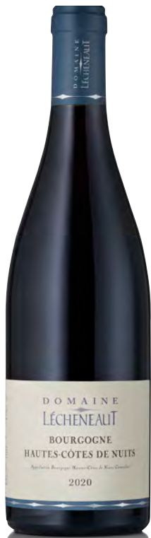
BOURGOGNE HAUTES CÔTES DE NUITS

Vitigno: Pinot Nero Tipo di vino: Rosso Vinificazione e affinamento: Diraspatura parziale - Fermentazione cuve aperte con pigeage - Malolattica e affinamento in fûts (20%) nuovi