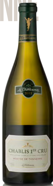
CHABLIS 1 er Cru "Montée de Tonnerre"

Vitigno: Chardonnay 100% Tipo di vino: bianco fermo Vinificazione e affinamento: selezione delle migliori uve della denominazione - fermentazione e affinamento in acciaio e fûts parzialmente nuovi