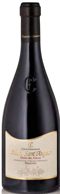
PRIMITIVO GIOIA DEL COLLE DOP "MURO SANT'ANGELO"

Vitigno: Primitivo Tipo di vino: rosso Vinificazione e affinamento: fermentazione in acciaio - affinamento 6 mesi acciaio - 2 mesi di bottiglia