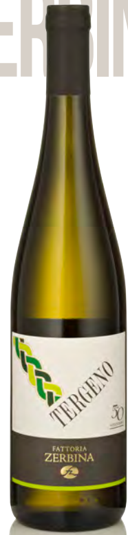
RAVENNA BIANCO IGT "TERGENO"

Vitigno: Albana Tipo di vino: bianco fermo Vinificazione e affinamento: fermentazione acciaio - affinamento cemento sulle fecce per 6 mesi