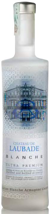
EAU DE VIE DE VIN DE FOLLE BLANCHE "ULTRA PREMIUM"