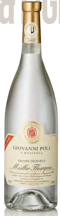
GRAPPA DI MÜLLER THURGAU