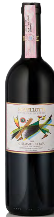
GHEMME RISERVA DOCG "COSTA DEL SALMINO"

Vitigno: Nebbiolo 85% - Vespolina 15% Tipo di vino: rosso fermo Vinificazione e affinamento: fermentazione in acciaio - affinamento 36 mesi legno grande