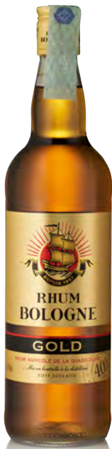
RHUM AGRICOLE DE LA GUADELOUPE "GOLD"