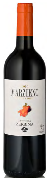
RAVENNA IGT "MARZIENO"

Vitigno: Sangiovese 90% - Merlot 8% - Ancellotta 2% Tipo di vino: rosso fermo Vinificazione e affinamento: fermentazione acciaio - affinamento barrique usate e tonneaux