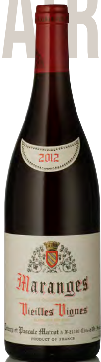
MARANGES ROUGE Vieilles Vignes

Vitigno: Pinot nero 100% Tipo di vino: rosso fermo Vinificazione e affinamento: lieviti indigeni - diraspatura totale - fermentazione in cuves legno aperte per 2 rimontaggi al giorno - affinamento fûts mai nuovi per 11 mesi