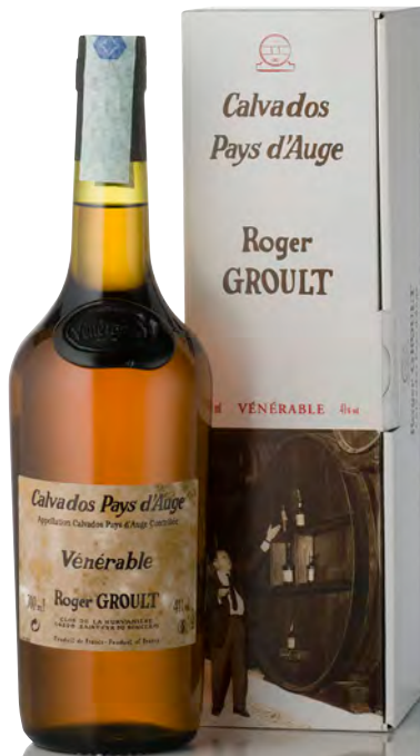
CALVADOS PAYS D'AUGE "VÉNÉRABLE" 20 ANS