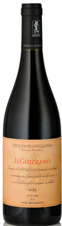
"IL GHIZZANO" ROSSO

Vitigno: Sangiovese 95% - Merlot 5% Tipo di vino: rosso fermo Vinificazione e affinamento: fermentazione con lieviti indigeni in acciaio - affinamento acciaio e cemento