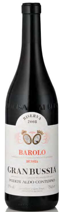
BAROLO DOCG RISERVA "GRANBUSSIA"

Vitigno: Nebbiolo Tipo di vino: rosso fermo Vinificazione e affinamento: macerazione sulle bucce in acciaio per 30 giorni - affinamento legno grande