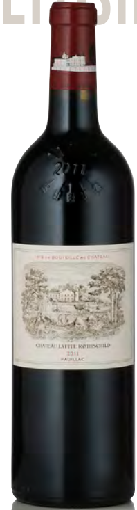
CHÂTEAU LAFITE ROTHSCHILD 1 er Grand Cru Classé - Pauillac

Vitigno: Cabernet S. 75% - Merlot 15% - Cabernet F. 10% Tipo di vino: rosso Vinificazione e affinamento: fermentazione acciaio - affinamento barriques nuove 50% per 14 mesi