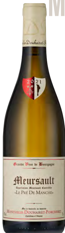
MEURSAULT "LES PRÉ DE MANCHE"

Vitigno: Chardonnay Tipo di vino: bianco Vinificazione e affinamento: Fermentazione con lieviti indigeni in inox - Malolattica e affinamento in fûts di 3° passaggio