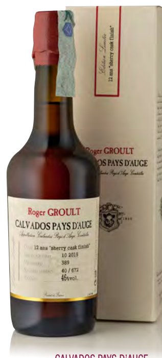
CALVADOS PAYS D'AUGE 12 ANS SHERRY CASK FINISH