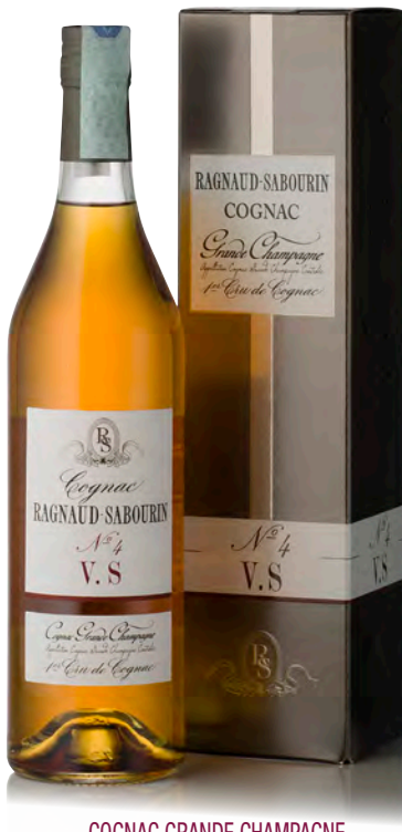
COGNAC GRANDE CHAMPAGNE V.S. N°4