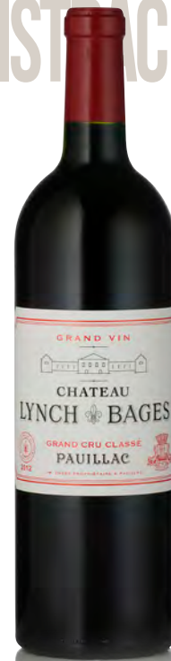
CHÂTEAU LYNCH-BAGES 5 ème Grand Cru Classé - Pauillac

Vitigno: Cabernet S. 50% - Merlot 37% - Cabernet F. 10% - Petit Verdot 3% Tipo di vino: rosso Vinificazione e affinamento: fermentazione acciaio - affinamento barriques nuove 40% per 18 mesi