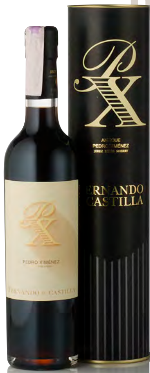
ANTIQUE SHERRY PEDRO XIMENEZ

Vitigno: Pedro Ximenez 100% Tipo di vino: rosso dolce Vinificazione e affinamento: uve passite - nel corso della fermentazione aggiunta di alcol a raggiungere i 15° - invecchiamento medio 30 anni solera