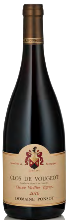
CLOS DE VOUGEOT Grand Cru Vieilles Vignes

Vitigno: Pinot nero 100% Tipo di vino: rosso fermo Vinificazione e affinamento: diraspatura parziale - fermentazione in tini legno aperti - pressa verticale - affinamento in fûts mai nuovi, anche di 7° e 8° passaggio