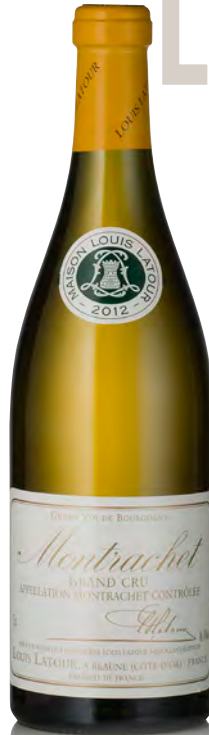
MONTRACHET Grand Cru

Vitigno: Chardonnay 100% Tipo di vino: bianco fermo Vinificazione e affinamento: fermentazione fûts (228 lt) - malolattica 100% - affinamento fûts nuovi 100% per 10 mesi