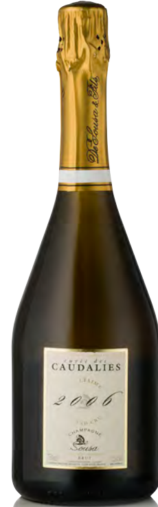
CHAMPAGNE BRUT Grand Cru Blanc de Blancs Millésimé "Cuvée des Caudalies"

Vitigno: Chardonnay 90% - Pinot nero 10% Tipo di vino: metodo classico rosato Vinificazione e affinamento: fermentazione in barriques - permanenza sui lieviti 48 mesi - no vini di riserva