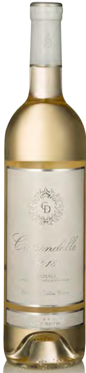
CLARENDELLE BLANC Inspired by Haut-Brion

Vitigno: Sémillon 42% - Sauvignon 30% - Muscadelle 28%