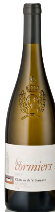
SAUMUR BLANC "Les Cormiers"

Vitigno: Chenin 100% Tipo di vino: bianco fermo Vinificazione e affinamento: lieviti indigeni - fermentazione acciaio - no malolattica - affinamento tonneaux 40% e acciaio per 8 mesi