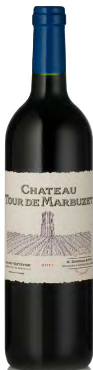
CHÂTEAU TOUR DE MARBUZET Saint Estèphe

Vitigno: Merlot 55% - Cabernet S. 35% - Cabernet F. 5% - Petit Verdot 5% Tipo di vino: rosso Vinificazione e affinamento: diraspatura totale fermentazione tini legno e vasche cemento - affinamento barriques nuove 100% per 15 mesi