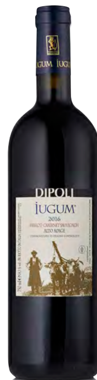
ALTO-ADIGE DOC MERLOT-CABERNET SAUVIGNON "IUGUM"

Vinificazione e affinamento: Diraspatura, macerazione, fermentazione e malolattica in inox - Affinamento barrique 1° e 2° passaggio - 4 mesi in cemento