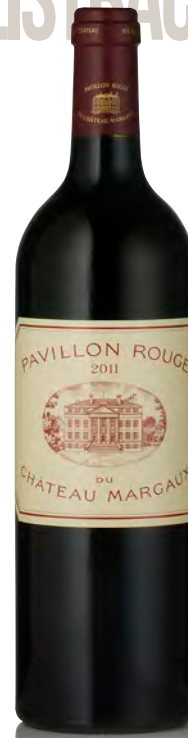
PAVILLON ROUGE DU CHÂTEAU MARGAUX - Margaux

Vitigno: Cabernet S. 90% - Cabernet F. 5% - Merlot 5% Tipo di vino: rosso Vinificazione e affinamento: fermentazione tini legno e minima parte acciaio - affinamento barriques nuove per 18/24 mesi