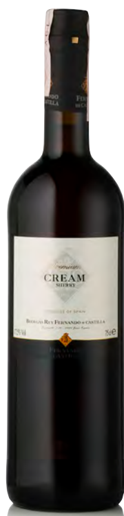
PREMIUM CREAM SHERRY

Vitigno: Palomino fino 100% Tipo di vino: bianco secco Vinificazione e affinamento: fermentazione acciaio con aggiunta di alcol a raggiungere i 20° - invecchiamento ossidativo 20 anni