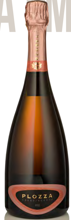
FRANCIACORTA DOCG ROSÉ BRUT

Vitigno: Chardonnay 100% Tipo di vino: metodo classico bianco Vinificazione e affinamento: fermentazione e permanenza in acciaio per 9 mesi - presa di spuma e permanenza sui lieviti per 36 mesi