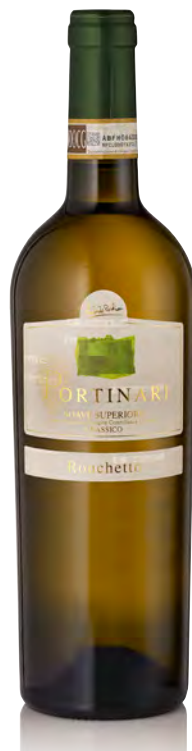
SOAVE CLASSICO SUPERIORE DOCG "ROCHETTO"

Vitigno: Garganega 100% Tipo di vino: bianco Vinificazione e affinamento: fermentazione in acciaio - affinamento 12 mesi acciaio sui lieviti - 12 mesi di bottiglia