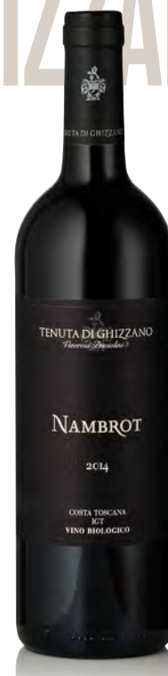
"NAMBROT" COSTA TOSCANA IGT

Vitigno: Sangiovese 70% - Cabernet Sauvignon 30% Tipo di vino: rosso fermo Vinificazione e affinamento: fermentazione con lieviti indigeni in tini di legno - affinamento tonneaux di 2°, 3° e 4° passaggio