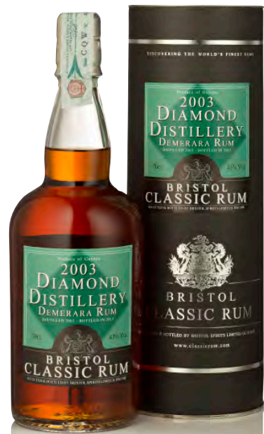
RUM DEMERARA 2003