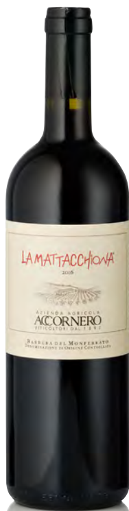
BARBERA DEL MONFERRATO DOC "LA MATTACCHIONA"

Vitigno: Barbera Tipo di vino: rosso fermo Vinificazione e affinamento: fermentazione in tonneau con cappello sommerso - affinamento 12 mesi tonneau e acciaio