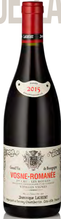
VOSNE-ROMANÉE "LES ROUGES" 1 er Cru "Vieilles Vignes"

Vitigno: Pinot nero 100% Tipo di vino: rosso fermo Vinificazione e affinamento: fermentazione acciaio - affinamento fûts nuovi 30% per 12 mesi