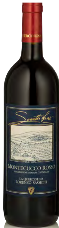
MONTECUCCO ROSSO DOC

Vitigno: Sangiovese grosso della Maremma Tipo di vino: rosso fermo Vinificazione e affinamento: fermentazione acciaio - macerazione 15 giorni - affinamento legno grande 6 mesi