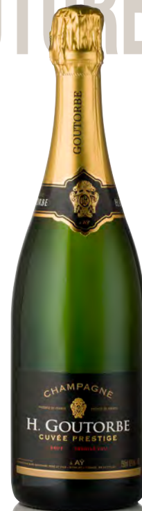
CHAMPAGNE BRUT 1 er Cru Cuvée "Prestige"

Vitigno: Pinot noir 75% - Chardonnay 25% Tipo di vino: metodo classico rosato Vinificazione e affinamento: rosé d'assemblage con 12% di vino rosso di Ay - fermentazione acciaio - permanenza sui lieviti 48 mesi