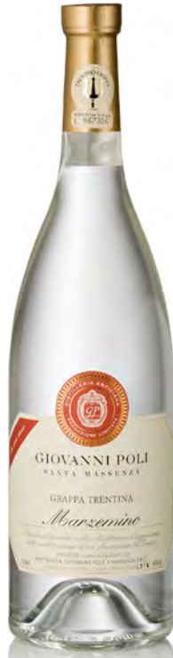
GRAPPA DI MARZEMINO