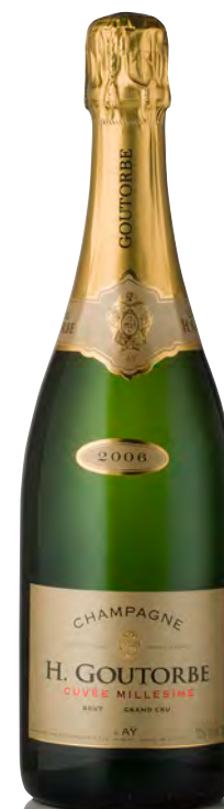
CHAMPAGNE BRUT GRAND CRU Millésimé

Vitigno: Chardonnay 100% Tipo di vino: metodo classico bianco Vinificazione e affinamento: fermentazione acciaio - permanenza sui lieviti 48 mesi - malolattica parziale