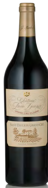
CHÂTEAU PAVIE DECESSE

Vitigno: Merlot 75% - Cabernet F. 23% - Cabernet S. 2% Tipo di vino: rosso Vinificazione e affinamento: diraspatura parziale - fermentazione tini legno aperti e cemento - affinamento barriques nuove 70% per 18 mesi