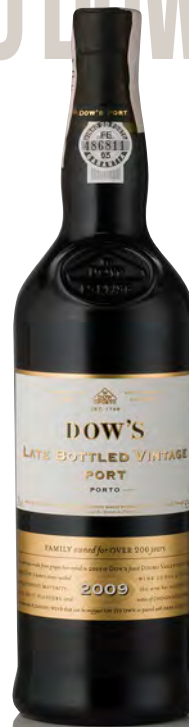
DOW'S PORTO LATE BOTTLED VINTAGE