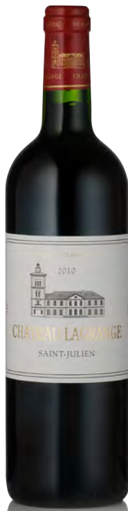
CHÂTEAU LAGRANGE 3 ème Grand Cru Classé - Saint Julien

Vitigno: Cabernet S. 57% - Merlot 34% - Cabernet F. 9% Tipo di vino: rosso Vinificazione e affinamento: fermentazione in tini legno - macerazione di 3 settimane - affinamento barriques nuove 60% per 18 mesi