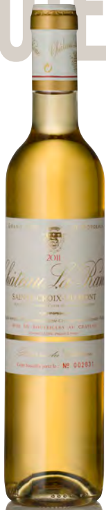
CHÂTEAU LA RAME "RÉSERVE DU CHÂTEAU" Sainte Croix du Mont