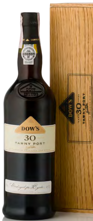
DOW'S PORTO TAWNY - 30 ANNI