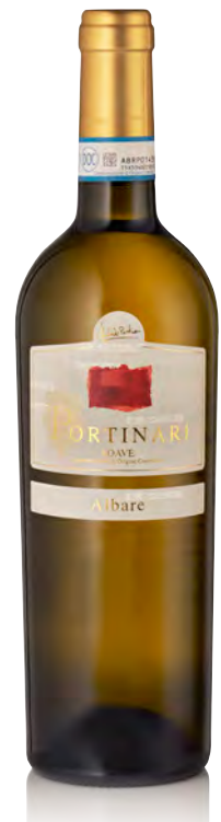
SOAVE DOC "ALBARE"

Vitigno: Garganega 100% Tipo di vino: bianco Vinificazione e affinamento: fermentazione in acciaio - affinamento 12 mesi acciaio sui lieviti - 12 mesi di bottiglia