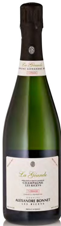
CHAMPAGNE "LES RICEYS" La Géande - 7 Cépages

Vitigno: Pinot noir Tipo di vino: metodo classico rosato Vinificazione e affinamento: fermentazione e affinamento in acciaio per 10 mesi - malolattica svolta - almeno 36 mesi sui lieviti