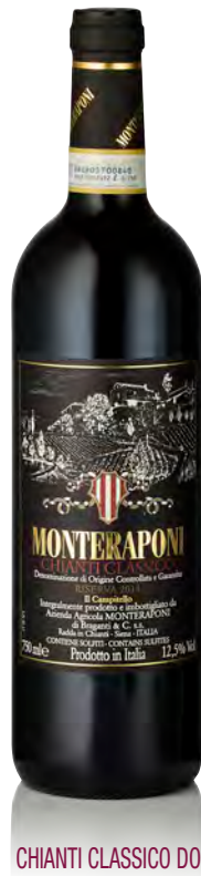
CHIANTI CLASSICO DOCG RISERVA "IL CAMPITELLO"

Vitigno: Sangiovese 95% - Cannaiolo 5% Tipo di vino: rosso fermo Vinificazione e affinamento: macerazione sulle bucce 25 giorni - fermentazione cemento - affinamento legno grande 16 mesi