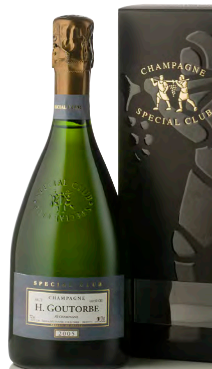
CHAMPAGNE BRUT GRAND CRU MILLÉSIMÉ "Special Club"

Vitigno: Pinot noir 75% - Chardonnay 25% Tipo di vino: metodo classico bianco Vinificazione e affinamento: fermentazione acciaio - permanenza sui lieviti 72 mesi - malolattica svolta