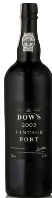
DOW'S VINTAGE PORT