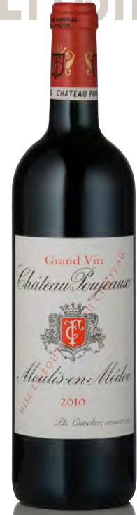
CHÂTEAU POUJEAUX Moulis en Médoc

Vitigno: Cabernet S. 50% - Merlot 42% - Petit Verdot 6% - Cabernet F. 2% Tipo di vino: rosso Vinificazione e affinamento: uve diraspate - fermentazione cemento e acciaio - affinamento barriques usate per 18 mesi