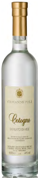
ACQUAVITE DI MELE COGNE