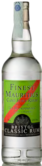
FINEST MAURITIUS CANE JUICE RUM