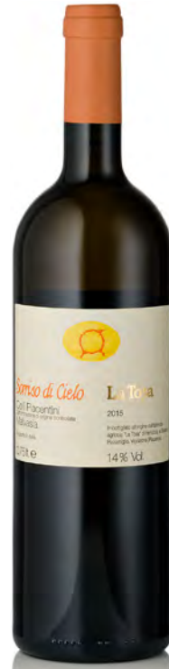
COLLI PIACENTINI DOC MALVASIA "SORRISO DI CIELO"

Vinificazione e affinamento: pressatura a grappoli interi - affinaneto acciaio sulle fecce per 7 mesi con bâtonnages