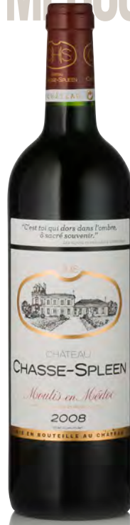
CHÂTEAU CHASSE-SPLEEN Moulis en Médoc

Vitigno: Merlot 65% - Cabernet S. 35% Tipo di vino: rosso Vinificazione e affinamento: fermentazione in cemento - affinamento barriques usate