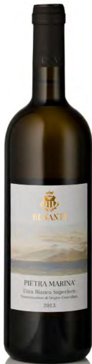
ETNA BIANCO SUPERIORE DOC "PIETRA MARINA"

Vitigno: Carricante Tipo di vino: bianco Vinificazione e affinamento: fermentazione in acciaio con lieviti autoctoni - affinamento acciaio 12 mesi con bâtonnages