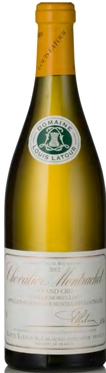
CHEVALIER-MONTRACHET Grand Cru "Les Demoiselles"

Vitigno: Chardonnay 100% Tipo di vino: bianco fermo Vinificazione e affinamento: fermentazione fûts (228 lt) - malolattica 100% - affinamento fûts nuovi 100% per 10 mesi