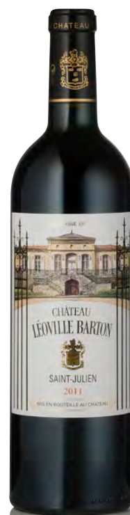
CHÂTEAU LÉOVILLE BARTON 2 ème Grand Cru Classé - Saint Julien

Vitigno: Cabernet S. 70% - Merlot 30% Tipo di vino: rosso Vinificazione e affinamento: fermentazione in acciaio - affinamento barriques nuove 50% per 18 mesi