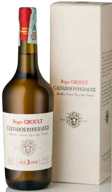
CALVADOS PAYS D'AUGE "3 ANS"