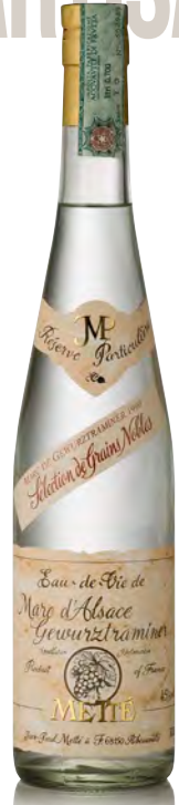
MARC DE GEWÜRZTRAMINER SÉLECTION GRAINS NOBLES 1990