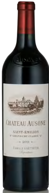
CHÂTEAU AUSONE 1 er Grand Cru Classé "A" - Saint Émilion

Vitigno: Cabernet F. 55% - Merlot 43% Tipo di vino: rosso Vinificazione e affinamento: diraspatura totale - fermentazione in tini legno - affinamento barriques nuove 100% per 20 mesi