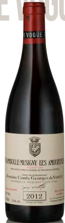
CHAMBOLLE-MUSIGNY 1 er Cru "Les Amoureuses"

Vitigno: Pinot nero 100% Tipo di vino: rosso fermo Vinificazione e affinamento: l'azienda non fornisce informazioni sulla vinificazione dato che varia a seconda del millesimo