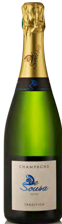
CHAMPAGNE BRUT "Tradition"

Vitigno: Chardonnay 40% - Meunier 40% - Pinot nero 20% Tipo di vino: metodo classico bianco Vinificazione e affinamento: fermentazione in acciaio - Permanenza sui lieviti 24 mesi - 20% vini di riserva