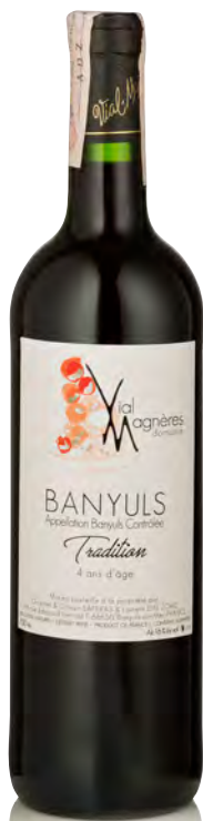
BANYULS Tradition 4 ans

Vitigno: Grenache Noir 70% - Grenache gris 30% Tipo di vino: rosso dolce Vinificazione e affinamento: fermentazione in cemento - mutizzazione con Marc - affinamento ossidativo in botti legno da 40 e 60 ettolitri