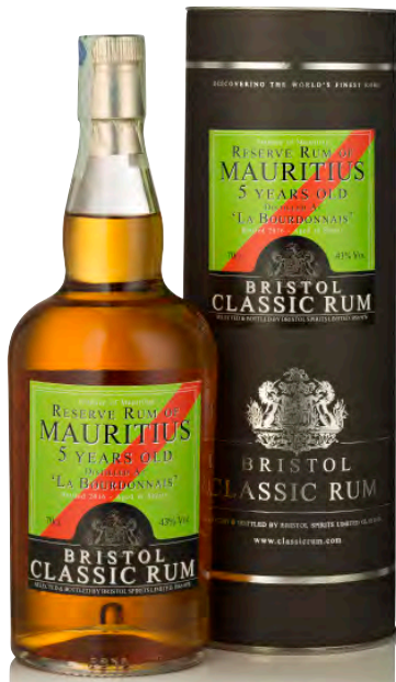
RESERVE RUM MAURITIUS 5 YEARS OLD SHERRY

Blend of Trinidad & Tobago and Mauritius Rums