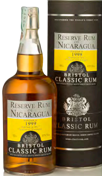
RUM RESERVE OF NICARAGUA 1999