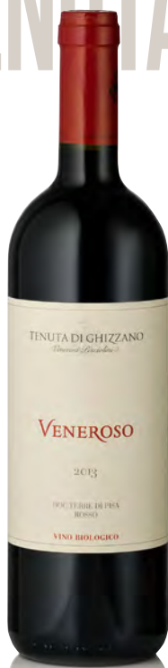
"VENEROSO" TERRE DI PISA DOC

Vitigno: Sangiovese 95% - Merlot 5% Tipo di vino: rosso fermo Vinificazione e affinamento: fermentazione con lieviti indigeni in acciaio - affinamento acciaio e cemento