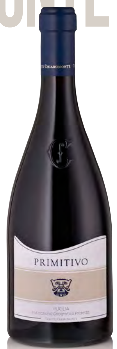
PRIMITIVO PUGLIA "MASCHERONE"

Vitigno: Primitivo Tipo di vino: rosato Vinificazione e affinamento: pressatura soffice delle uve - fermentazione in acciaio - affinamento 10 mesi acciaio - 3 mesi di bottiglia