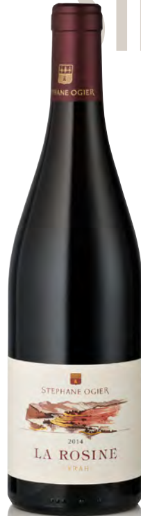
SYRAH "La Rosine"

Vitigno: Syrah 50% - Grenache 50% Tipo di vino: rosso fermo Vinificazione e affinamento: grappolo intero - fermentazione con lieviti indigeni in cemento - affinamento cemento per 10 mesi