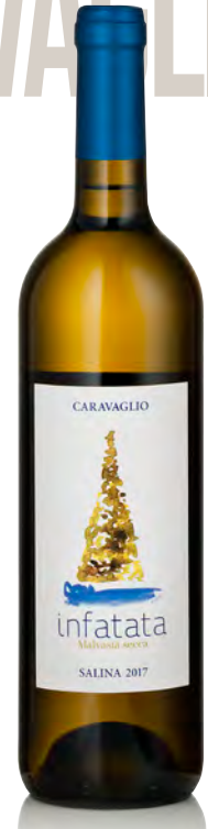
"INFATATA" MALVASIA BIANCO SECCO SALINA IGP

Vitigno: Malvasia Tipo di vino: bianco secco Vinificazione e affinamento: fermentazione in acciaio con lieviti autoctoni - breve affinamento in acciaio