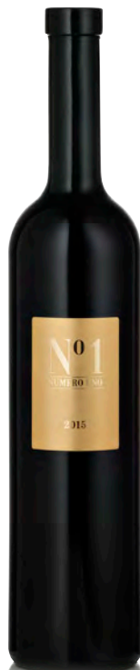
N°1 - NUMERO UNO ALPI RETICHE IGT

Vitigno: Nebbiolo Tipo di vino: rosso fermo Vinificazione e affinamento: appassimento per 3 mesi - macerazione di 10 giorni sulle bucce - affinamento 60 mesi legno grande