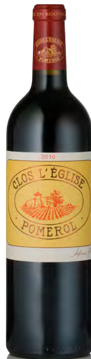
CLOS L'ÉGLISE Pomerol

Vitigno: Merlot 88% - Cabernet S. 12% Tipo di vino: rosso Vinificazione e affinamento: diraspatura totale - fermentazione acciaio - affinamento barriques nuove 50% per 18 mesi