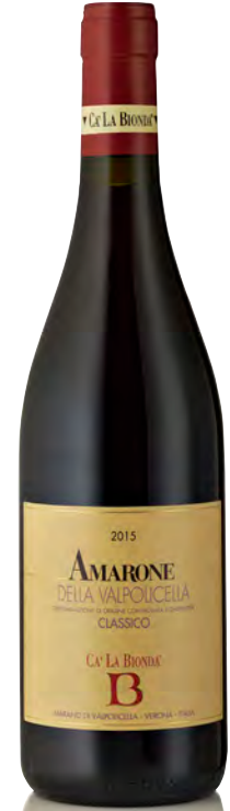
AMARONE DELLA VALPOLICELLA CLASSICO DOCG

Vitigno: Corvina 70% - Corvinone 20% - Rondinella e Molinara 10% Tipo di vino: rosso Vinificazione e affinamento: fermentazione acciaio - affinamento legno da 30 hl per 10 anni