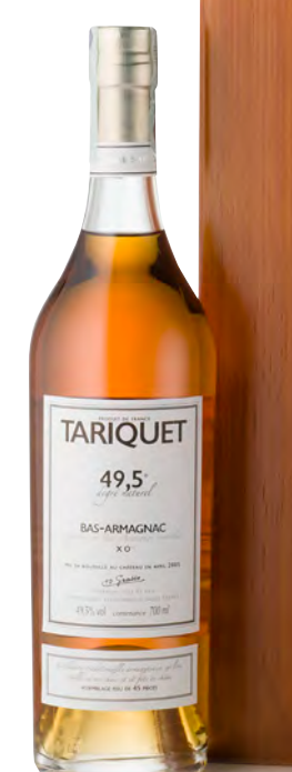
BAS-ARMAGNAC X.O. 49,5°