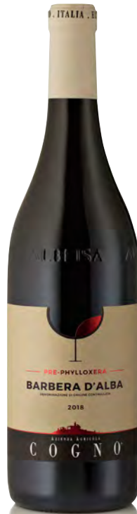
BARBERA D'ALBA DOC "PRE-PHYLLOXERA"

Vitigno: Nebbiolo Tipo di vino: rosso Vinificazione e affinamento: fermentazione in acciaio - affinamento 8 mesi acciaio