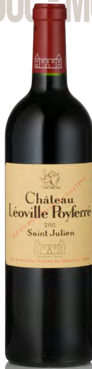
CHÂTEAU LÉOVILLE POYFERRÉ 2 ème Grand Cru Classé - Saint Julien

Vitigno: Cabernet S. 61% - Merlot 29% - Cabernet F. 7% - Petit Verdot 3% Tipo di vino: rosso Vinificazione e affinamento: fermentazione 50% cemento e 50% tini legno - macerazione 30 gg. - affinamento barriques nuove 80% per 18 mesi