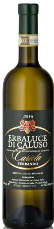
ERBALUCE DI CALUSO DOCG "CARIOLA"

Vitigno: Erbaluce Tipo di vino: bianco fermo Vinificazione e affinamento: fermentazione in acciaio - vinificazione in acciaio