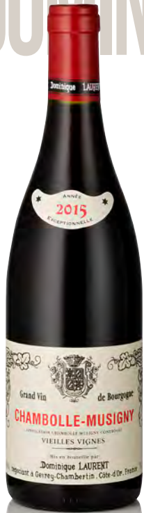
CHAMBOLLE-MUSIGNY Vieilles Vignes

Vitigno: Pinot nero 100% Tipo di vino: rosso fermo Vinificazione e affinamento: fermentazione acciaio - affinamento fûts nuovi 30% per 12 mesi