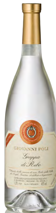
GRAPPA DI REBO