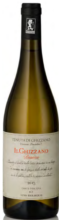
"IL GHIZZANO" BIANCO

Vitigno: Merlot 60% - Cabernet Franc 20% - Petit Verdot 20% Tipo di vino: rosso fermo Vinificazione e affinamento: fermentazione con lieviti indigeni in tini di legno - affinamento 18 mesi barrique di 2°, 3° e 4° passaggio