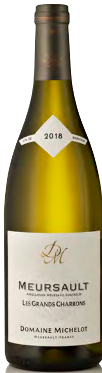
MEURSAULT BLANC "Les Grands Charrons"

Vinificazione e affinamento: fermentazione in tonneaux - affinamento di 16 mesi 70% in fûts ed il restante 30% in tonneaux e uova di gres