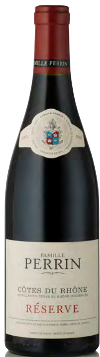
CÔTES DU RHÔNE ROUGE RÉSERVE

Vitigno: Grenache 50% - Syrah 30% - Mourvedre 20% Tipo di vino: rosso fermo Vinificazione e affinamento: fermentazione in acciaio - affinamento in acciaio 75% e legno grande 25%