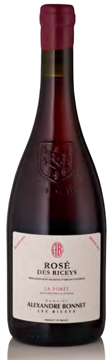
ROSÉ DES RICEYS La Forêt

Vitigno: Pinot noir Tipo di vino: metodo classico rosato Vinificazione e affinamento: macerazione di 24 ore preferibilmente a freddo - affinamento in acciaio – malolattica svolta - almeno 36 mesi sui lieviti