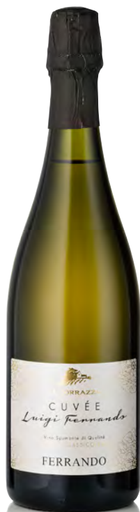
SPUMANTE METODO CLASSICO BRUT CUVÉE "LUIGI FERRANDO" ERBALUCE DI CALUSO

Vitigno: Nebbiolo Tipo di vino: rosso fermo Vinificazione e affinamento: macerazione per 10 giorni e fermentazione in acciaio - affinamento 24 mesi barrique