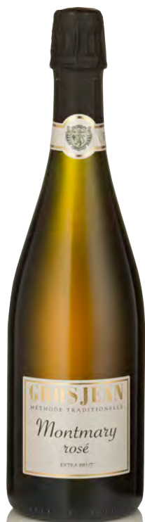
"MONTMAYR" ROSÉ METODO CLASSICO EXTRA BRUT

Vitigno: Uve internazionali Tipo di vino: metodo classico rosato Vinificazione e affinamento: fermentazione in acciaio - 15 mesi sui lieviti