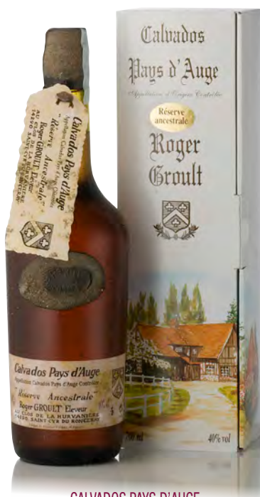
CALVADOS PAYS D'AUGE "RÉSERVE ANCESTRALE"