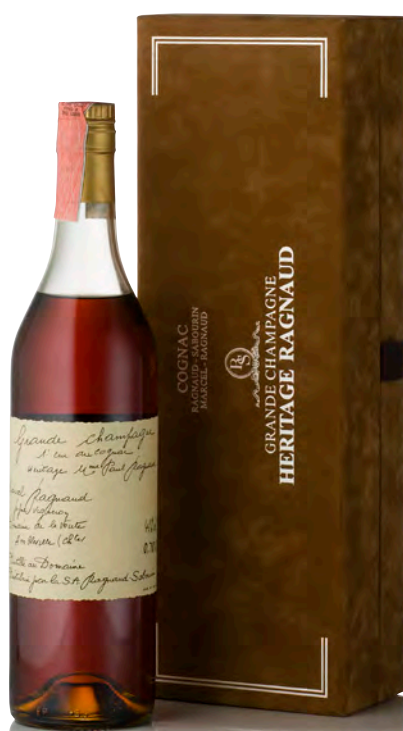
COGNAC GRANDE CHAMPAGNE HÉRITAGE RAGNAUD