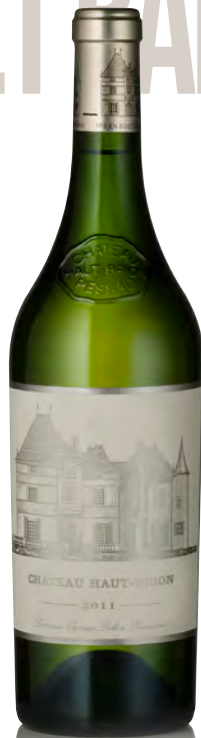
CHÂTEAU HAUT BRION BLANC Pessac-Léognan

Vinificazione e affinamento: uve bottrizzate - fermentazione barriques - affinamento 12 mesi barriques