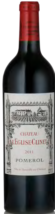
CHÂTEAU L'ÉGLISE CLINET Pomerol

Vitigno: Merlot 100% Tipo di vino: rosso Vinificazione e affinamento: fermentazione vasche di cemento - affinamento barriques nuove per 18 mesi