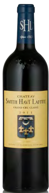
CHATEAU SMITH HAUT LAFITTE Grand Cru Classé - Pessac-Léognan

Vitigno: Cabernet S. 65% - Merlot 30% - Cabernet F. 5% Tipo di vino: rosso Vinificazione e affinamento: fermentazione in piccoli tini di legno con pigeage manuali - affinamento barriques nuove 60% per 18 mesi