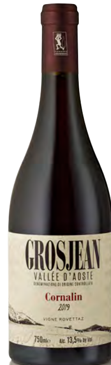
VALLE D'AOSTA DOC CORNALIN "VIGNE ROVETTAZ"

Vinificazione e affinamento: 10 gg. di macerazione - 3 follature giornaliere con lievito indigeno - affinamento acciaio