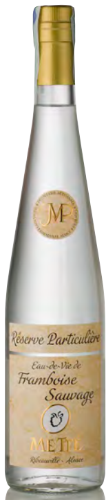
EAU DE VIE DE FRAMBOISE SAUVAGE