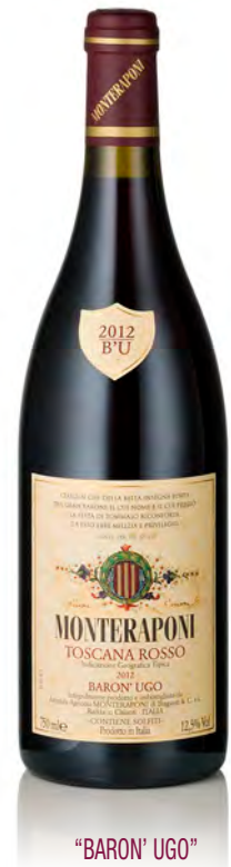
"BARON' UGO" ROSSO TOSCANA IGT

Vitigno: Sangiovese 90% - Cannaiolo 7%, Colorino 3% Tipo di vino: rosso fermo Vinificazione e affinamento: macerazione sulle bucce 35 giorni - fermentazione cemento - affinamento legno grande 26 mesi