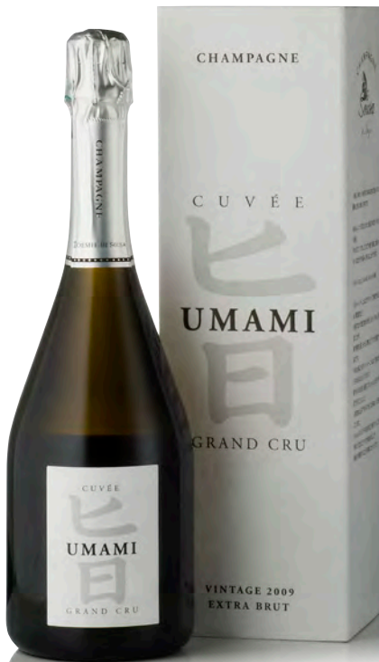
CHAMPAGNE EXTRA BRUT Grand Cru Millésimé Cuvée "Umami"

Vitigno: Chardonnay 100% Tipo di vino: metodo classico bianco Vinificazione e affinamento: fermentazione in barriques - permanenza sui lieviti 96 mesi