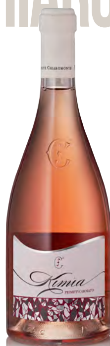
PRIMITIVO ROSATO PUGLIA IGT "KIMIA"

Vitigno: Fiano Minutolo Tipo di vino: bianco Vinificazione e affinamento: fermentazione in acciaio - affinamento 10 mesi acciaio sui lieviti - 3 mesi di bottiglia