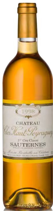
CHÂTEAU CLOS HAUT PEYRAGUEY 1 er Grand Cru Classé - Sauternes

Vinificazione e affinamento: uve bottrizzate - fermentazione barriques - affinamento barriques nuove 50% per 18 mesi