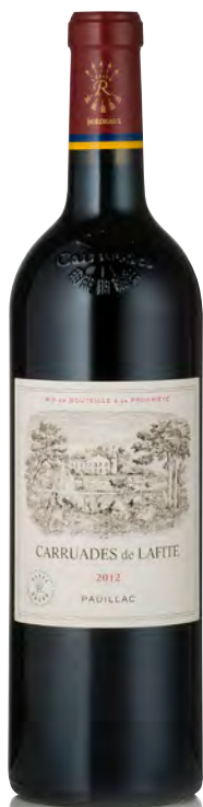
CARRUADES DE LAFITE Pauillac

Vitigno: Cabernet S. 70% - Merlot 24% - Cabernet F. 4% - Petit Verdot 2% Tipo di vino: rosso Vinificazione e affinamento: fermentazione in piccoli tini di legno - affinamento in barriques nuove 75% per 18 mesi