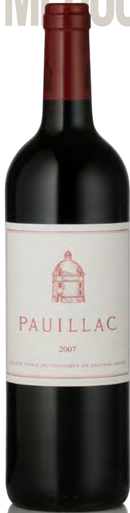
PAUILLAC DE LATOUR Pauillac

Vitigno: Cabernet S. 50% - Merlot 45% - Cabernet F. 3% - Petit Verdot 2% Tipo di vino: rosso Vinificazione e affinamento: fermentazione acciaio separata per vitigno - affinamento barriques nuove 20% per 18 mesi