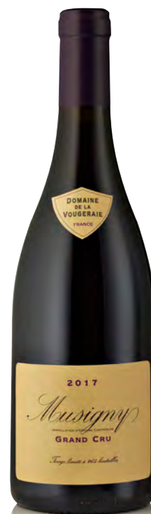
MUSIGNY GRAND CRU

Vinificazione e affinamento: biodinamica dal 2006 - fermentazione acciaio 100% grappolo intero - affinamento fûts nuovi 40% per 16 mesi