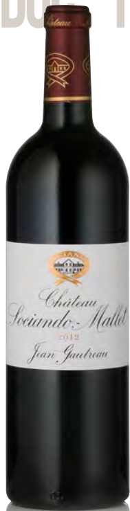
CHÂTEAU SOCIANDO - MALLET Haut-Médoc

Vitigno: Merlot 54% - Cabernet S. 42% - Cabernet F. 4% Tipo di vino: rosso Vinificazione e affinamento: lieviti indigeni - fermentazione in acciaio e cemento - affinamento barriques nuove 50% per 18 mesi