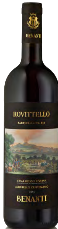
ETNA ROSSO RISERVA DOC "ROVITELLO PARTICELLA NO.342"

Vitigno: Nerello mascalese Tipo di vino: rosso Vinificazione e affinamento: fermentazione in acciaio con lieviti autoctoni - macerazione 21 giorni - affinamento tonneaux 12 mesi