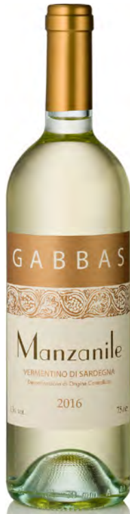
VERMENTINO DI SARDEGNA DOC "MANZANILE"

Vitigno: Vermentino Tipo di vino: bianco fermo Vinificazione e affinamento: fermentazione in acciaio e permanenza sur lie - affinamento in acciaio per 7 mesi