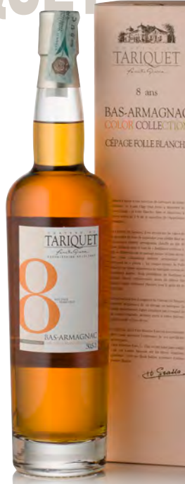
BAS-ARMAGNAC FOLLE BLANCHE 8 ANS