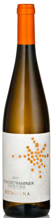
TRENTINO DOC GEWÜRZTRAMINER

Vitigno: Moscato giallo Tipo di vino: bianco fermo Vinificazione e affinamento: macerazione a freddo sulle bucce - affinamento acciaio sui lieviti