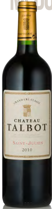
CHÂTEAU TALBOT 4 ème Grand Cru Classé - Saint Julien

Vitigno: Cabernet S. 66% - Merlot 30% - Petit Verdot 4% Tipo di vino: rosso Vinificazione e affinamento: fermentazione acciaio e tini legno - affinamento barriques nuove 50% per 18 mesi