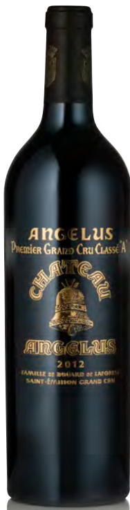
CHÂTEAU ANGÉLUS 1 er Grand Cru Classé "A" - Saint Émilion

Vitigno: Cabernet F. 52% - Merlot 43% - Cabernet S. 5% Tipo di vino: rosso Vinificazione e affinamento: diraspatura totale - fermentazione in vasche cemento - affinamento barriques nuove 30% per 18 mesi