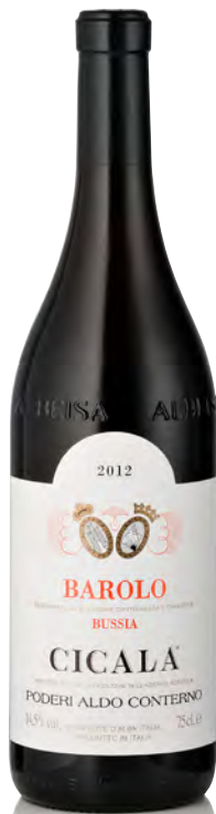
BAROLO BUSSIA DOCG "CICALA"

Vitigno: Nebbiolo Tipo di vino: rosso fermo Vinificazione e affinamento: macerazione sulle bucce in acciaio per 6/8 giorni - affinamento acciaio per 12 mesi e barrique per 12 mesi