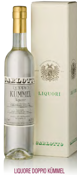
LIQUORE DOPPIO KÜMMEI