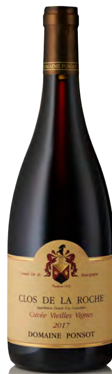
CLOS DE LA ROCHE Grand Cru Vieilles Vignes

Vitigno: Pinot nero 100% Tipo di vino: rosso fermo Vinificazione e affinamento: diraspatura parziale - fermentazione in tini legno aperti - pressa verticale - affinamento in fûts mai nuovi, anche di 7° e 8° passaggio