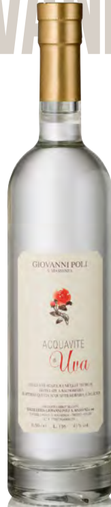
ACQUAVITE D'UVA DI MÜLLER THURGAU E NOSIOLA