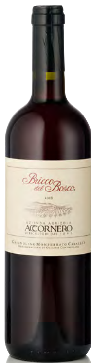
GRIGNOLINO DEL MONFERRATO CASALESE DOC "BRICCO DEL BOSCO"

Vitigno: Barbera Tipo di vino: rosso vivace Vinificazione e affinamento: fermentazione e vinificazione in acciaio