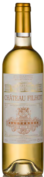
CHÂTEAU FILHOT 2 ème Grand Cru Classé - Sauternes

Vinificazione e affinamento: uve bottrizzate - fermentazione barriques - affinamento barriques nuove 20% per 20 mesi