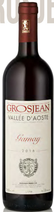
VALLE D'AOSTA DOC GAMAY