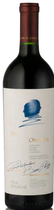
OPUS ONE NAPA VALLEY

Vitigno: Cabernet S. 80% - Cabernet F. 8% - Merlot 6% - Petit Verdot 4% - Malbec 2% Tipo di vino: rosso fermo Vinificazione e affinamento: fermentazione in acciaio - affinamento 18 mesi barriques nuove - assemblaggio dopo affinamento