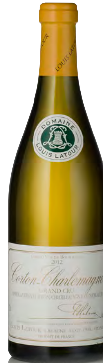
CORTON-CHARLEMAGNE Grand Cru

Vitigno: Chardonnay 100% Tipo di vino: bianco fermo Vinificazione e affinamento: fermentazione fûts (228 lt) - malolattica 100% - affinamento fûts nuovi 50% per 10 mesi