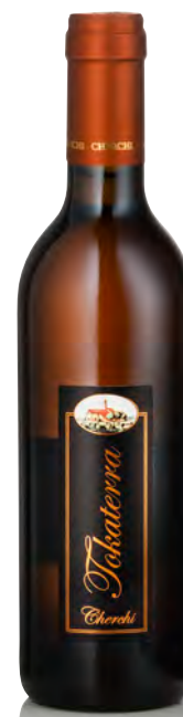
"TOKATERRA" VINO DA UVE DI VERMENTINO STRAMATURE

Vitigno: Vermentino Tipo di vino: metodo classico bianco Vinificazione e affinamento: fermentazione in acciaio e permanenza sulle fecce per 6 mesi - rifermentazione in bottiglia per 18 mesi