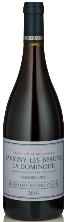
SAVIGNY-LÈS-BEAUNE 1 er cru "la Dominode"

Vitigno: Chardonnay 100% Tipo di vino: bianco fermo Vinificazione e affinamento: uve raramente diraspate - fermentazione e affinamento in tonneau da 600 litri con leggero bâtonnage