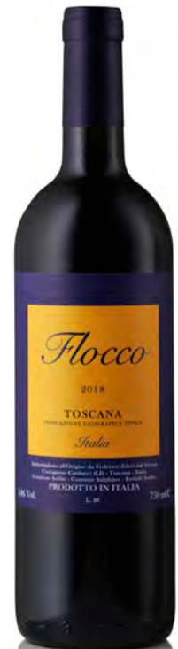
TOSCANA IGT "FLOCCO"

Vitigno: Cabernet Sauvignon 70% - Cabernet Franc 15% - Merlot 15% Tipo di vino: rosso fermo Vinificazione e affinamento: fermentazione acciaio e legno - macerazione di 30 giorni - affinamento 18 mesi tonneaux