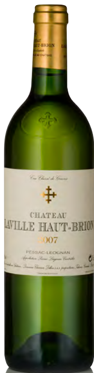
CHÂTEAU LAVILLE HAUT BRION BLANC Pessac-Léognan

Vinificazione e affinamento: fermentazione barriques - affinamento barriques nuove 50% per 12 mesi