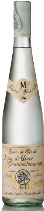
MARC DE GEWÜRZTRAMINER