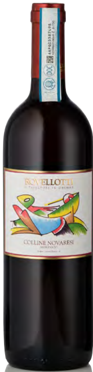
COLLINE NOVARESIS DOC "MORENICO"

Vitigno: Nebbiolo 60% - Vespolina 20% - Bonarda 20% Tipo di vino: rosso fermo Vinificazione e affinamento: fermentazione e affinamento in acciaio