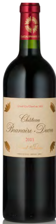
CHÂTEAU BRANAIRE-DUCRU 4 ème Grand Cru Classé - Saint Julien

Vitigno: Cabernet S. 67% - Merlot 28% - Petit Verdot 5% Tipo di vino: rosso Vinificazione e affinamento: fermentazione acciaio - macerazione di 15 giorni - affinamento barriques nuove 60% per 21 mesi