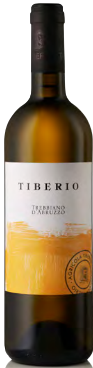
TREBBIANO D'ABRUZZO DOP

Vitigno: Trebbiano abruzzese Tipo di vino: bianco fermo Vinificazione e affinamento: macerazione a freddo - fermentazione e affinamento in acciaio - lieviti indigeni - no malolattica