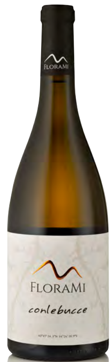
FALANGHINA CAMPANIA IGP "CONLEBUCCÈ"

Vitigno: Falanghina a piede franco Tipo di vino: bianco Vinificazione e affinamento: fermentazione acciaio con lieviti indigeni - macerazione 15 giorni - affinamento 8 mesi sui lieviti in acciaio