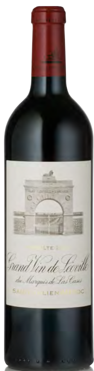
CHÂTEAU LÉOVILLE LAS CASES 2 ème Grand Cru Classé - Saint Julien

Vitigno: Cabernet S. 50% - Merlot 45% - Petit Verdot 5% Tipo di vino: rosso Vinificazione e affinamento: fermentazione cemento e acciaio - affinamento barriques nuove 50% per 16 mesi