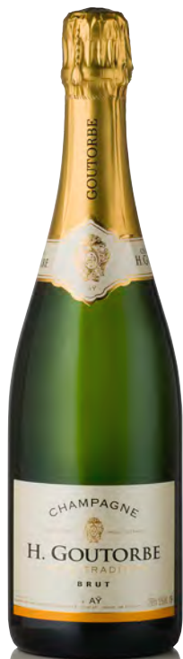
CHAMPAGNE BRUT "Cuvée Tradition"

Vitigno: Pinot noir 70% - Chardonnay 25% - Meunier 5% Tipo di vino: metodo classico bianco Vinificazione e affinamento: fermentazione acciaio - permanenza sui lieviti 36 mesi - malolattica svolta