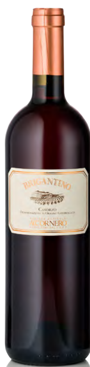
MALVASIA DOLCE CASORZO DOC "BRIGANTINO"

Vinificazione e affinamento: fermentazione e vinificazione in acciaio