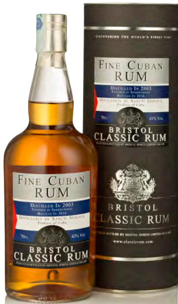
FINE CUBA RUM 2003