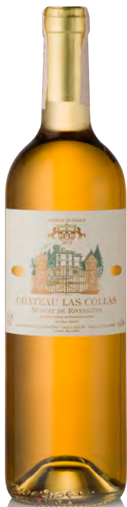
MUSCAT DE RIVESALTES

Vitigno: Grenache noir 100% Tipo di vino: bianco dolce Vinificazione e affinamento: lieviti indigeni - fermentazione acciaio - mutizzazione con Marc - breve affinamento acciaio