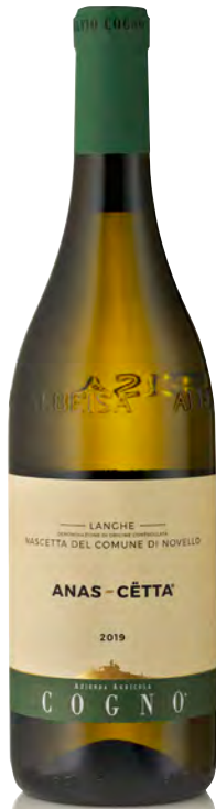
NASCETTA DEL COMUNE DI NOVELLO LANGHE DOC "ANAS-CÛTTA"

Vitigno: Nascetta Tipo di vino: bianco Vinificazione e affinamento: fermentazione in acciaio - affinamento 6 mesi acciaio sui lieviti e 3 mesi in legno da 15 hl