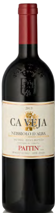
NEBBIOLO D'ALBA DOC "CA VEJA"

Vitigno: Nebbiolo Tipo di vino: rosso fermo Vinificazione e affinamento: fermentazione e macerazione in vasche verticali con cappello sommerso - affinamento 18 mesi legno grande