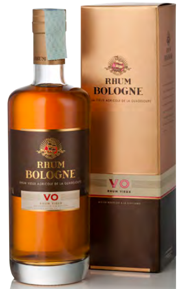
RHUM VIEUX AGRICOLE DE LA GUADELOUPE "VO"