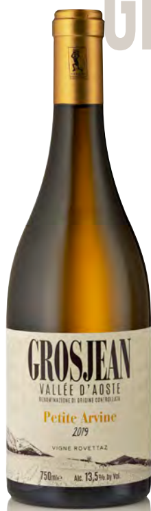
VALLE D'AOSTA DOC PETITE ARVINE "VIGNE ROVETTAZ"

Vitigno: Uve internazionali Tipo di vino: metodo classico rosato Vinificazione e affinamento: fermentazione in acciaio - 15 mesi sui lieviti