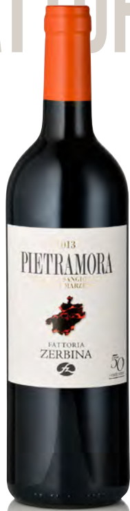
SANGIOVESE RISERVA DOCG ROMAGNA - MARZENO "PIETRAMORA"

Vitigno: Sangiovese Tipo di vino: rosso fermo Vinificazione e affinamento: vinificazione in tonneau e acciaio - affinamento barrique nuove (20%) e usate