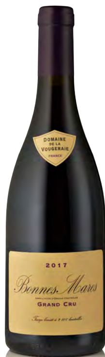
BONNES MARES GRAND CRU

Vinificazione e affinamento: biodinamica dal 2006 - fermentazione acciaio 25% grappolo intero - affinamento fûts nuovi 40% per 16 mesi