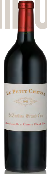
LE PETIT CHEVAL Grand Cru Classé - Saint Émilion

Vitigno: Cabernet F. 52% - Merlot 43% - Cabernet S. 5% Tipo di vino: rosso Vinificazione e affinamento: diraspatura totale - fermentazione in vasche cemento - affinamento barriques nuove 100% per 20 mesi