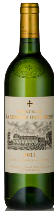
CHÂTEAU LA MISSION HAUT BRION BLANC Pessac-Léognan

Vinificazione e affinamento: fermentazione barriques - affinamento barriques nuove 50% per 12 mesi