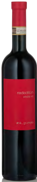
VALTELLINA SUPERIORE DOCG GRUMELLO RISERVA

Vitigno: Nebbiolo Tipo di vino: rosso fermo Vinificazione e affinamento: macerazione di 5 giorni sulle bucce - affinamento 48 mesi legno grande