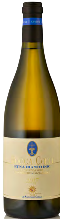
ETNA BIANCO DOC "ROCCA COELI"

Vitigno: Nerello mascalese Tipo di vino: rosso Vinificazione e affinamento: fermentazione acciaio con lieviti autoctoni - affinamento botte da 15 hl per 24 mesi