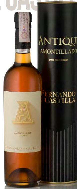
ANTIQUE SHERRY AMONTILLADO

Vitigno: Palomino fino 100% Tipo di vino: bianco secco Vinificazione e affinamento: fermentazione acciaio con aggiunta di alcol a raggiungere i 15° - invecchiamento medio 30 anni legno grande