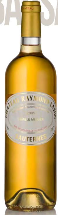
CHÂTEAU RAYMOND-LAFON Sauternes

Vitigno: Sémillon 80% - Sauvignon 20% Tipo di vino: bianco passito Vinificazione e affinamento: uve botritizzate - fermentazione in barriques - affinamento barriques nuove 100% per 36 mesi