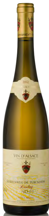
RIESLING D'ALSACE "Herrenweg de Turckheim"

Vitigno: Riesling 100% Tipo di vino: bianco fermo Vinificazione e affinamento: lunghissima fermentazione con lieviti indigeni, almeno 6 mesi sur lies - affinamento legno grande per 12 mesi