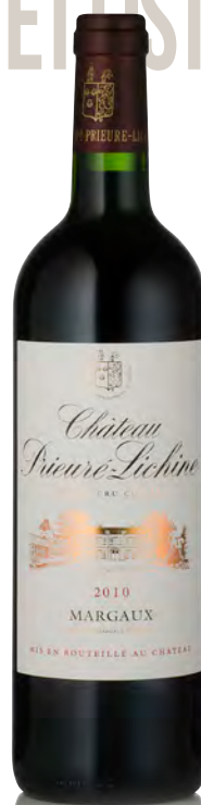
CHÂTEAU PRIEURÉ-LICHINE 4 ème Grand Cru Classé - Margaux

Vitigno: Cabernet S. 50% - Merlot 35% - Cabernet F. 10% - Petit Verdot 5% Tipo di vino: rosso Vinificazione e affinamento: fermentazione in acciaio - affinamento barriques nuove 80% per 15 mesi