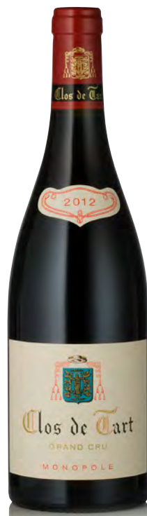
CLOS DE TART Grand Cru

Vitigno: Pinot nero 100% Tipo di vino: rosso fermo Vinificazione e affinamento: fermentazione acciaio - affinamento fût nuovi 100% per 17 mesi