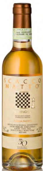
ALBANA DOCG PASSITO ROMAGNA "SCACCOMATTO"

Vitigno: Albana Tipo di vino: bianco passito Vinificazione e affinamento: uve appassite eda vendemmia tardiva - vinificazione acciaio e barrique - affinamento cemento