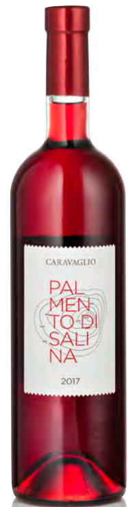
PALMENTO DI SALINA IGP

Vitigno: Corinto nero Tipo di vino: rosso secco Vinificazione e affinamento: fermentazione acciaio con lieviti autoctoni - 30 gg. di macerazione - affinamento di 1 anno legno grande e acciaio