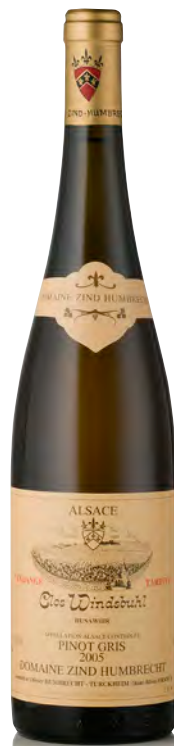
PINOT GRIS D'ALSACE "Clos Windsbuhl" - Vendange Tardive

Vitigno: Pinot-gris 100% Tipo di vino: bianco dolce Vinificazione e affinamento: uve parzialmente bottrizzate - lunghissima fermentazione con lieviti indigeni - affinamento legno piccolo