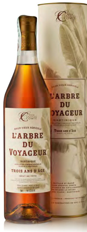
RHUM VIEUX AGRICOLE "L'ARBRE DU VOYAGEUR" TROIS ANS