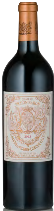
CHÂTEAU PICHON LONGUEVILLE BARON 2 ème Grand Cru Classé - Pauillac

Vitigno: Cabernet S. 70% - Merlot 25% - Cabernet F. 3% - Petit Verdot 2% Tipo di vino: rosso Vinificazione e affinamento: fermentazione tini legno e acciaio e uova di cemento da 50 e 125 hl - affinamento barriques nuove 100% per 18/20 mesi