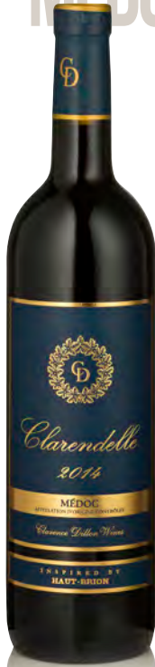
CLARENDELLE Médoc - Inspired by Haut Brion

Vitigno: Merlot 65% - Cabernet S. 35% Tipo di vino: rosso Vinificazione e affinamento: fermentazione in cemento - affinamento barriques usate