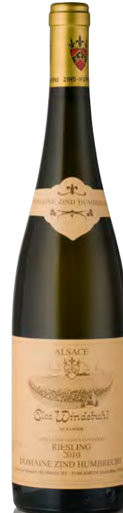
RIESLING D'ALSACE "Clos Windsbuhl"

Vitigno: Riesling 100% Tipo di vino: bianco fermo Vinificazione e affinamento: lunghissima fermentazione con lieviti indigeni, almeno 6 mesi sur lies - affinamento legno grande per 18 mesi