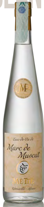
MARC DE MUSCAT