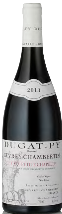
GEVREY-CHAMBERTIN 1 er Cru "Petite Chapelle" - Vieilles Vignes

Vitigno: Pinot nero 100% Tipo di vino: rosso fermo Vinificazione e affinamento: uve raramente diraspate - fermentazione in tini di legno e cemento - affinamento fûts nuovi 100% per 18 mesi - no filtrazione