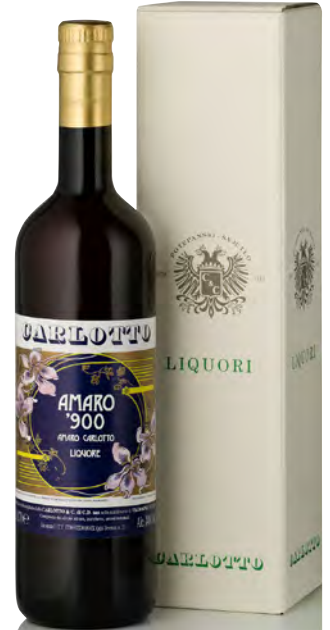
LIQUORE AMARO "900"