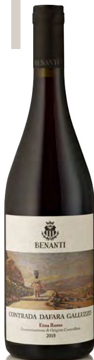
ETNA ROSSO DOC "CONTRADA DAFARA GALLUZZO"

Vitigno: Nerello mascalese Tipo di vino: rosso fermo Vinificazione e affinamento: fermentazione in acciaio con lieviti autoctoni - macerazione 21 gg. - affinamento tonneaux 12 mesi