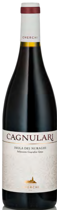
CAGNULARI IGT ISOLA DEI NURAGHI

Vitigno: Cannonau Tipo di vino: rosso fermo Vinificazione e affinamento: uve diraspate - fermentazione con bucce per 10 giorni - affinamento acciaio e legno per 6 mesi