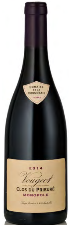
VOUGEOT "Clos du Prieuré Rouge"

Vitigno: Chardonnay Tipo di vino: bianco Vinificazione e affinamento: biodinamica dal 2006 - fermentazione e affinamento fûts nuovi 33% per 18 mesi